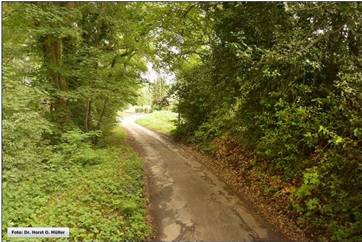
Die Rübültstege nach Norden, Blick zur Schüttorfer Straße