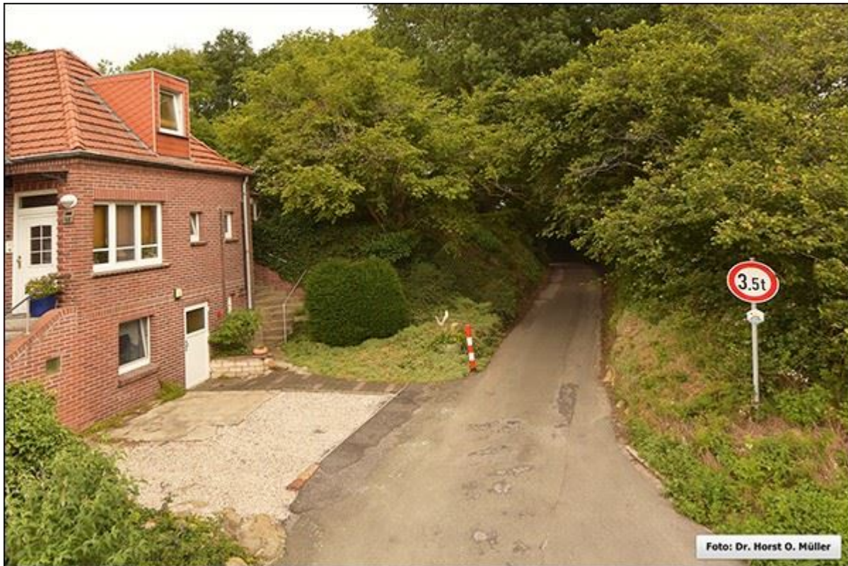
Die Rübültstege vom Kathagen aus, nach Norden