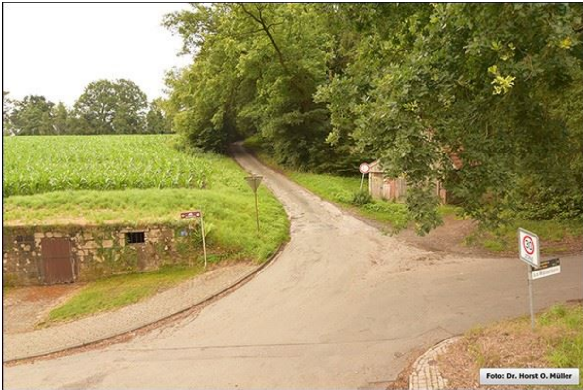
Rümbültstege nach Norden, von der Schüttofer Straße aus.