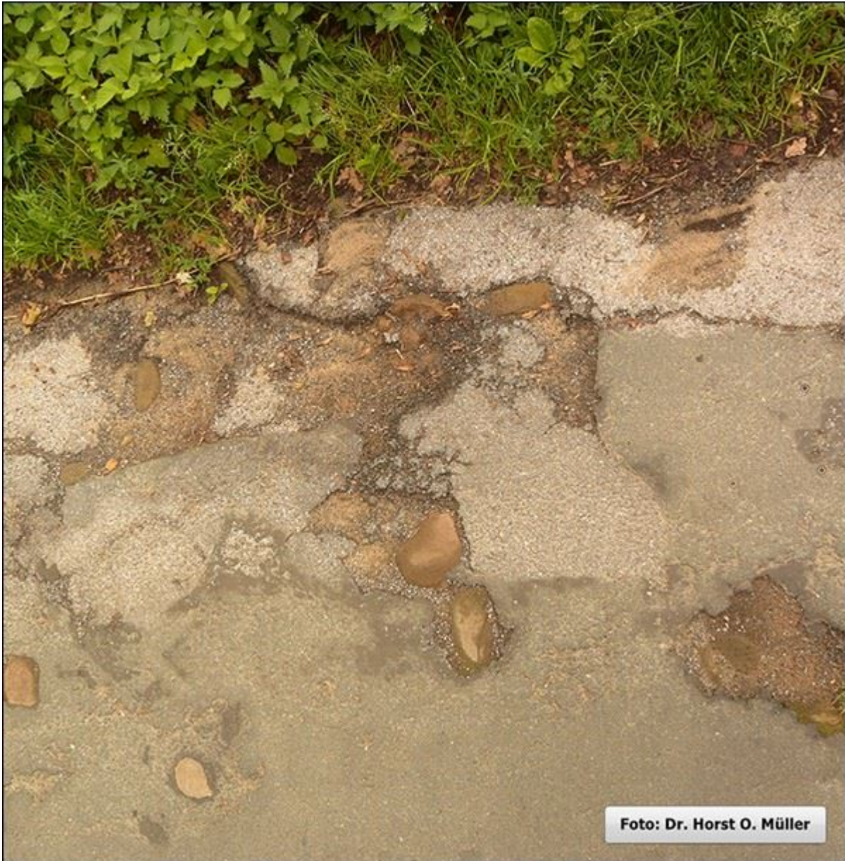
Stiegenbelag: Asphalt über Feldsteinen