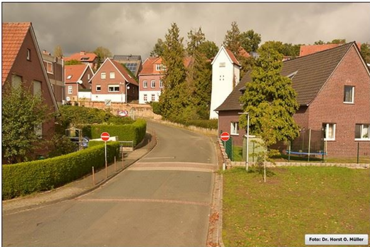
Im Stegehoek, Blick nach Norden, Mitte der Stiege