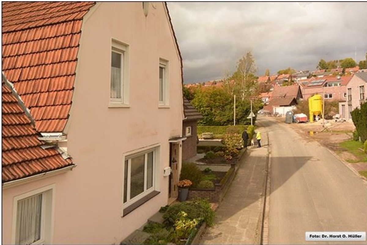
Im Stegehoek, Blick nach Norden