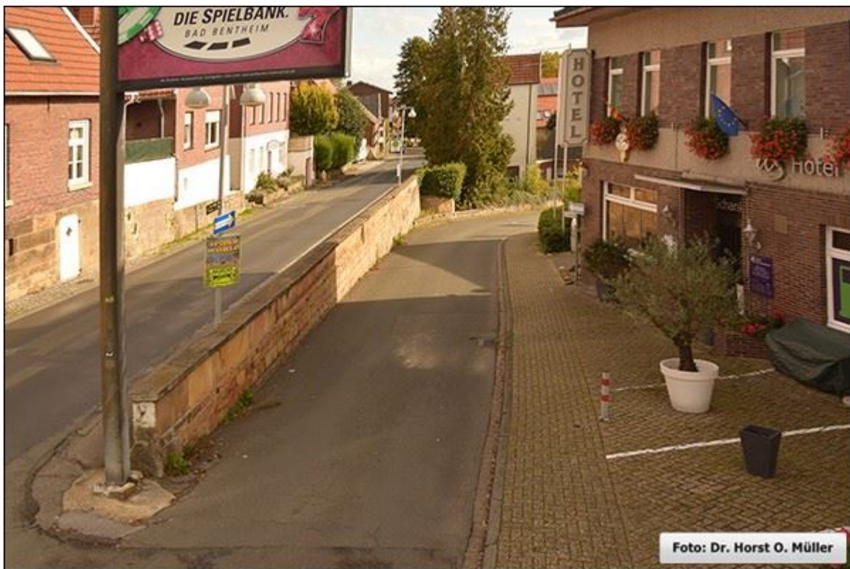
Im Stegehoek, oberer Abschnitt, Blick nach Südosten