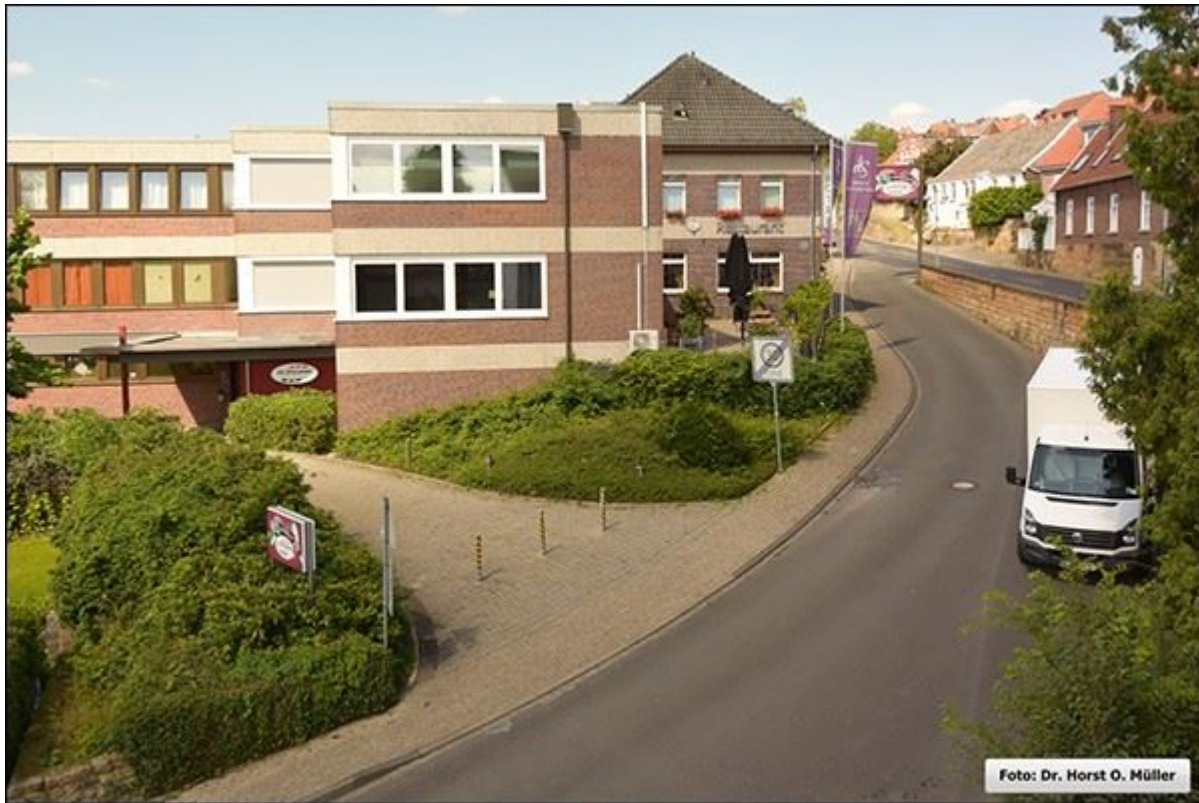
Im Stegehoek, Blick nach Nordwesten