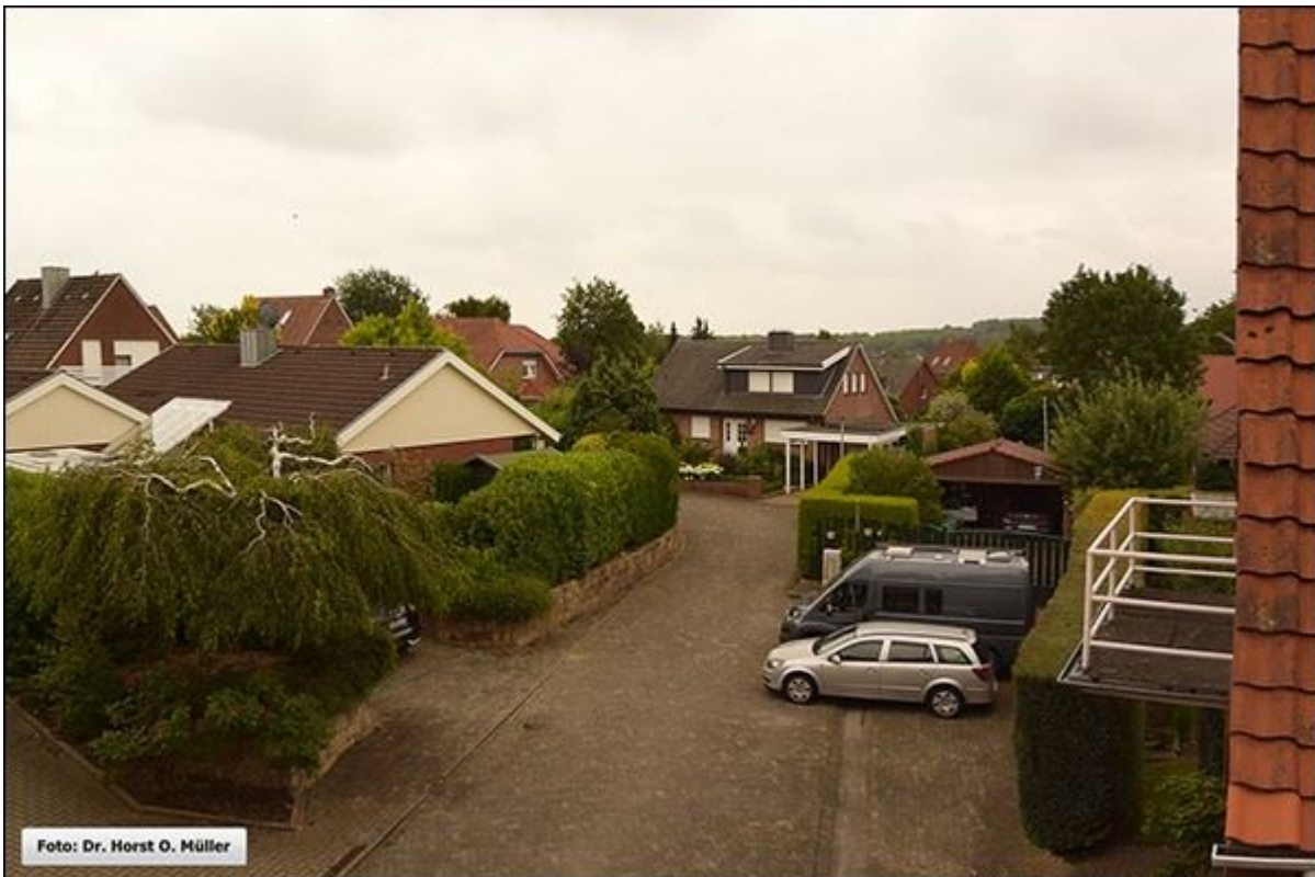
Mittlerer Bereich der Grönestege