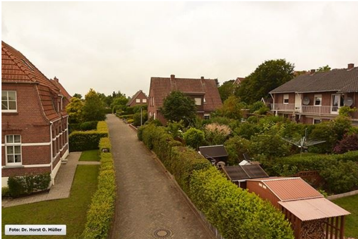
Blick aus der Kirchstraße in die Grönestege

Stiegenfreunde Bad Bentheim (Hrsg.): Stiegenkataster Bad Bentheim. Erstellt von Jürgen Schevel, © 2022. www.stiegenbadbentheim.de