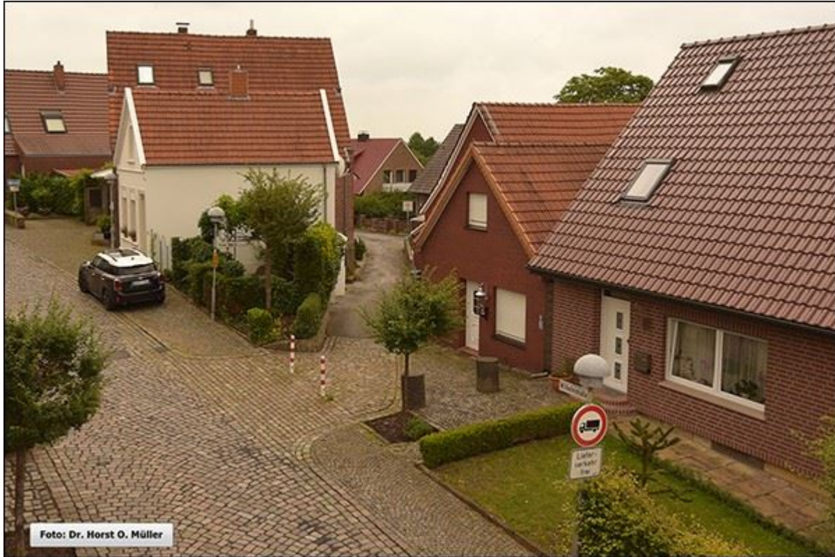
Blick aus der Wilhelmstraße in die Grönestege