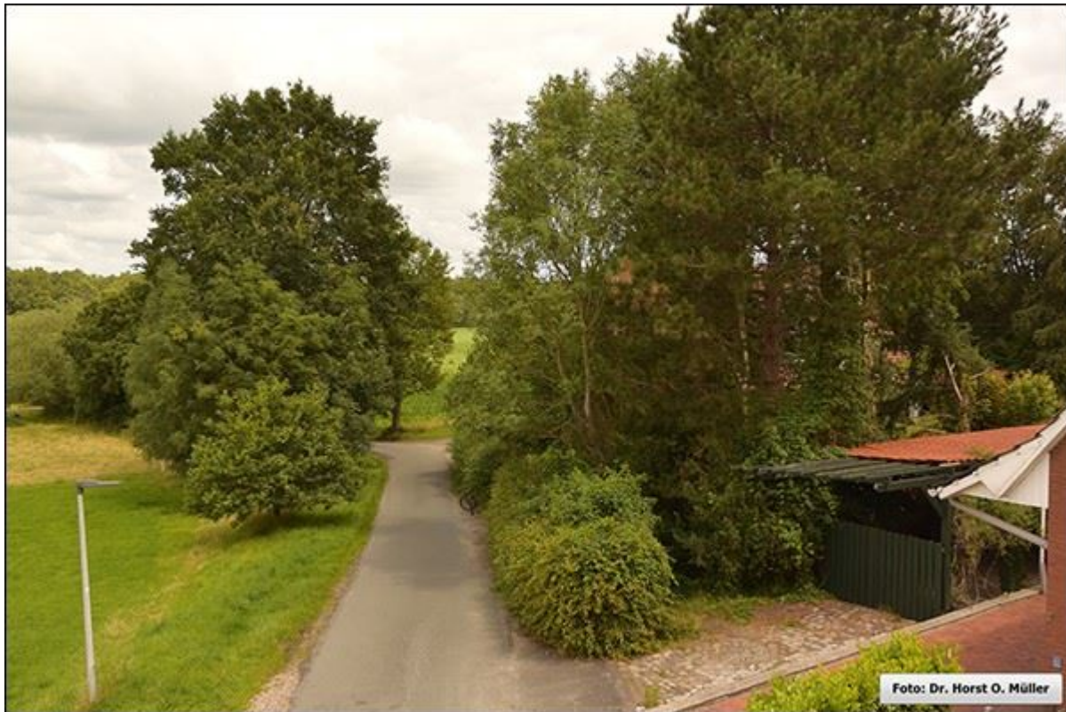
Blick auf eine Weggabelung (links weiter "Im Vogelsang", rechts "Kohstege"), Blick nach Norden