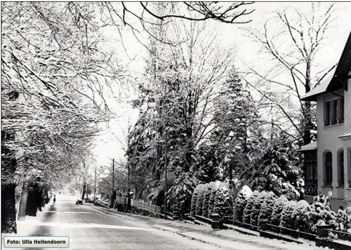
Obere Bahnhofstraße im Winter, Blick nach Norden