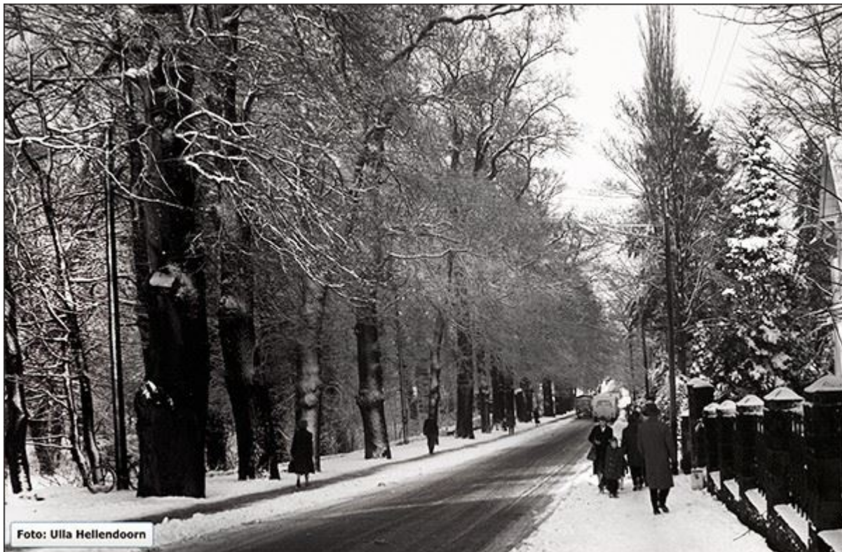
Obere Bahnhofstraße im Winter, Blick nach Norden