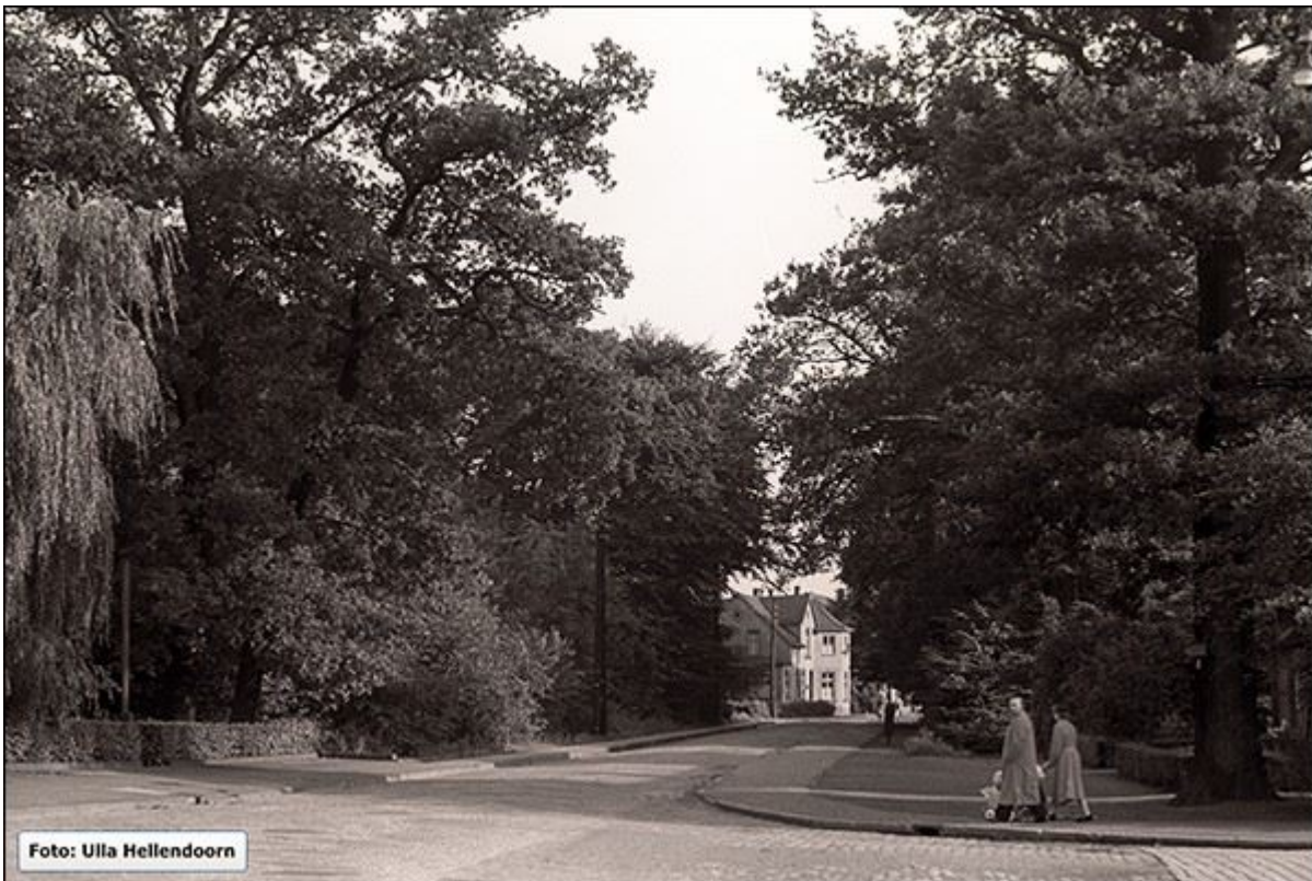
Untere Bahnhofstraße, Blick nach Süden