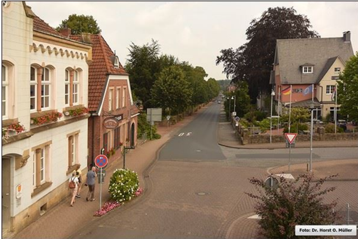
Obere Bahnhofstraße, Blick nach Norden, Aufnahme aus erhöhter Position.

Stiegenfreunde Bad Bentheim (Hrsg.): Stiegenkataster Bad Bentheim. Erstellt von Jürgen Schevel, © 2022. www.stiegenbadbentheim.de