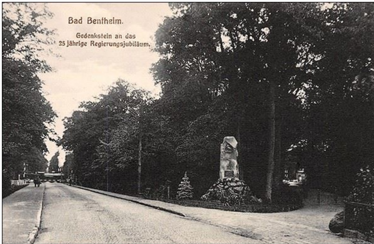
Bad Bentheim. Gedenkstein an das 25 jährige Regierungsjubiläum.