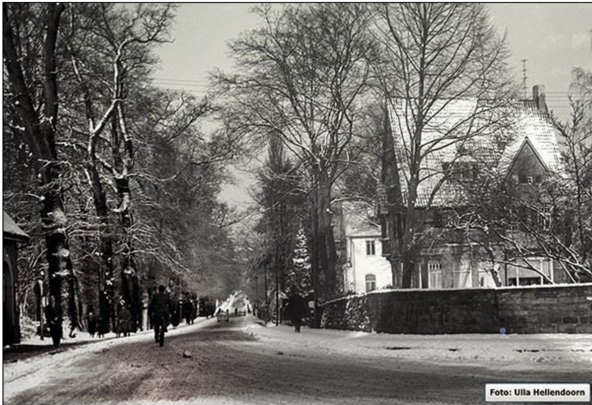
Obere Bahnhofstraße im Winter, Blick nach Norden