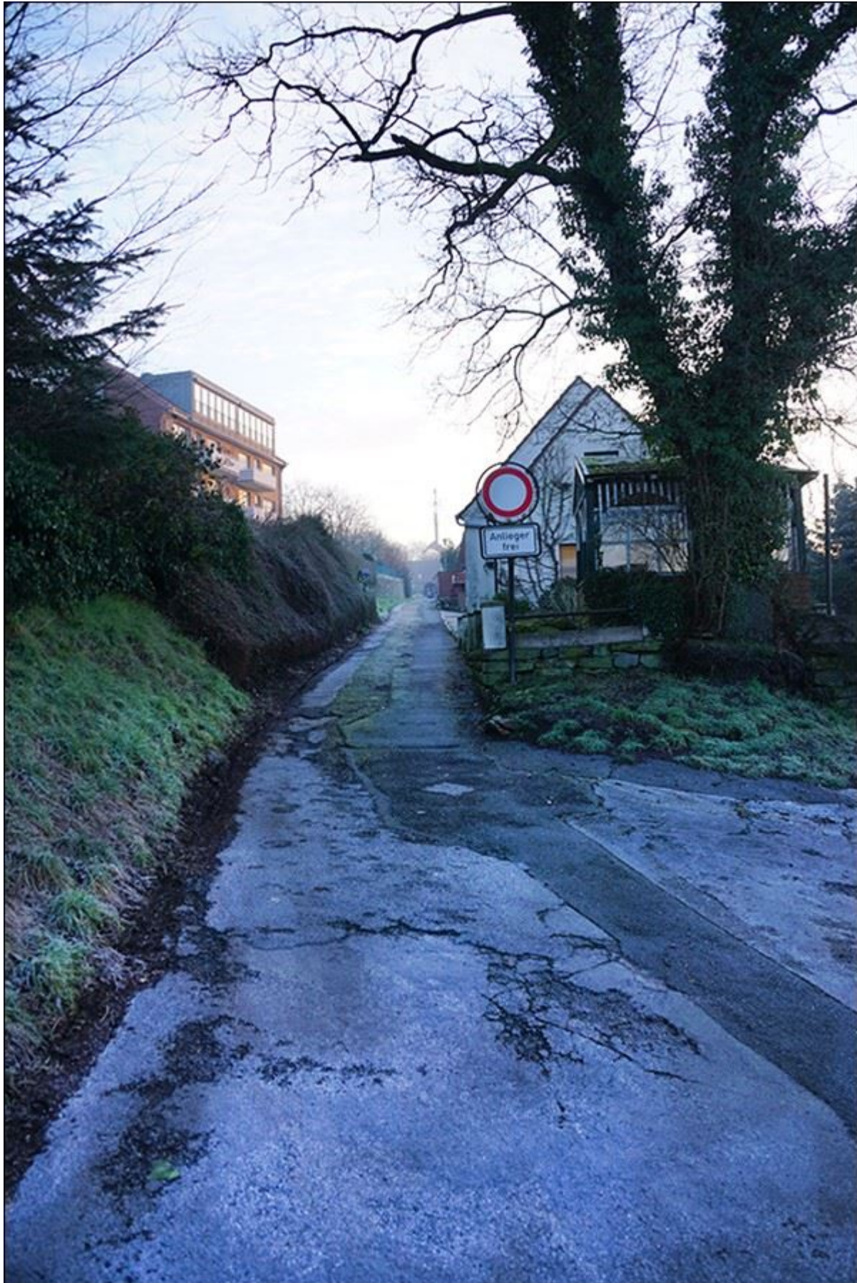
Blick in die Schultjahnstiege (nach Nordosten)