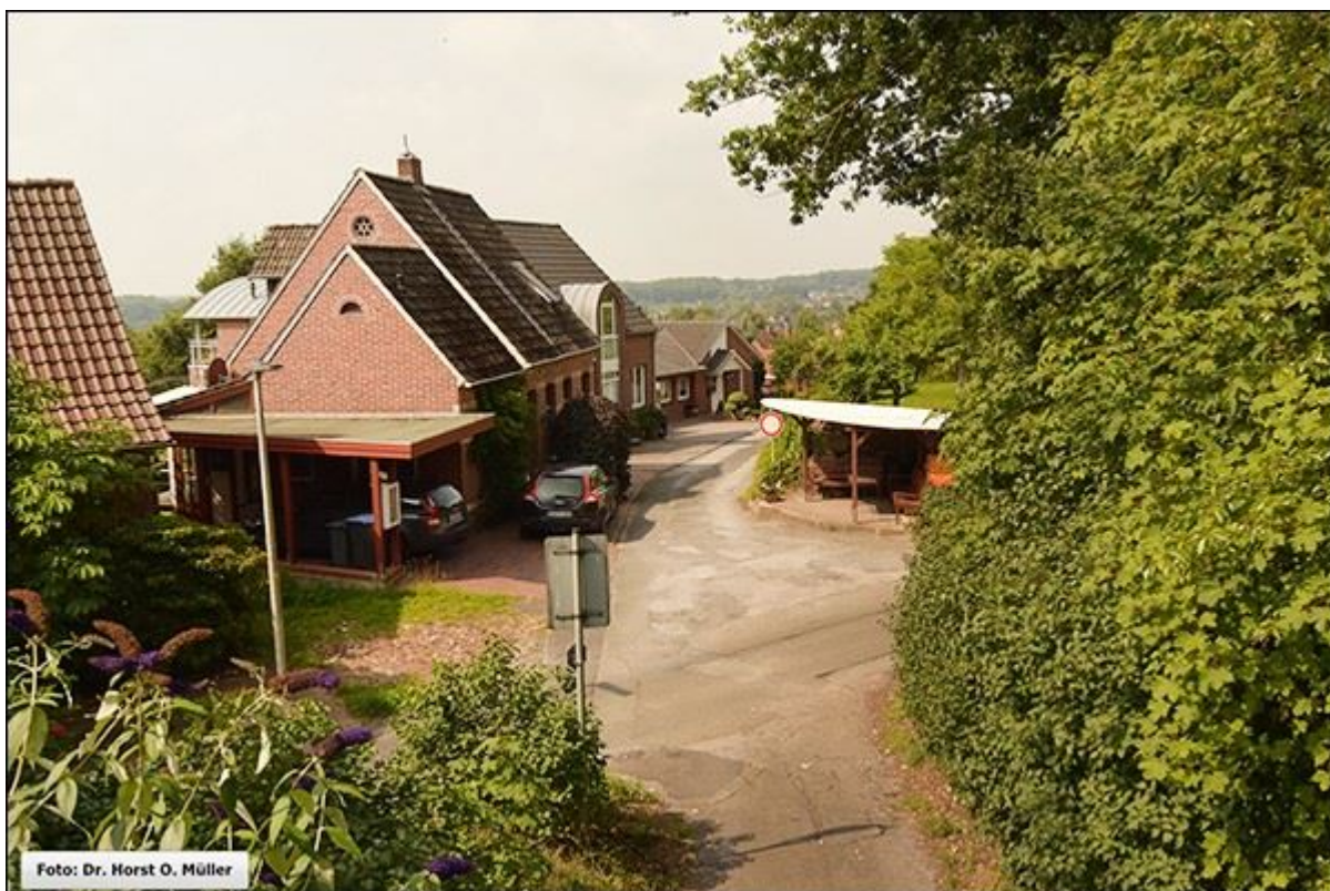
Blick in die Schultjahnstiege, Blick nach Südwesten