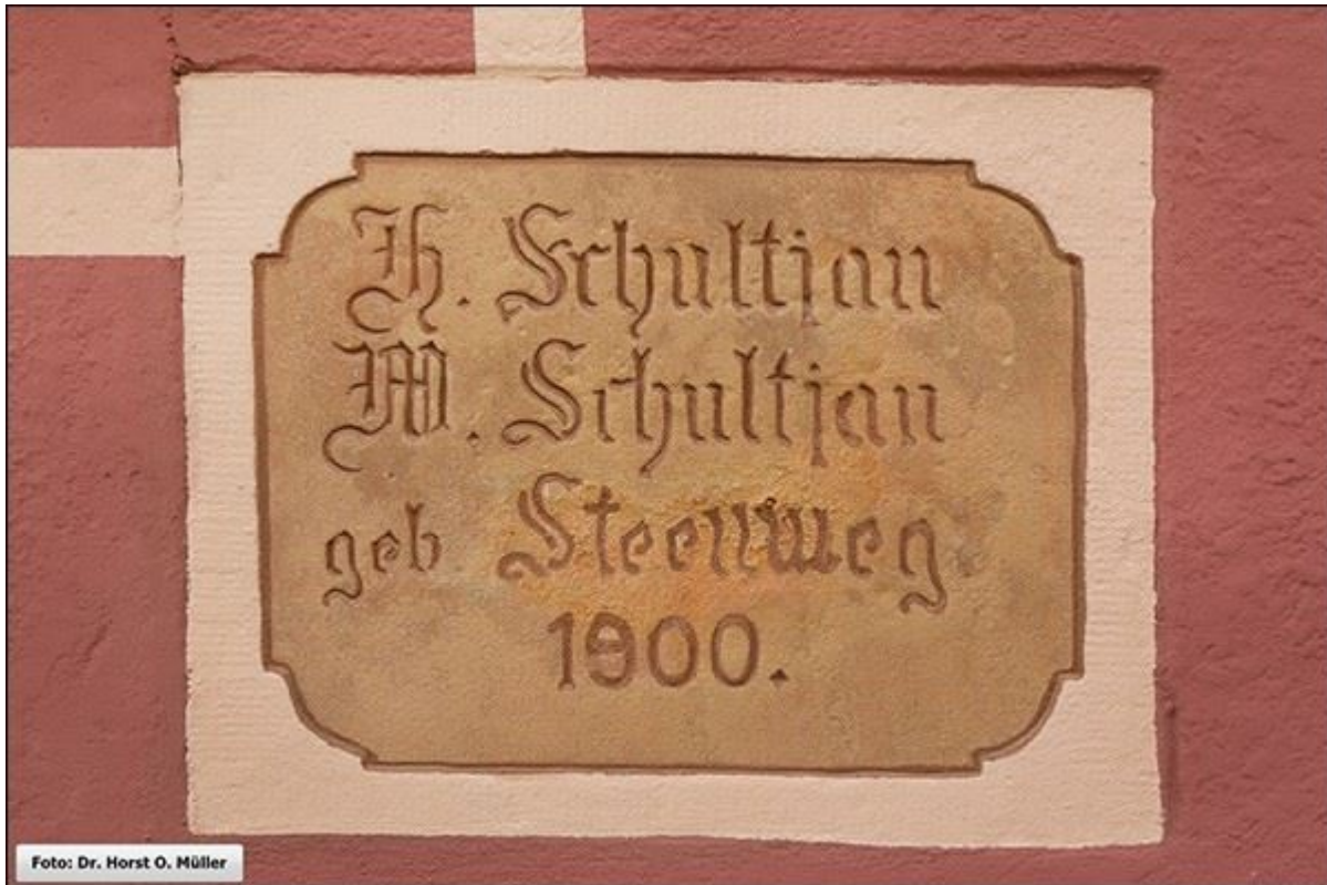
Namensgebender Hausstein in der Schultjahnstiege