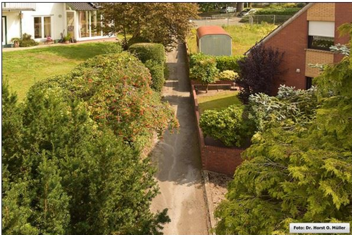
Blick in die Verlängerung der Schultjahnstiege nach Nordosten