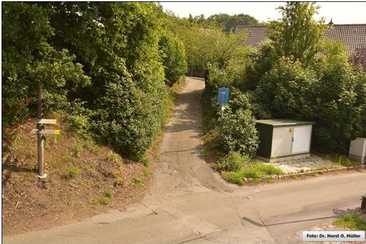
Blick in die Verlängerung der Schultjahnstiege jenseits der Straße "Am Berghang" nach Nordosten