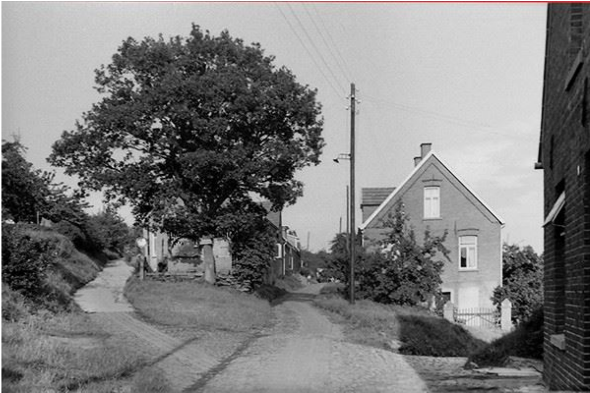
Blick aus der Löwenstraße in die Schultjahnstiege (links)