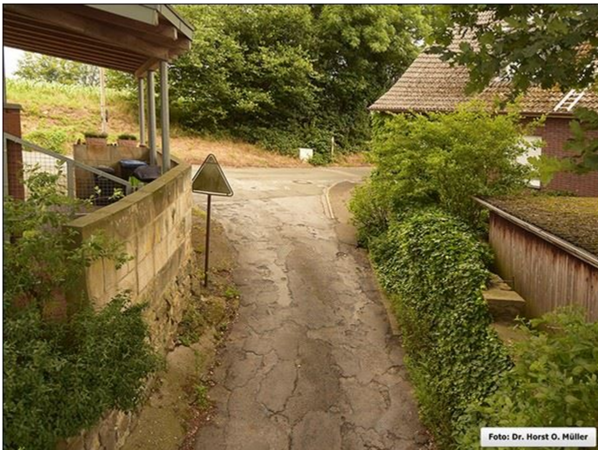
Einmündung der Stieneckerstiege in den Kathagen, Aufnahme aus erhöhter Position Stiegenkataster, erstellt von Jürgen Schevel - Nach Norden ablaufende Stiege - Seite 07