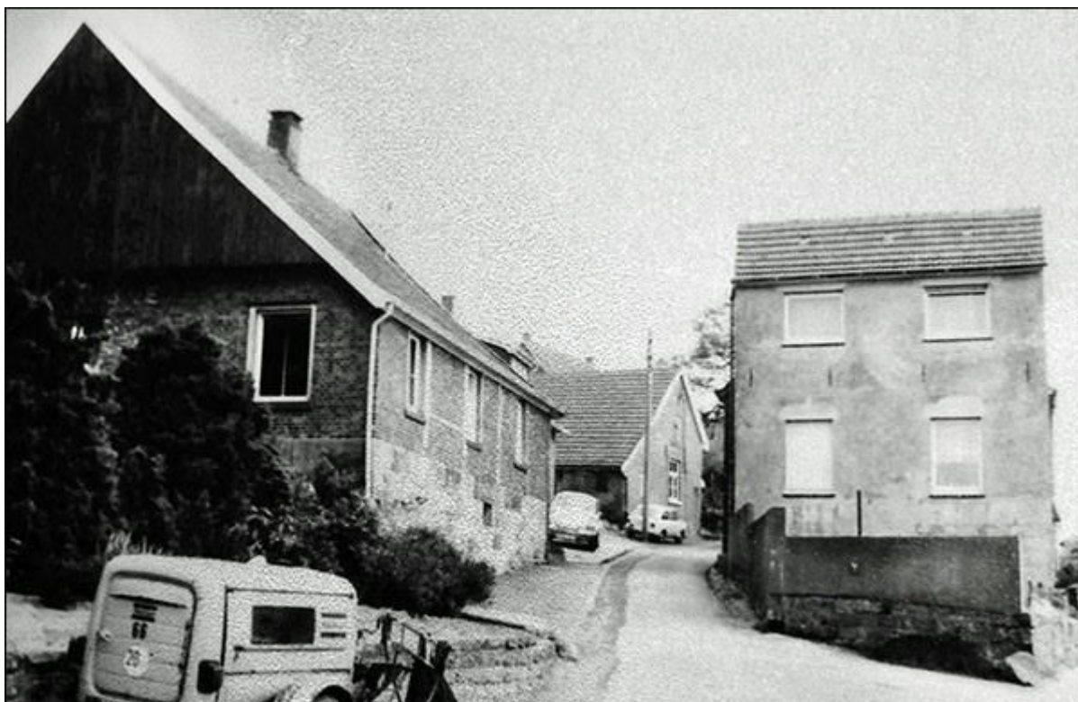
Blick in die Stieneckerstiege, nach Osten