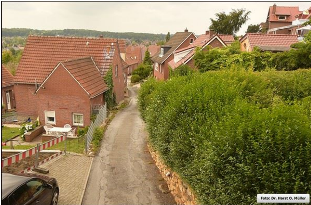
Stieneckerstiege, abwärts, Aufnahme aus erhöhter Position