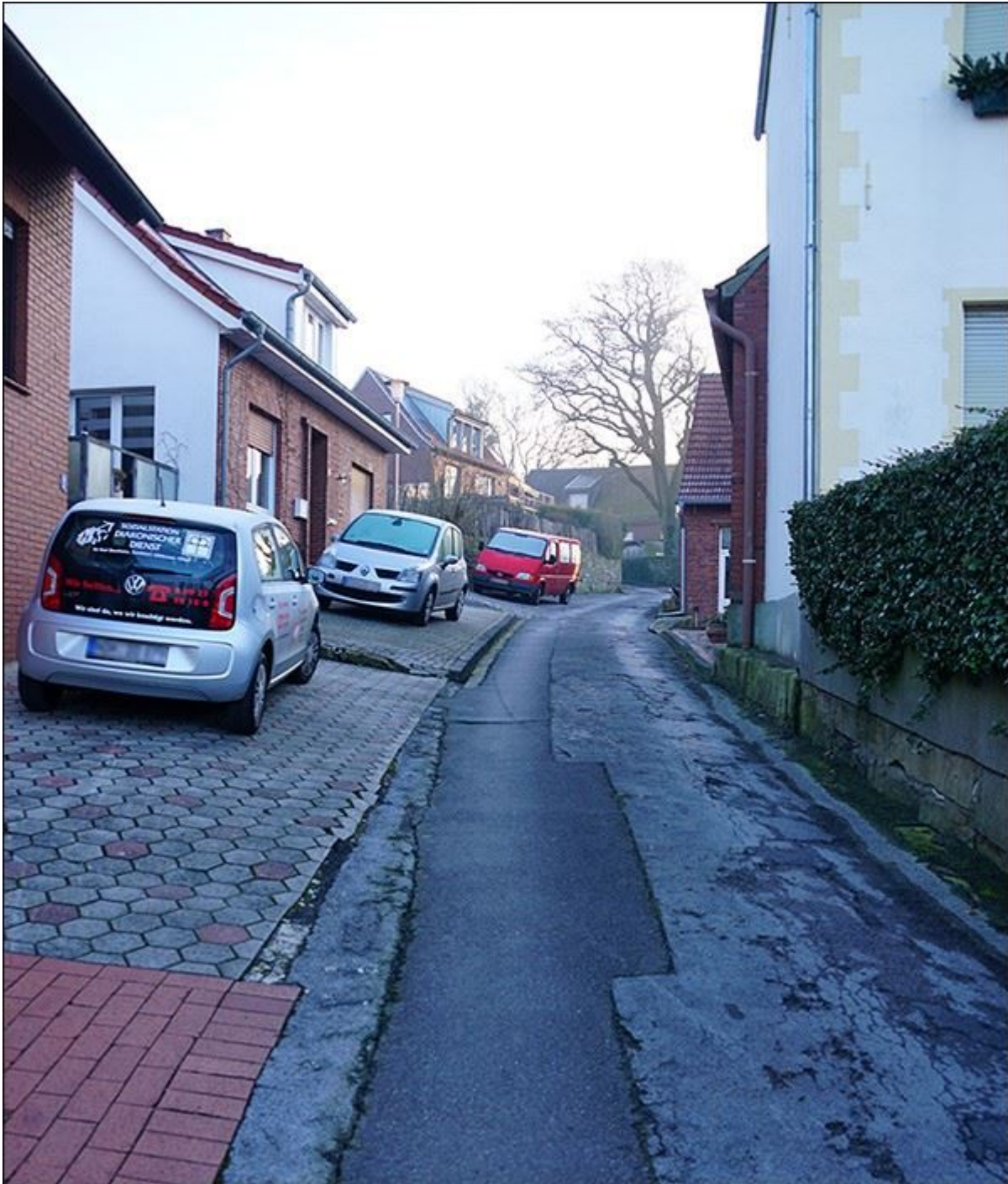
Blick in die Stieneckerstiege, nach Osten