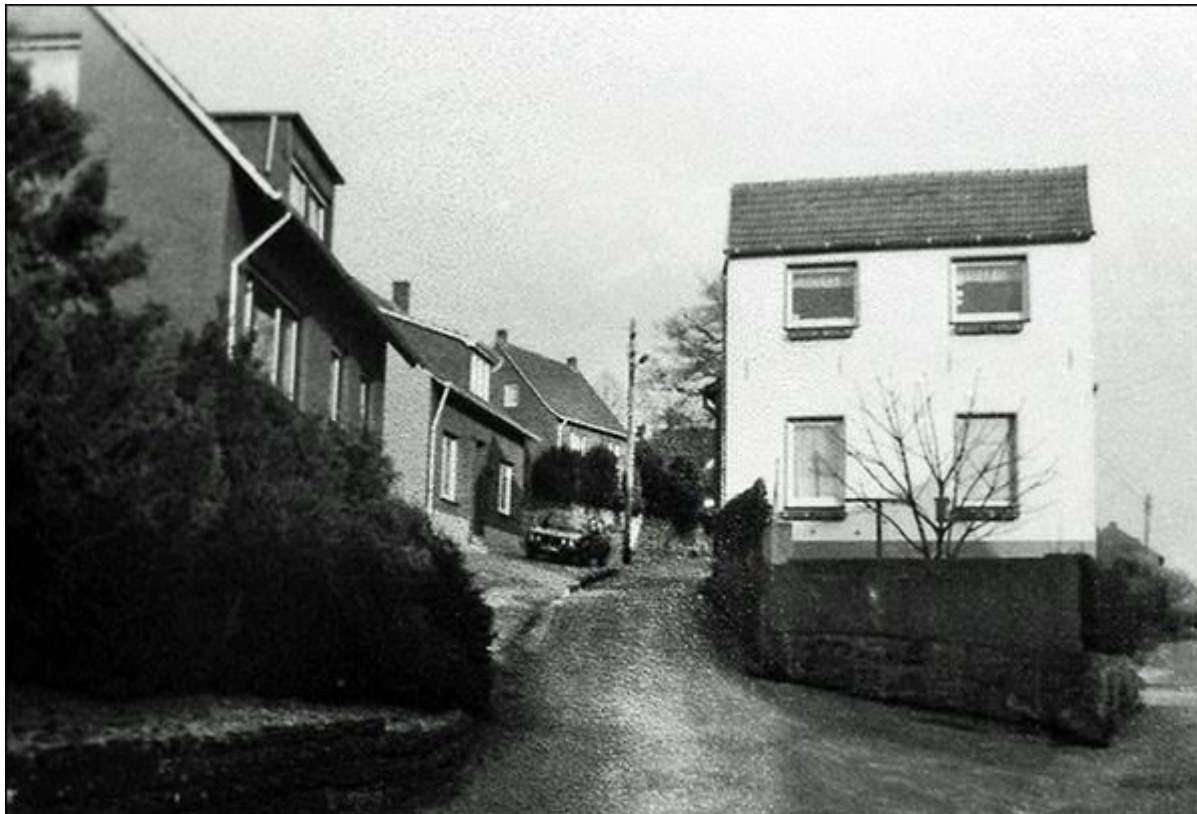
Blick in die Stieneckerstiege, nach Osten