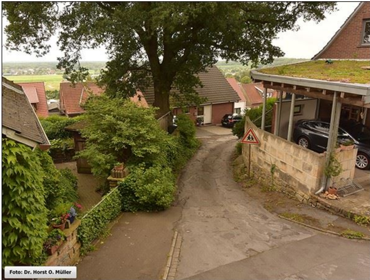
Obere Stieneckerstiege, vom Kathagen aus, Aufnahme aus erhöhter Position.

Stiegenfreunde Bad Bentheim (Hrsg.): Stiegenkataster Bad Bentheim. Erstellt von Jürgen Schevel, © 2022. www.stiegenbadbentheim.de