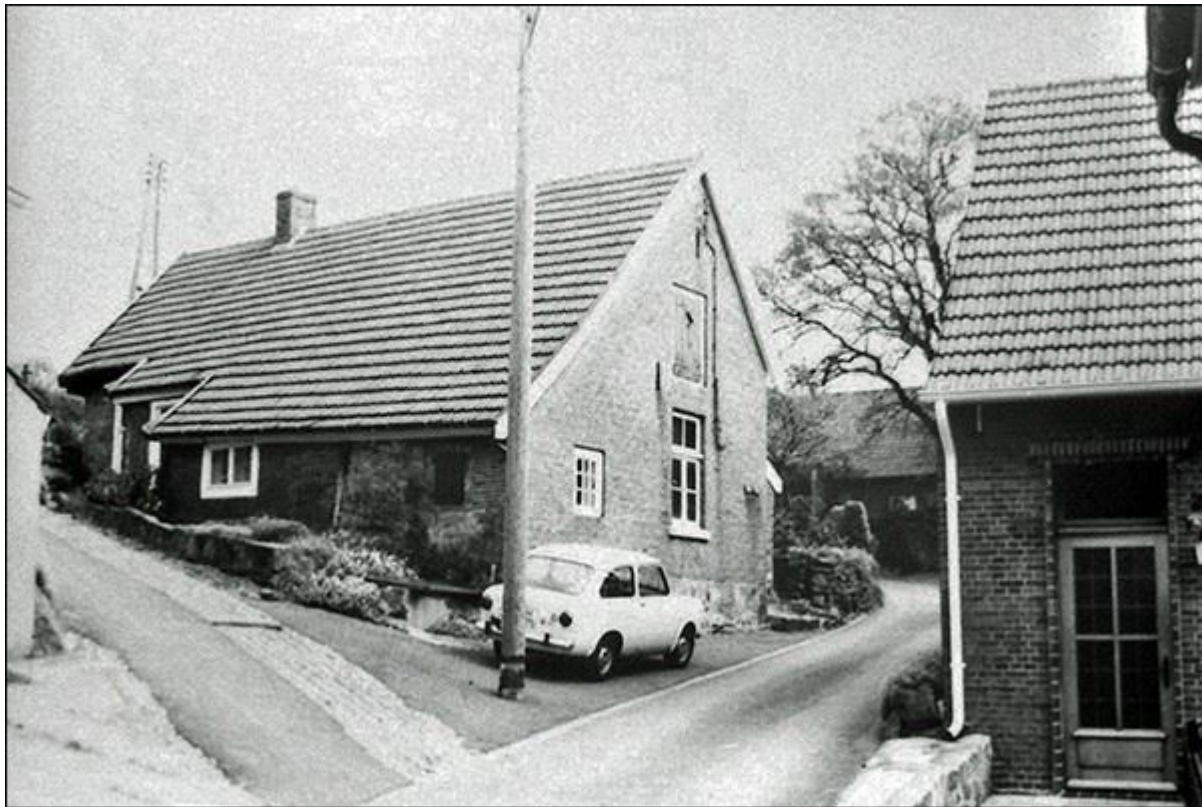
Blick in die Stieneckerstiege, nach Nordosten