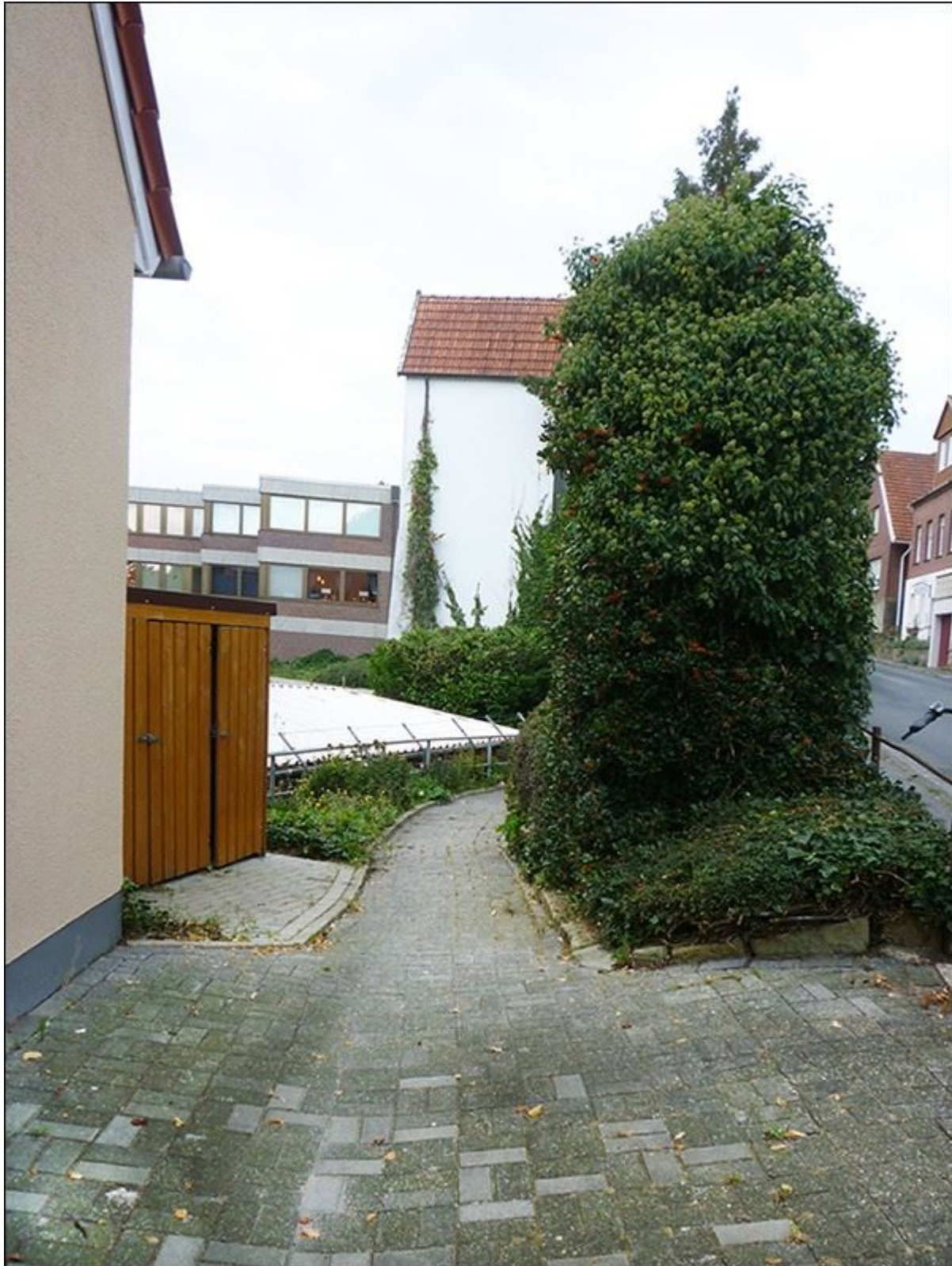
Püttenhoekstiege, Blick stadteinwärts