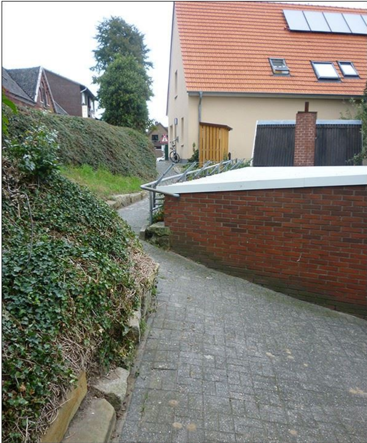
Püttenhoekstiege, Blick nach Osten