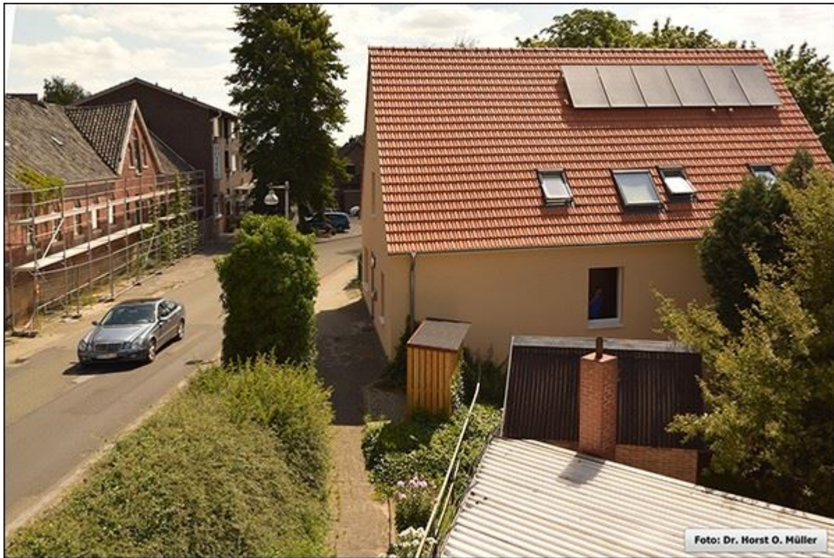
Püttenhoekstiege, Blick nach Osten, Aufnahme aus erhöhter Aufnahmeposition.