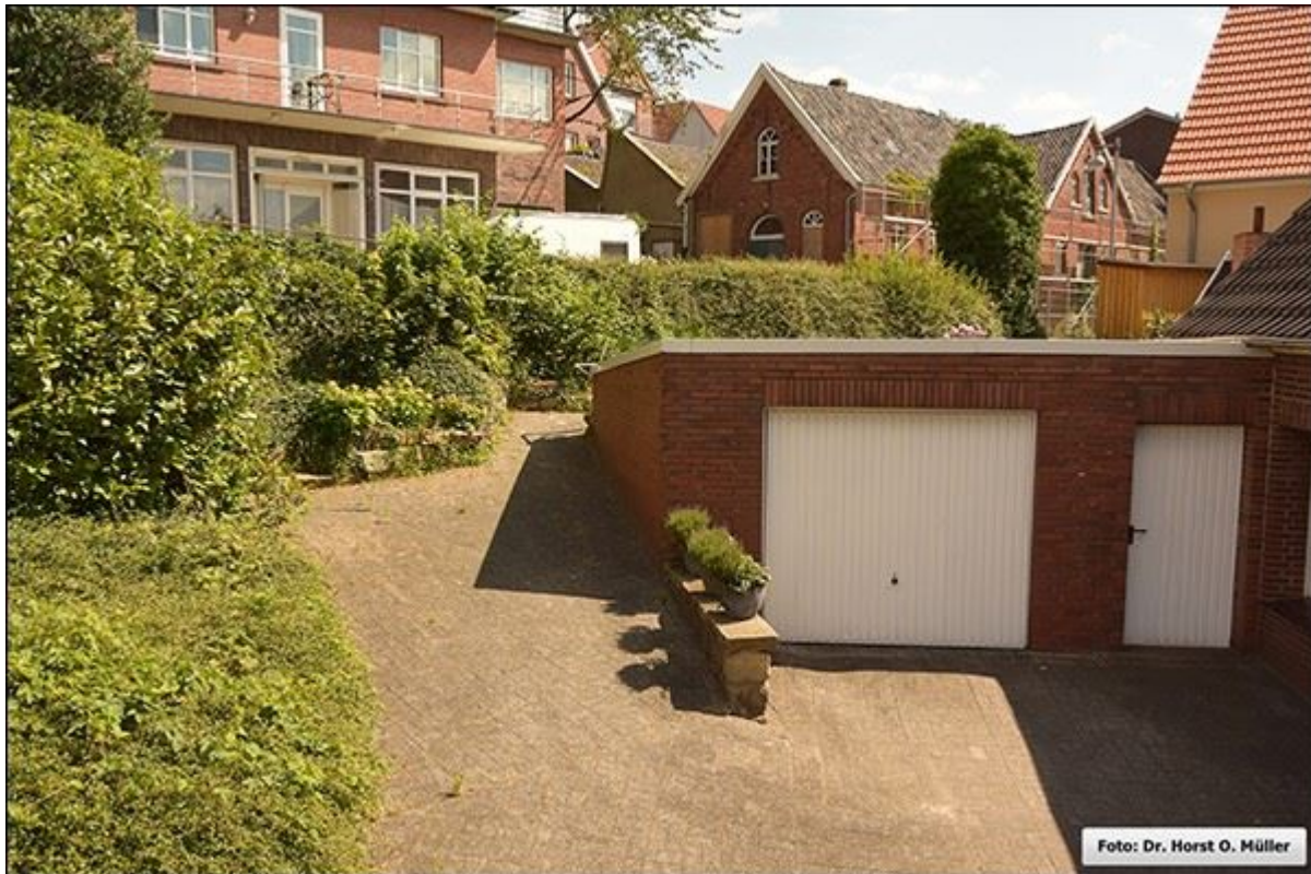
Püttenhoekstiege, Blick nach Nordosten