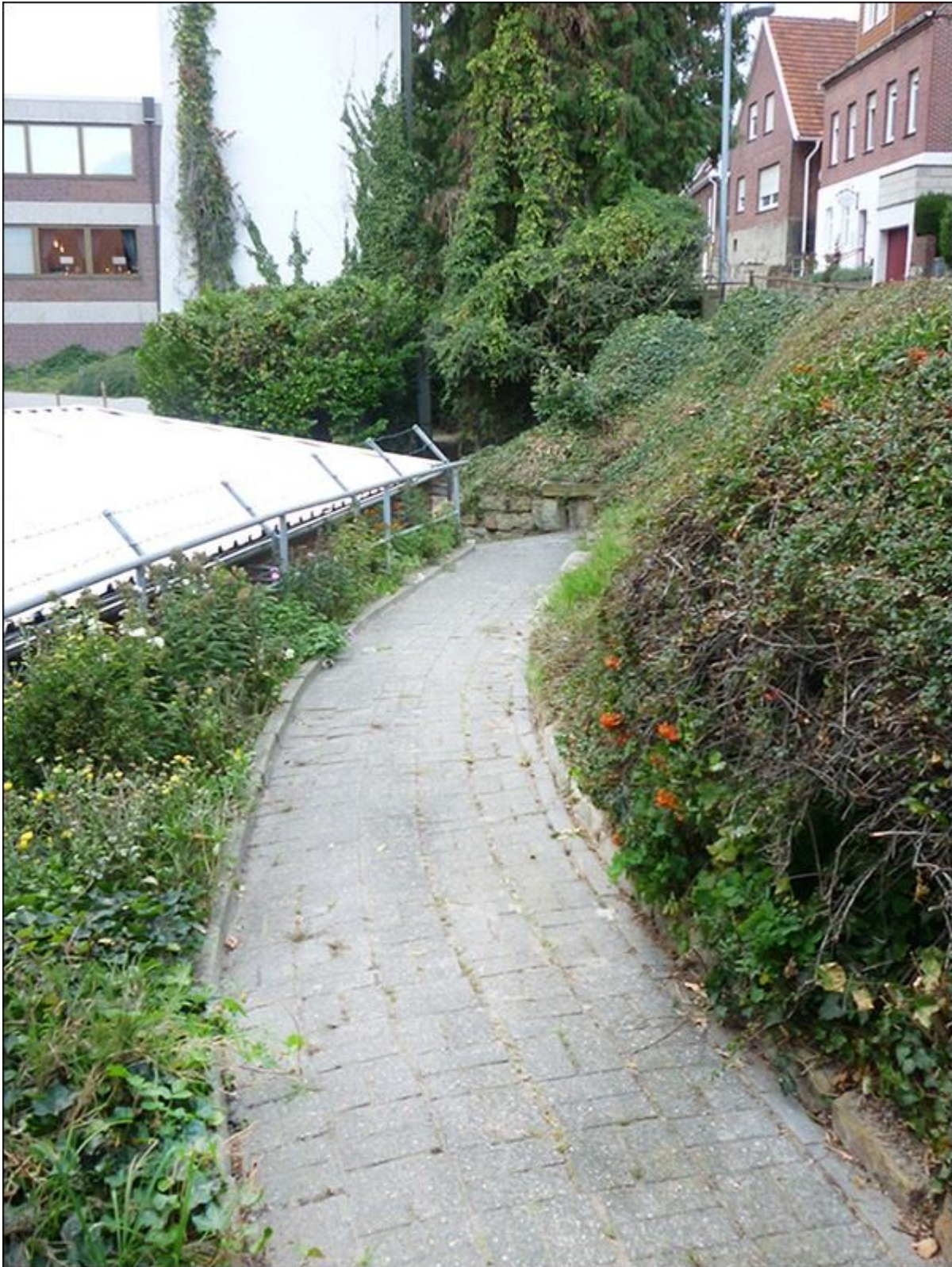
Püttenhoekstiege, Blick stadteinwärts