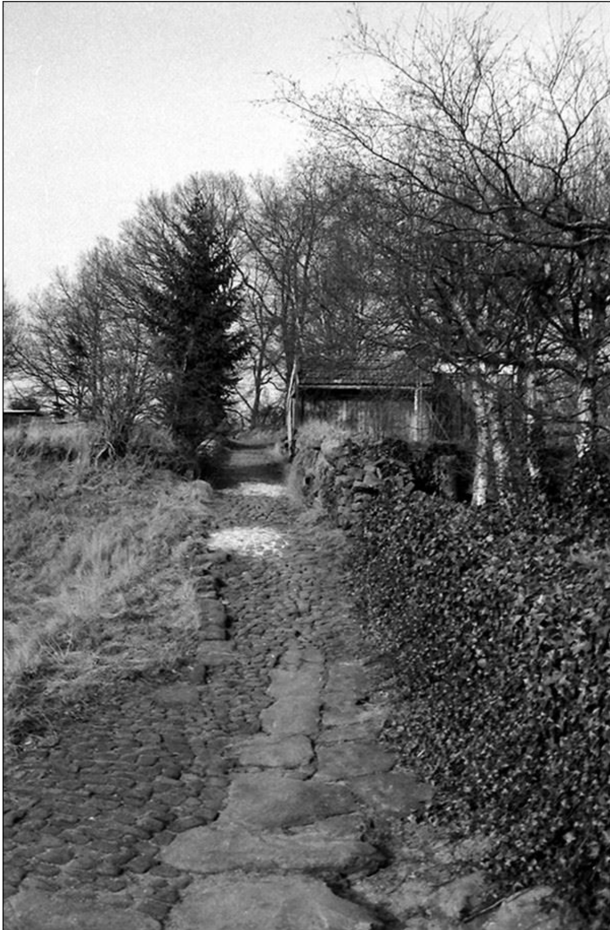
Blick nach Norden, in Richtung der heutigen Jugendherberge