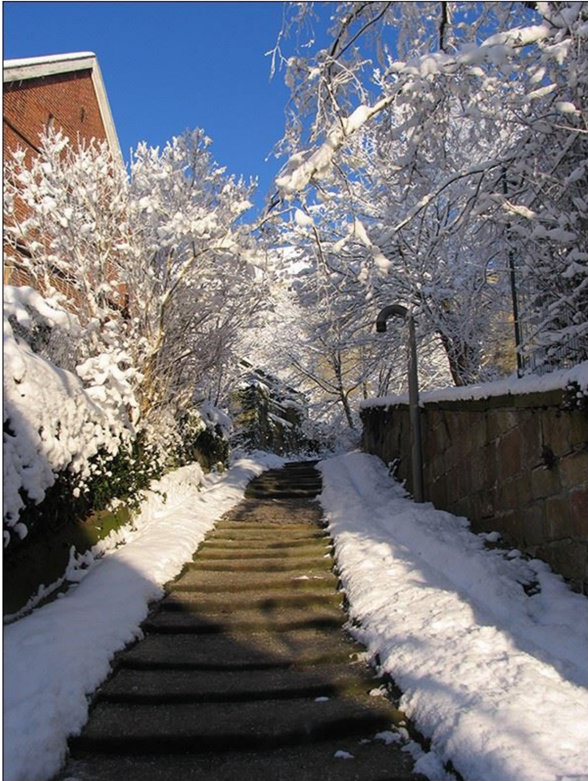
Winterlicher Blick nach Norden, die Mühlenstiege hinauf