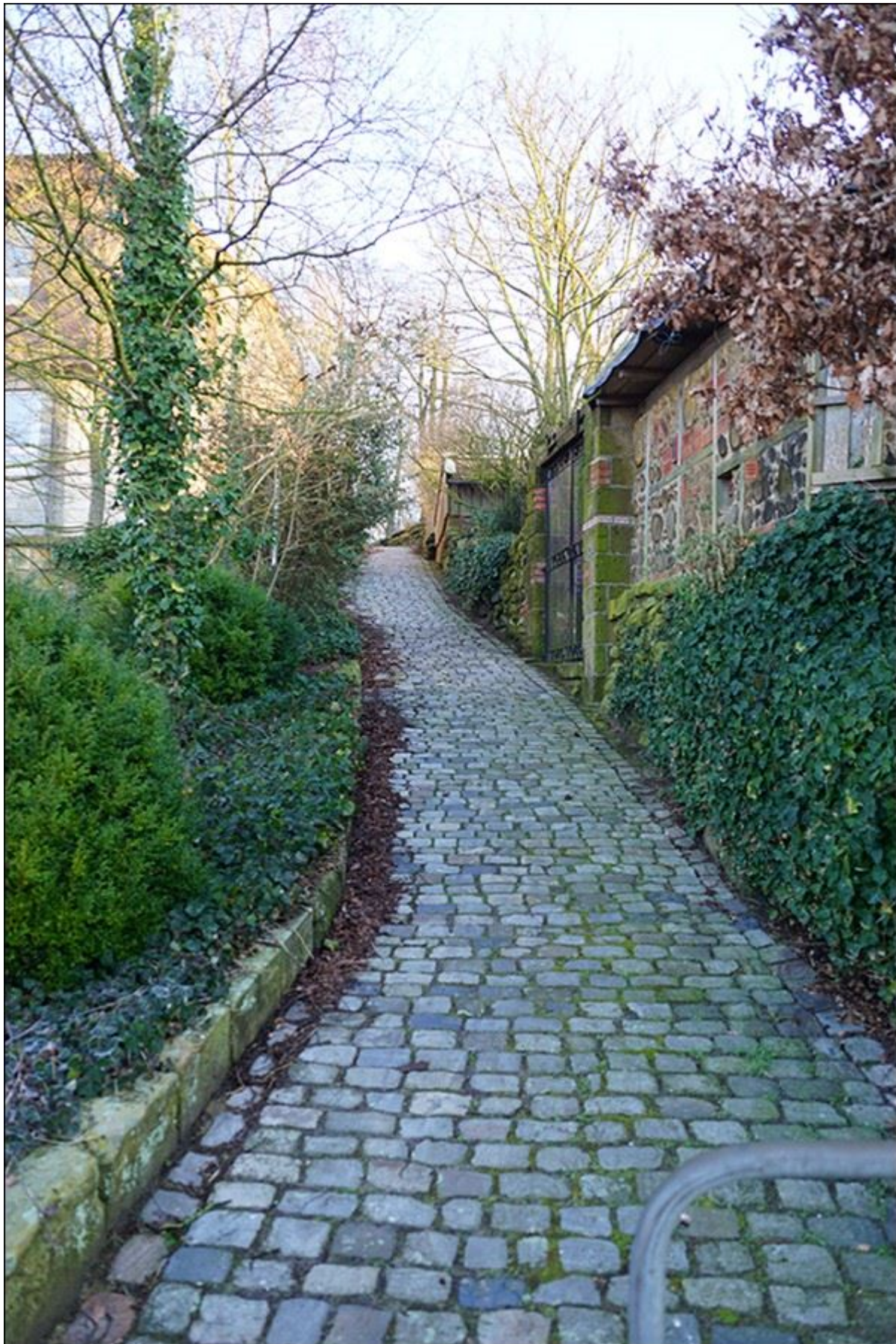
Mühlenstiege, Blick nach Norden