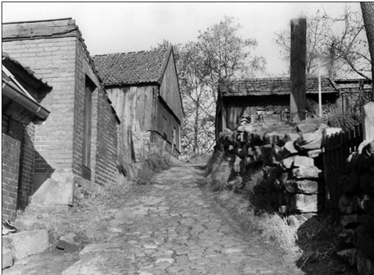
Oberer Abschnitt der Mühlenstiege, nach Norden