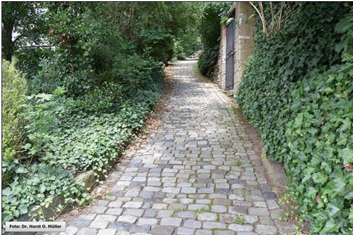
Mühlenstiege, Blick nach Norden

Stiegenfreunde Bad Bentheim (Hrsg.): Stiegenkataster Bad Bentheim. Erstellt von Jürgen Schevel, © 2022. www.stiegenbadbentheim.de