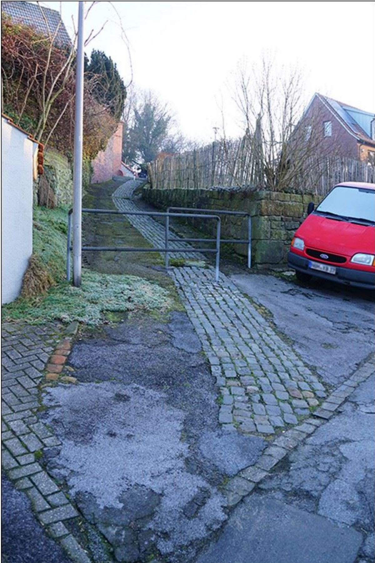
Hunschestiege, Blick nach Norden