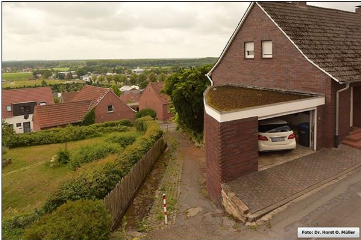
Hunschestiege, Blick nach Süden aus erhöhter Aufnahmeposition, 2020

Stiegenfreunde Bad Bentheim (Hrsg.): Stiegenkataster Bad Bentheim. Erstellt von Jürgen Schevel, © 2022. www.stiegenbadbentheim.de