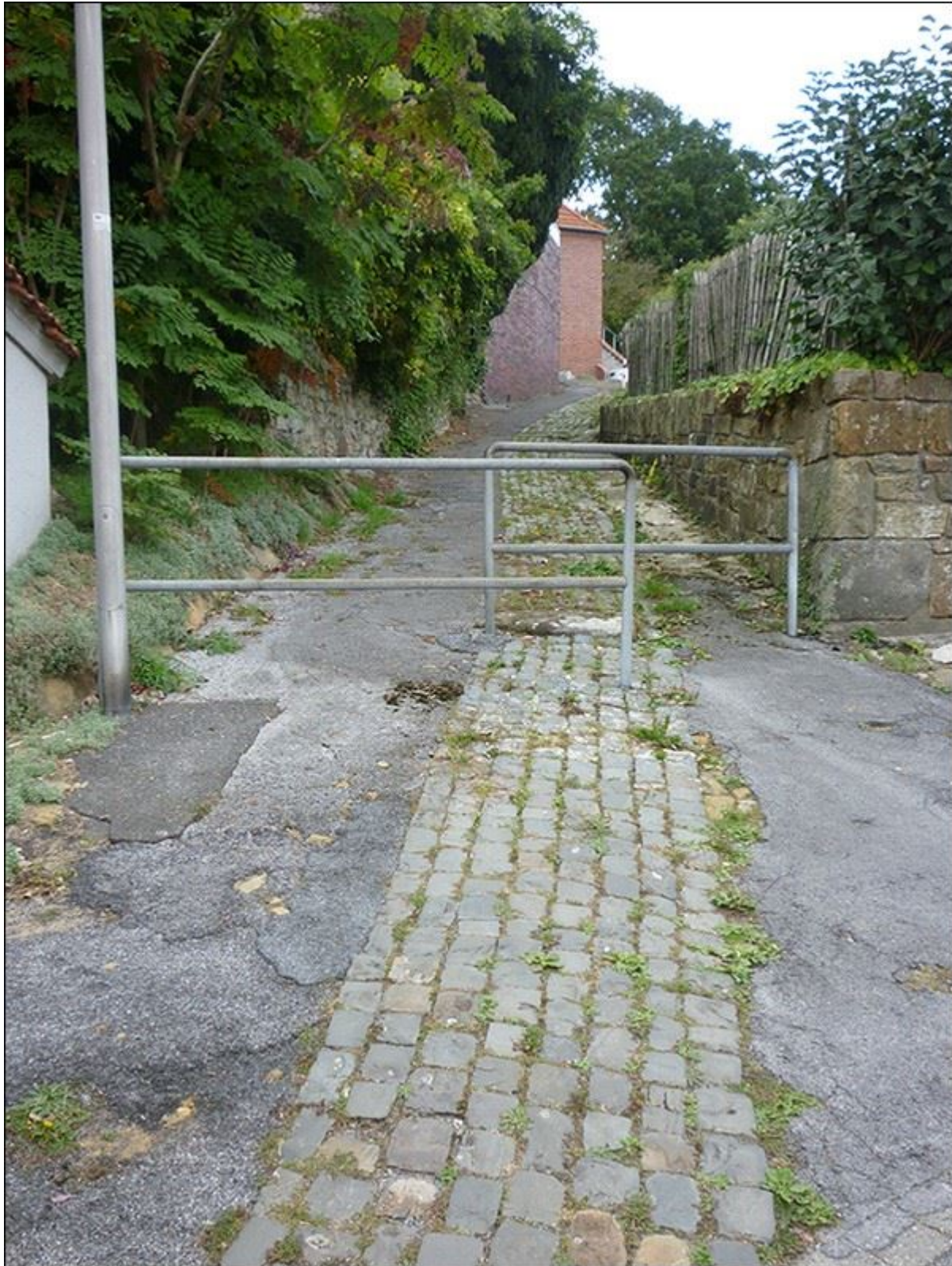
Hunschestiege, Blick nach Norden, Barrieren