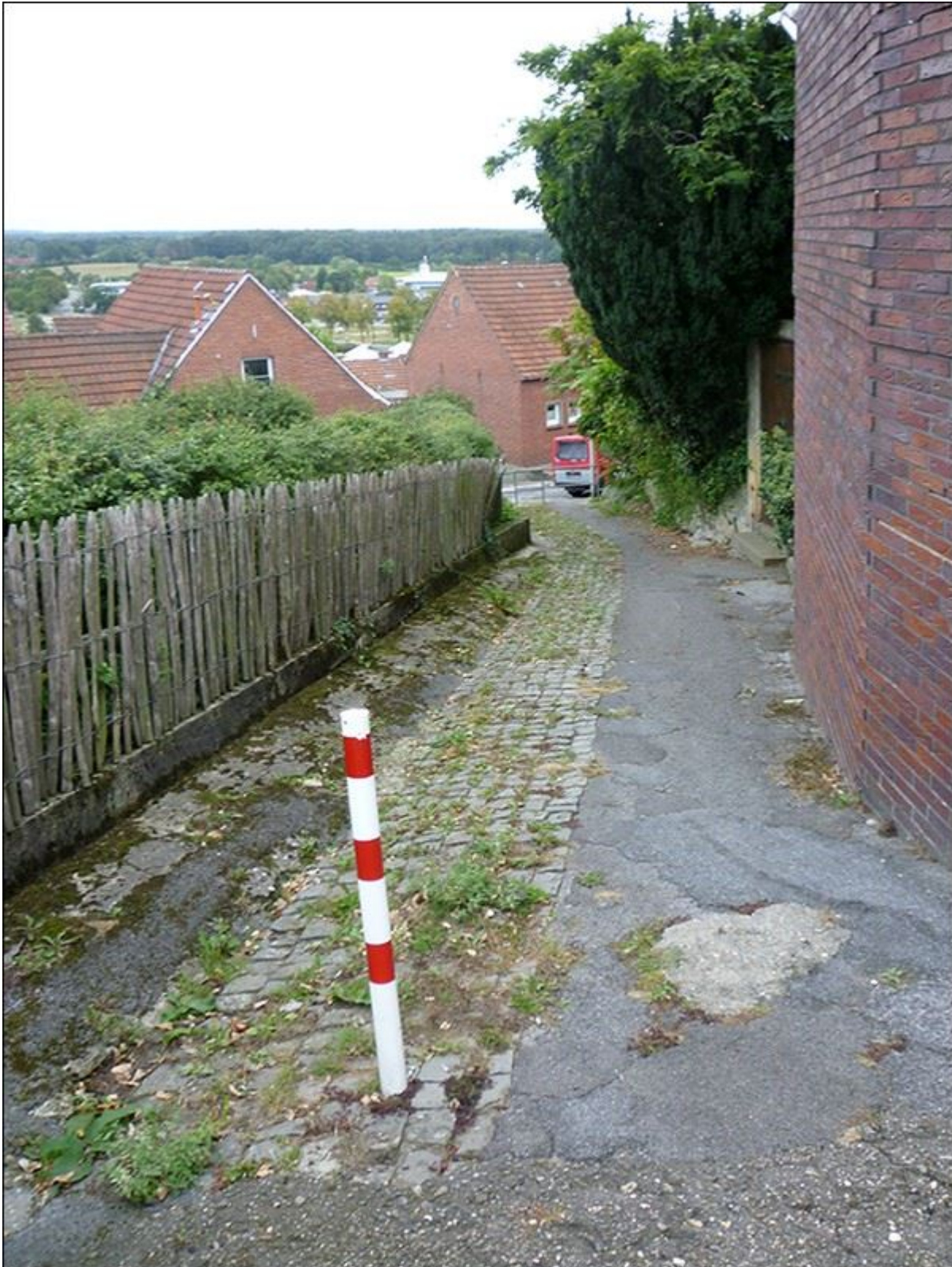
Hunschestiege, Blick nach Süden, mit oberer Barriere