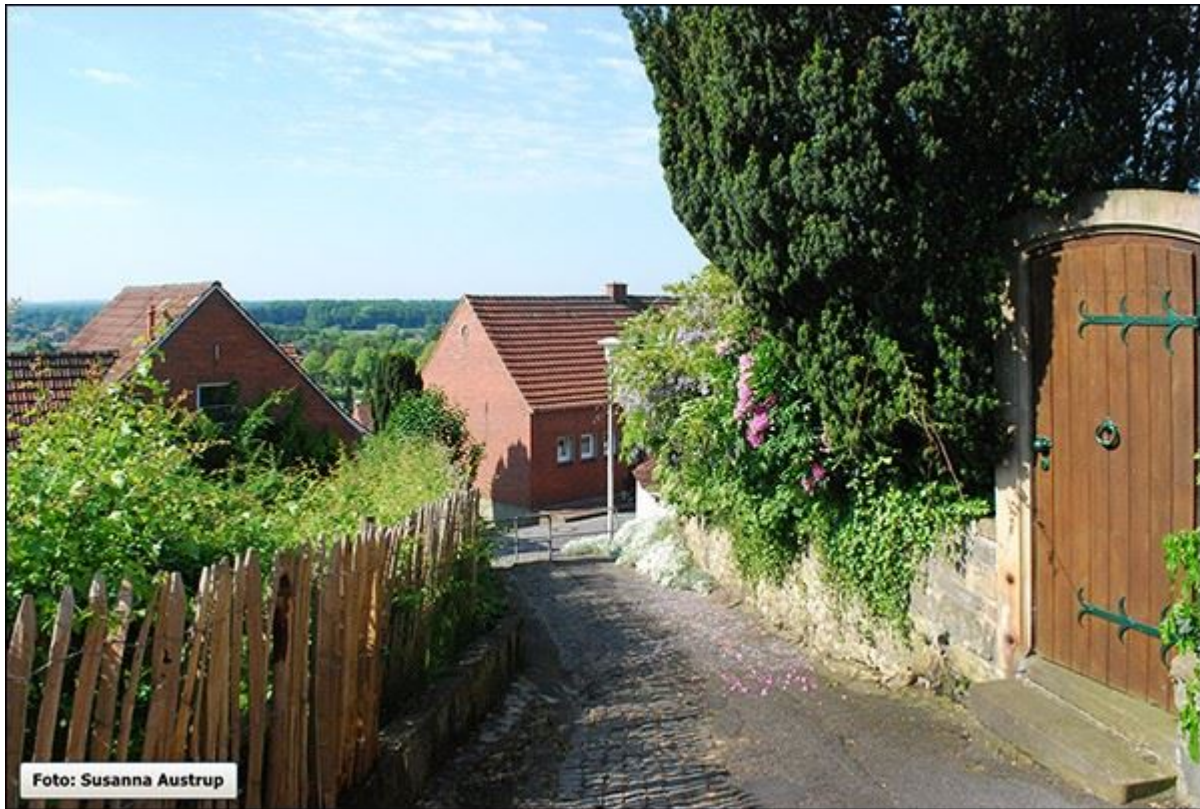
Hunschestiege, Blick nach Norden, Barrieren