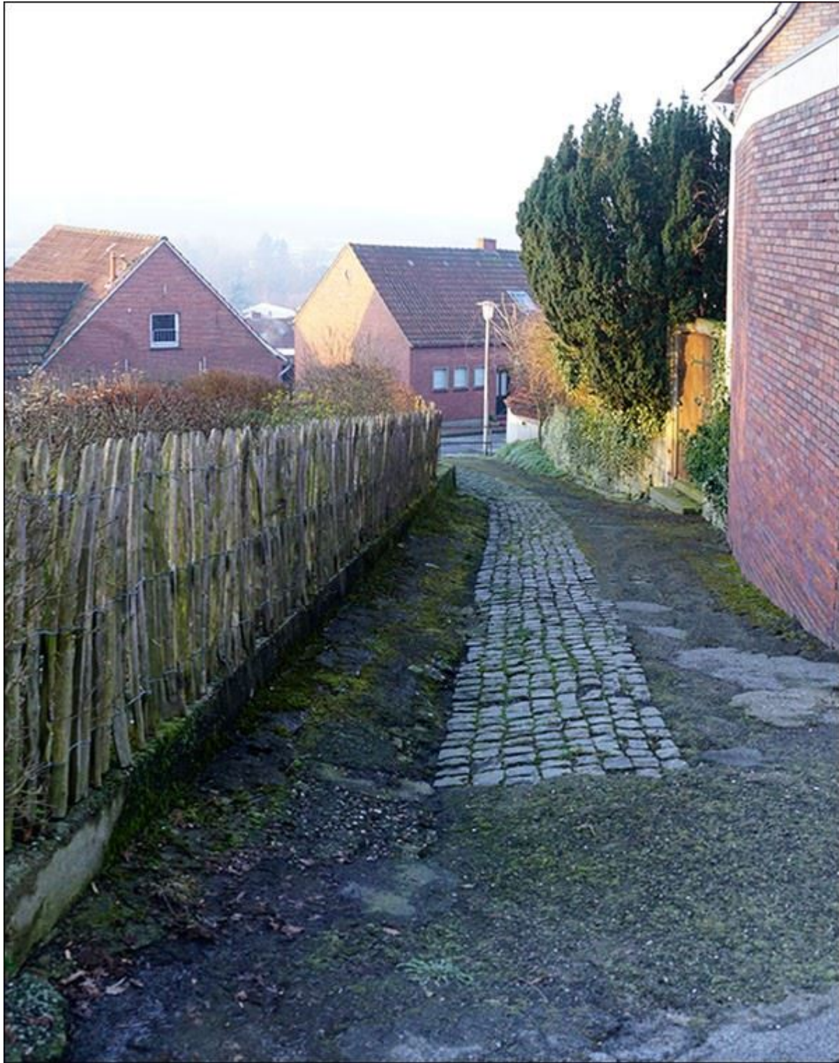
Hunschestiege, Blick nach Süden, zur Zeit der Aufnahme noch barrierefrei