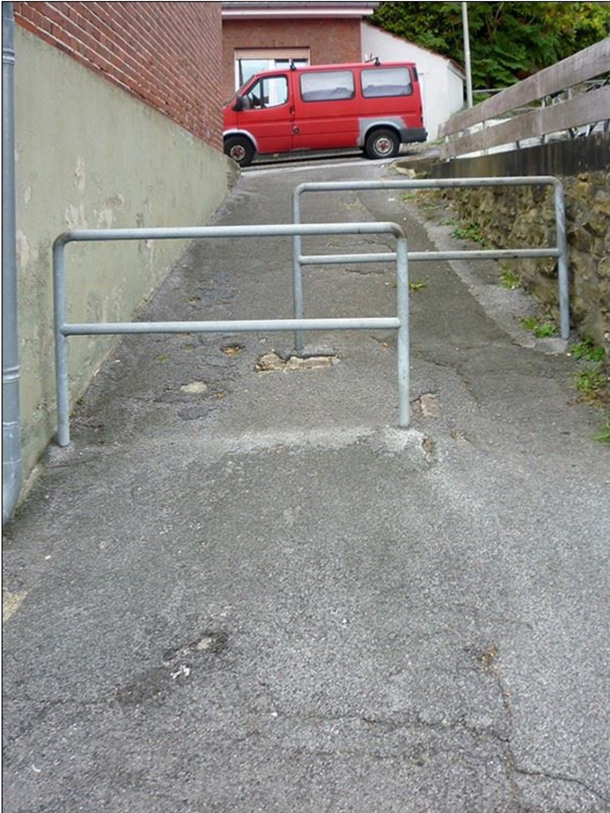
Blick von Süden in die Sackbrookstiege