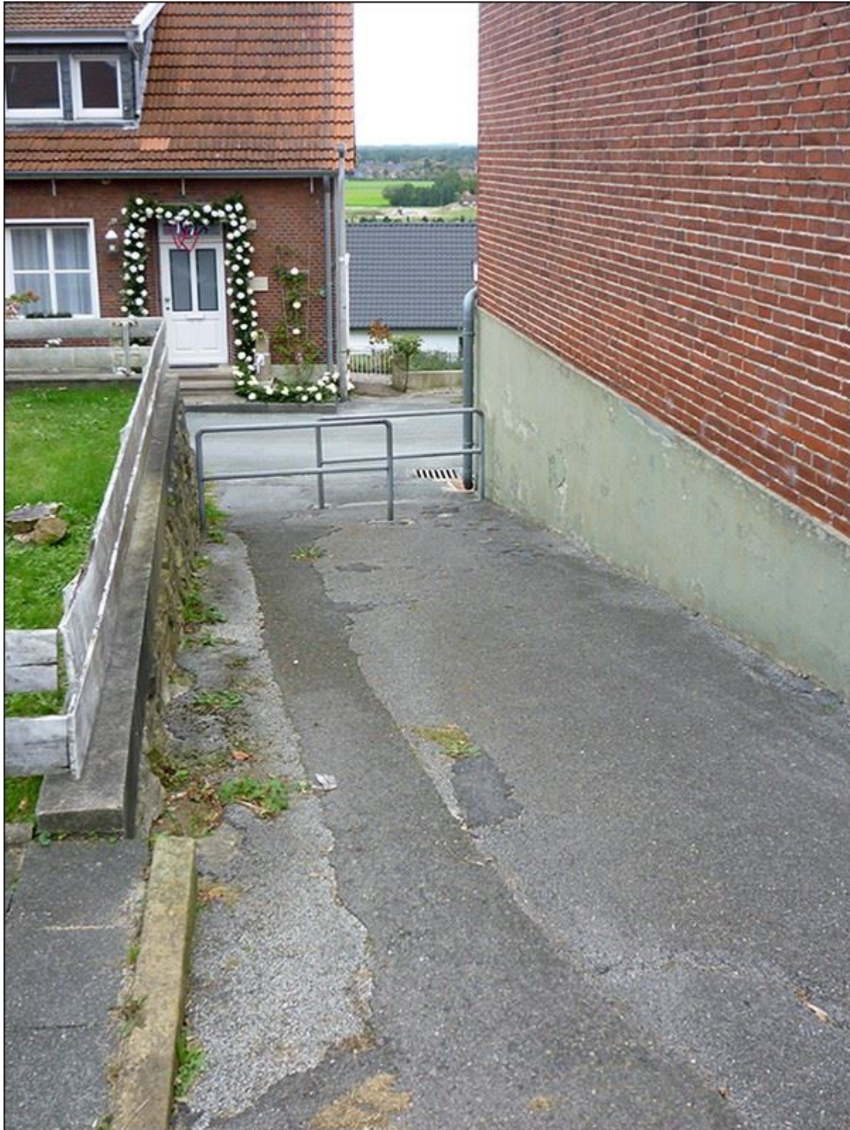
Sackbrookstiege nach Süden