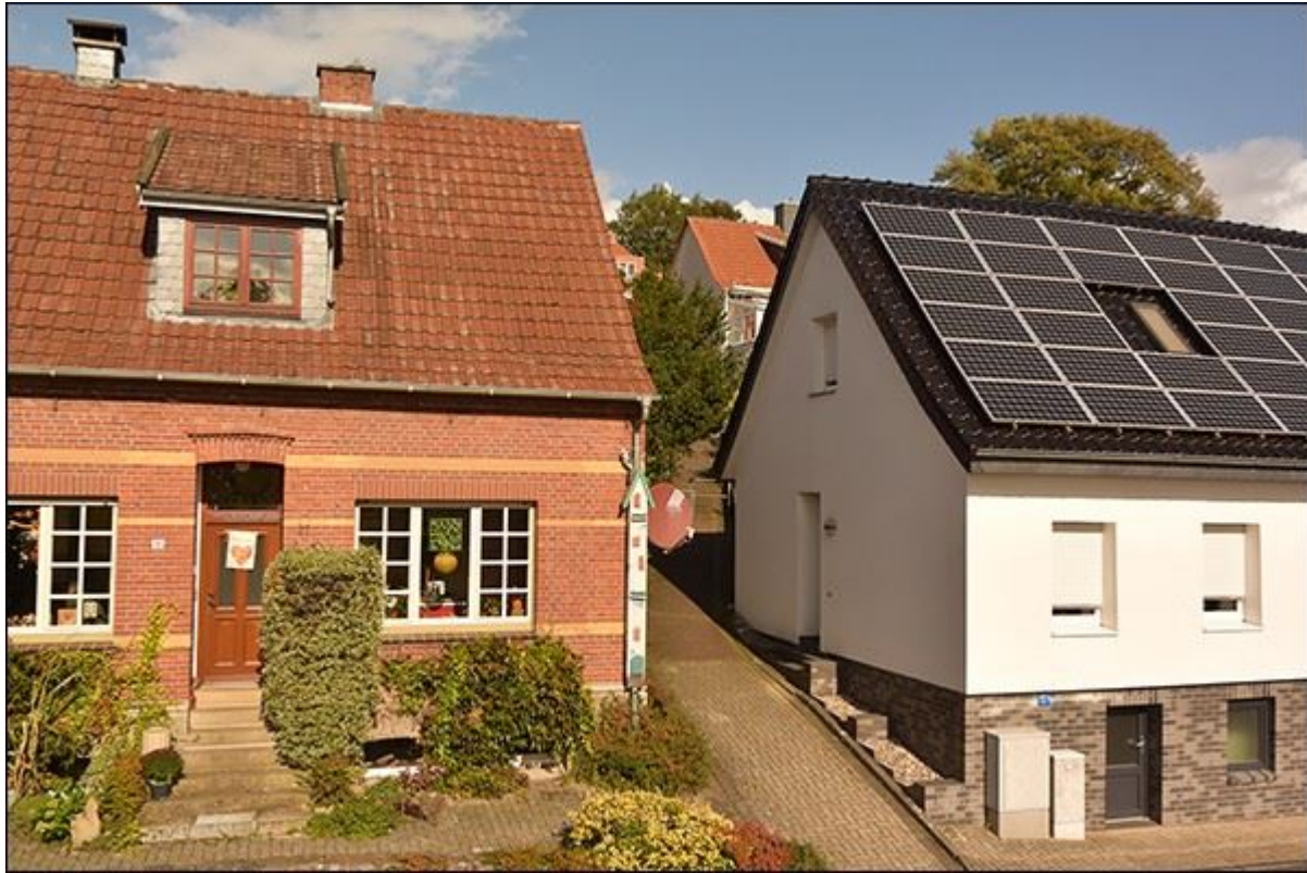
Einstieg in die Kuhrstiege von der Löwenstraße aus