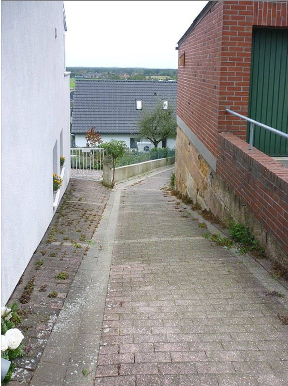
Oberes Ende der Kuhrstiege, Blick nach Süden

Stiegenfreunde Bad Bentheim (Hrsg.): Stiegenkataster Bad Bentheim. Erstellt von Jürgen Schevel, © 2022. www.stiegenbadbentheim.de