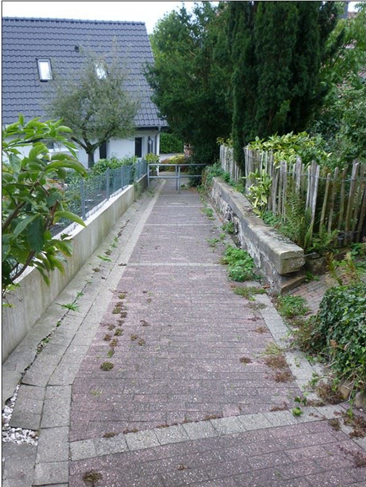
Mittlerer Abschnitt der Kuhrstiege, Blick nach Süden