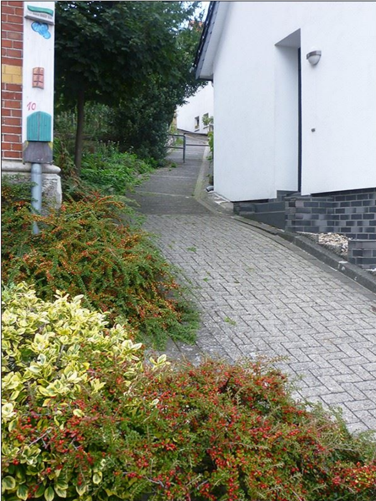
Kuhrstiege, Blick nach Norden