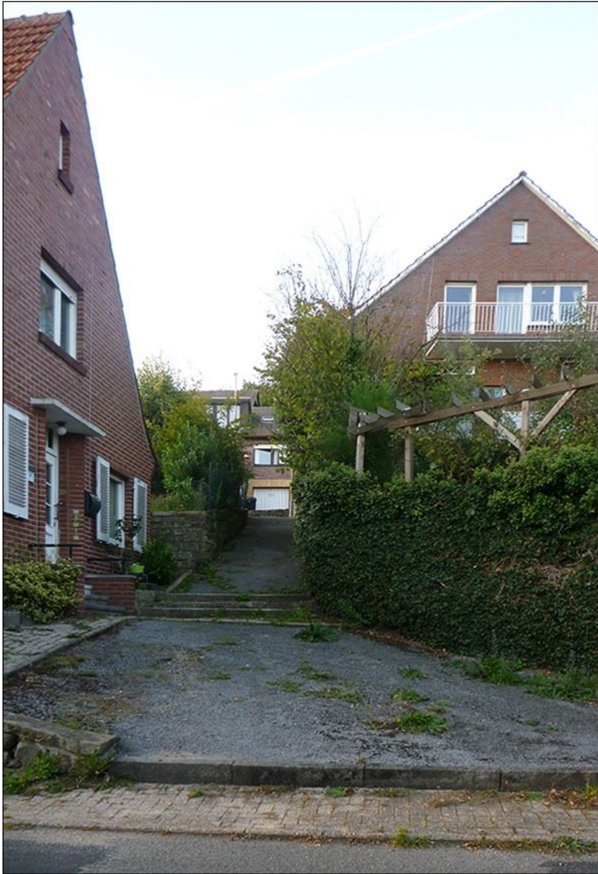
Obere Flossstege, Blick nach Norden