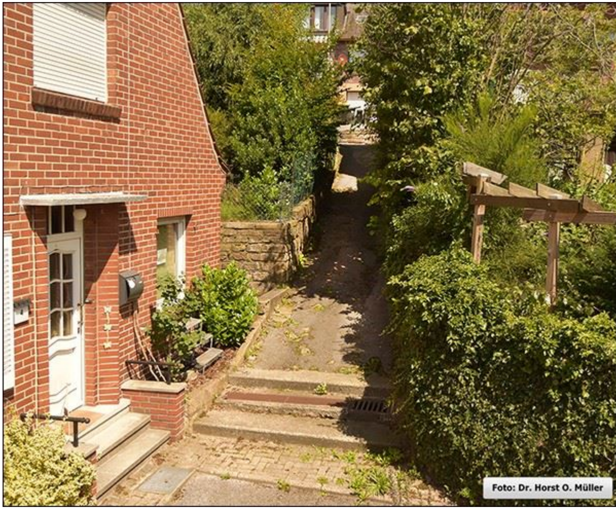
Obere Flossstege, Blick nach Norden, Aufnahme aus erhöhter Position