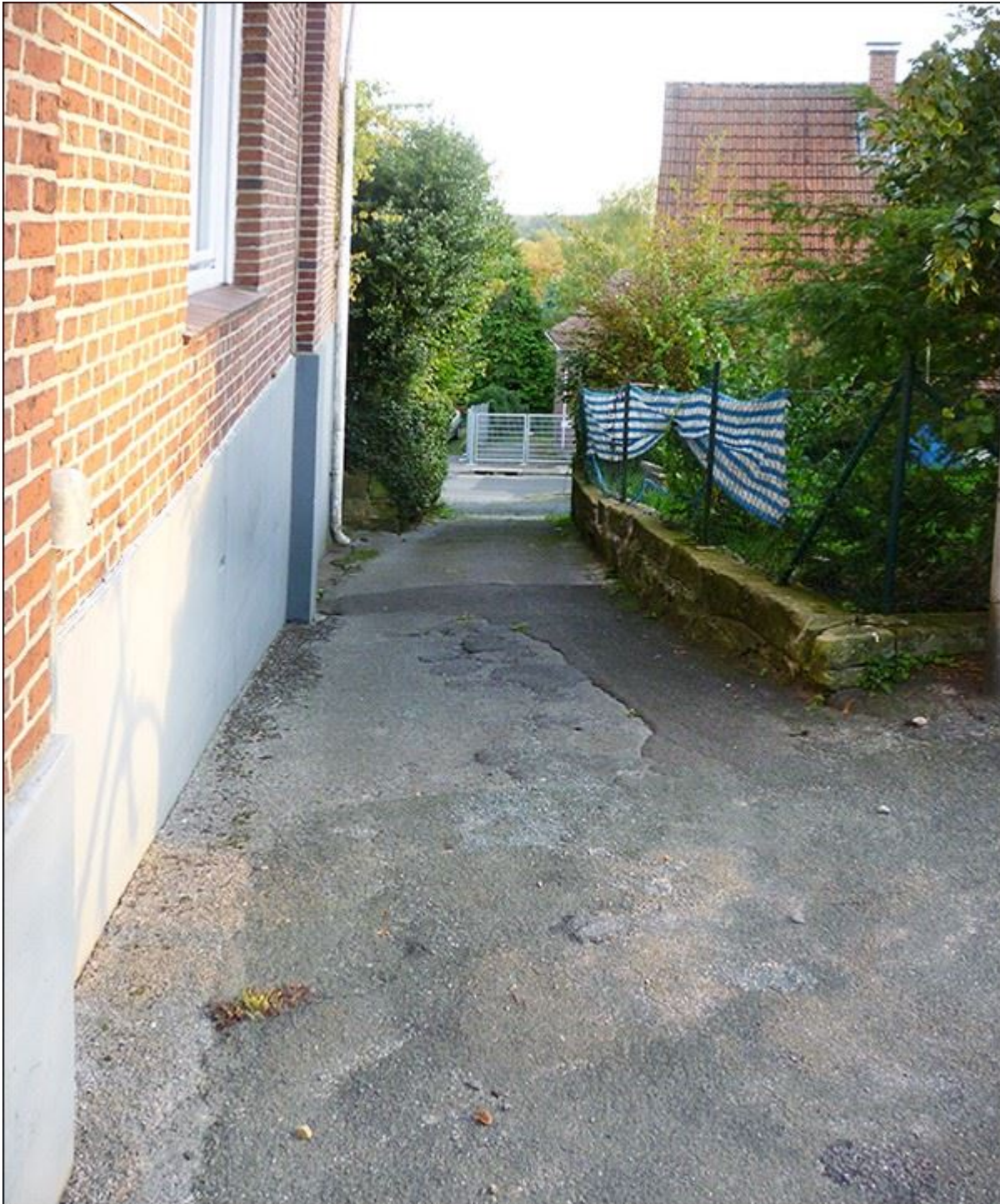
Obere Flossstege, Blick nach Süden. Im Bildhintergrund das Gitter der nicht mehr öffentlich zugänglichen Flossstege