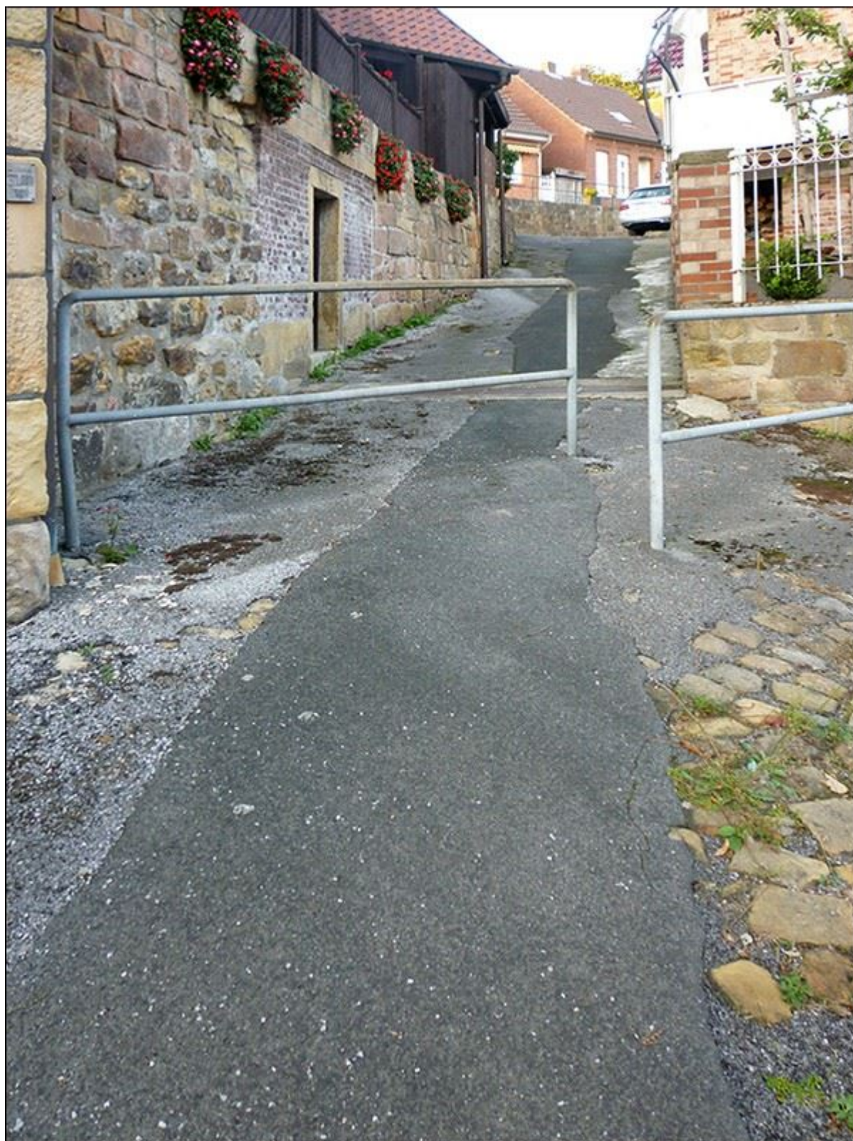
Blick die Schepersstiege hinauf, nach Nordosten