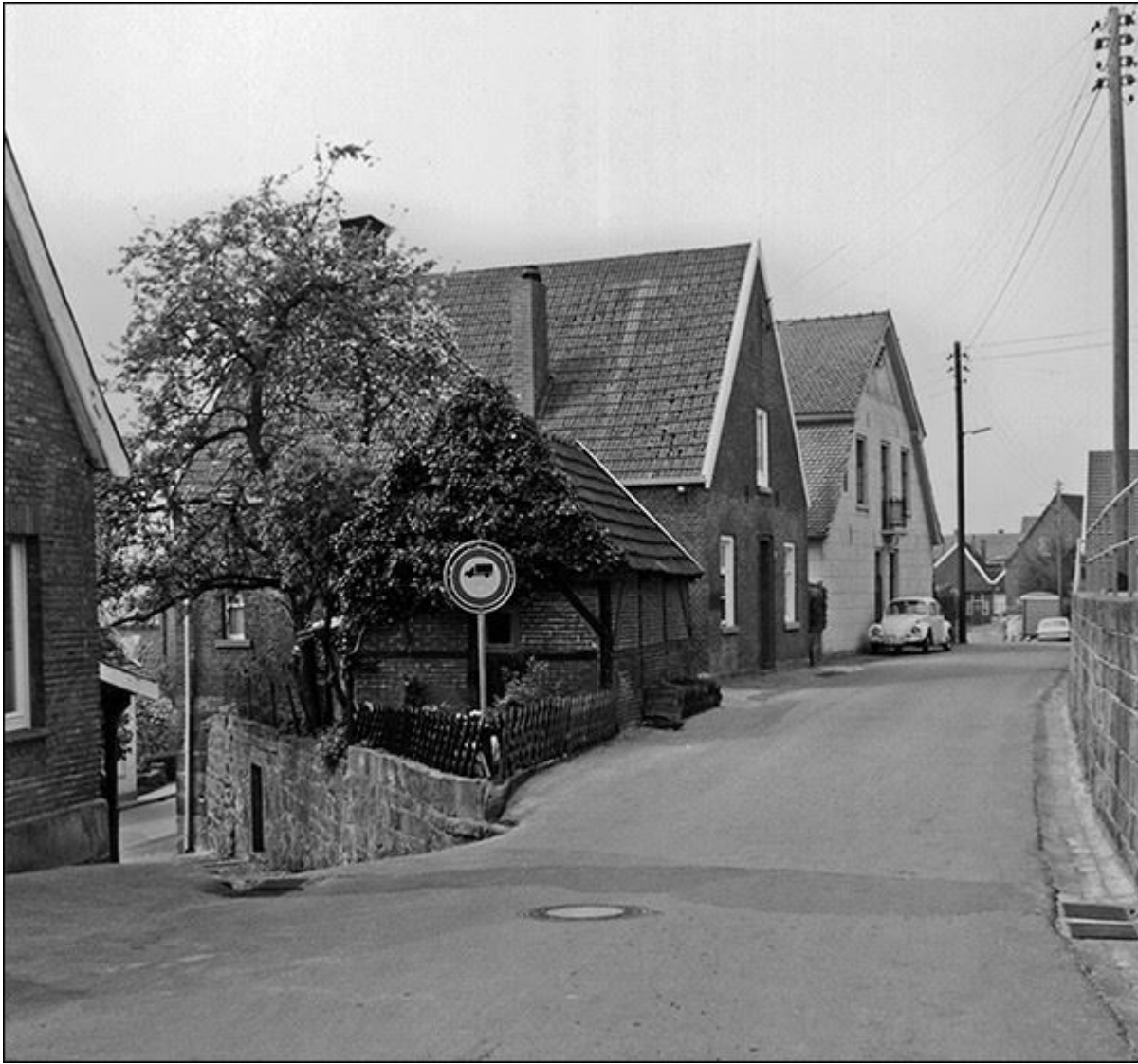
Blick durch die Scheperstiege nach Südwesten, ältere Aufnahme (damals noch mit einer Durchfahrterlaubnis für PKWs)