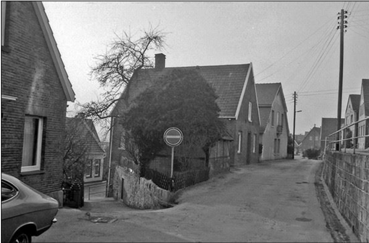
Blick durch die Scheperstiege nach Südwesten (jüngere Aufnahme: generelles Durchfahrtsverbot)