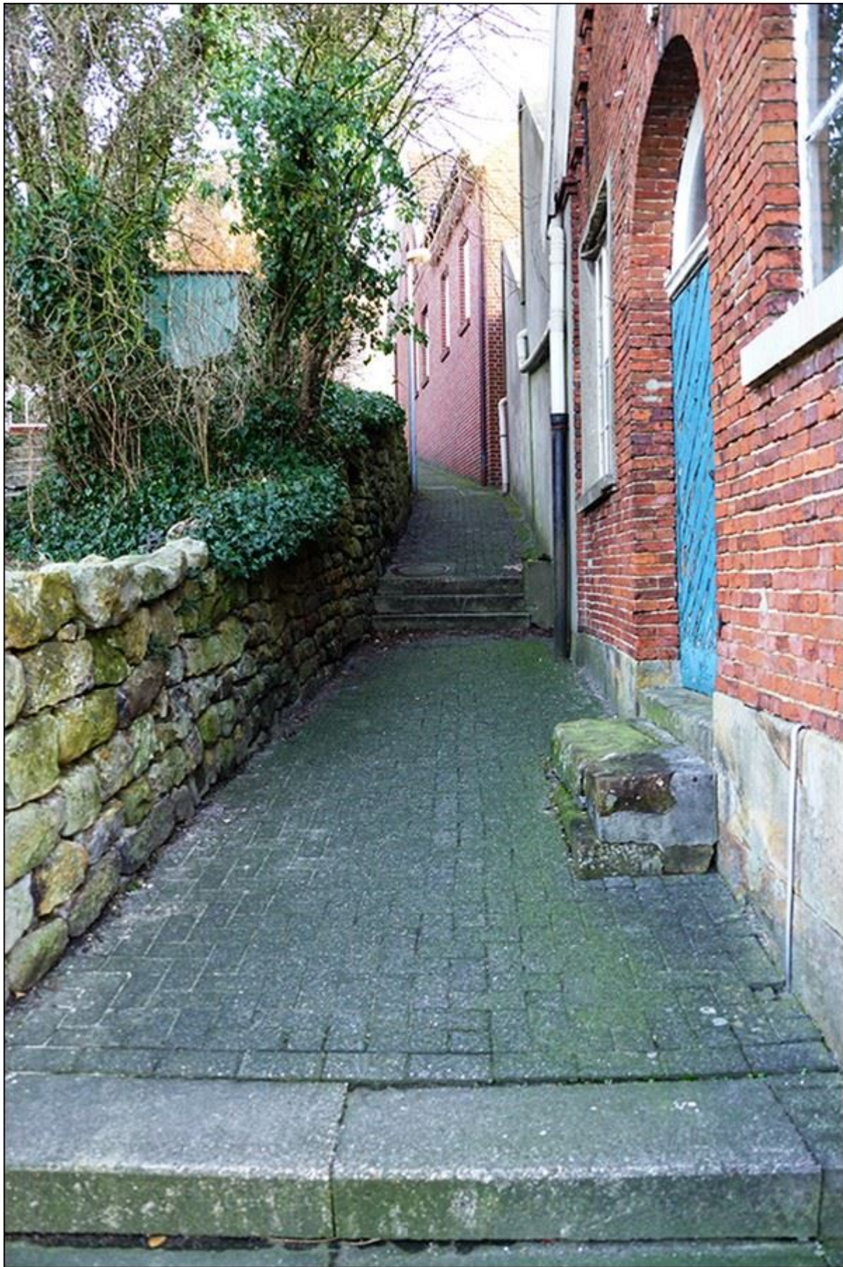
Stiegenverlauf, Blick nach Norden