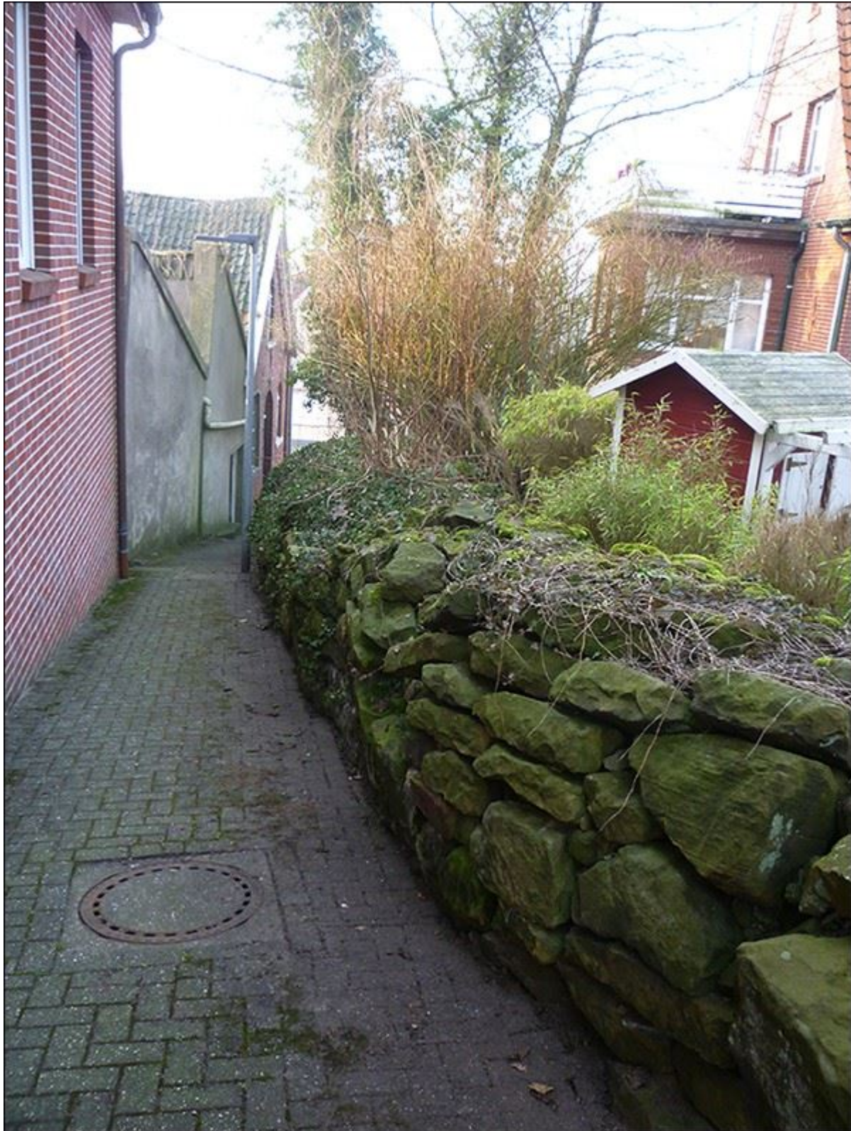
Stiegenverlauf, Blick nach Süden

Stiegenfreunde Bad Bentheim (Hrsg.): Stiegenkataster Bad Bentheim. Erstellt von Jürgen Schevel, © 2022. www.stiegenbadbentheim.de