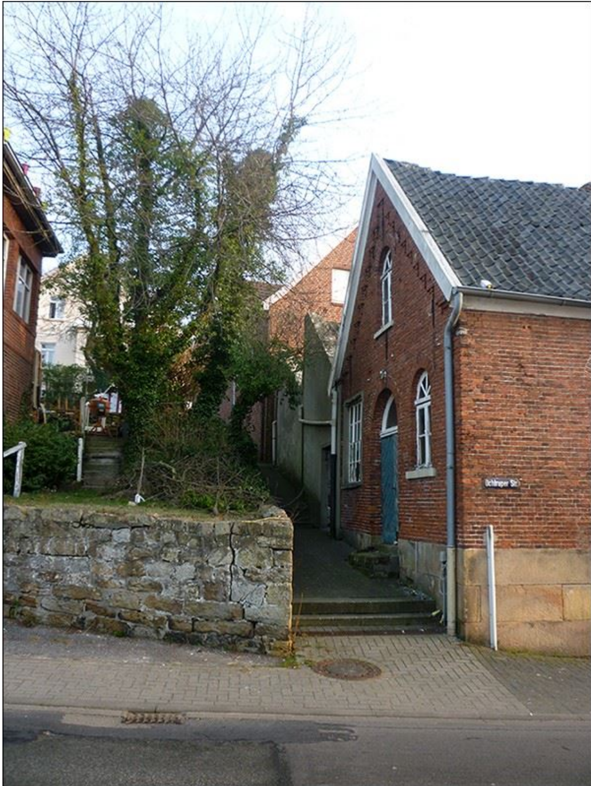
Stiegenverlauf, Blick nach Norden