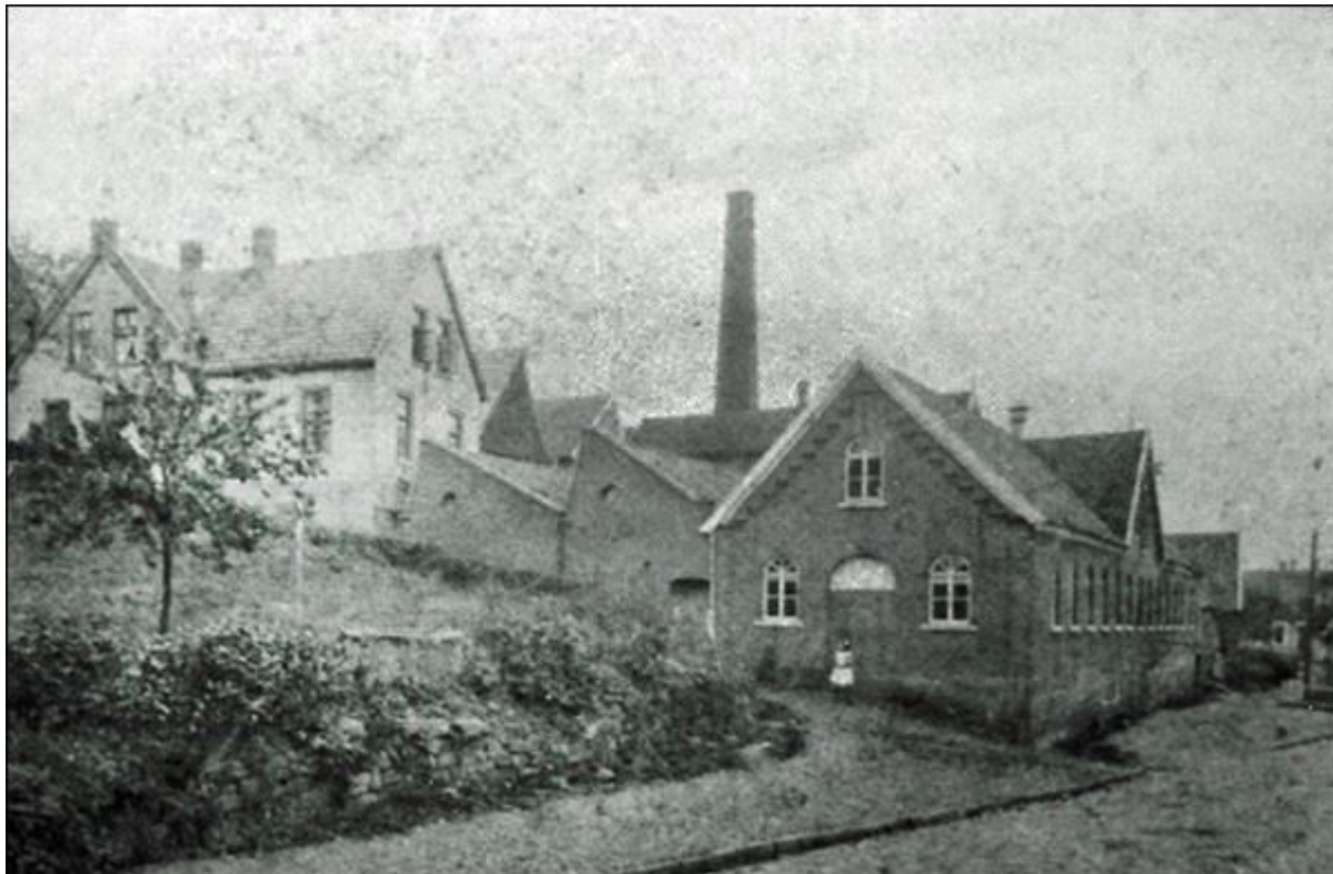
Ochtruper Straße, Blick nach Nordosten