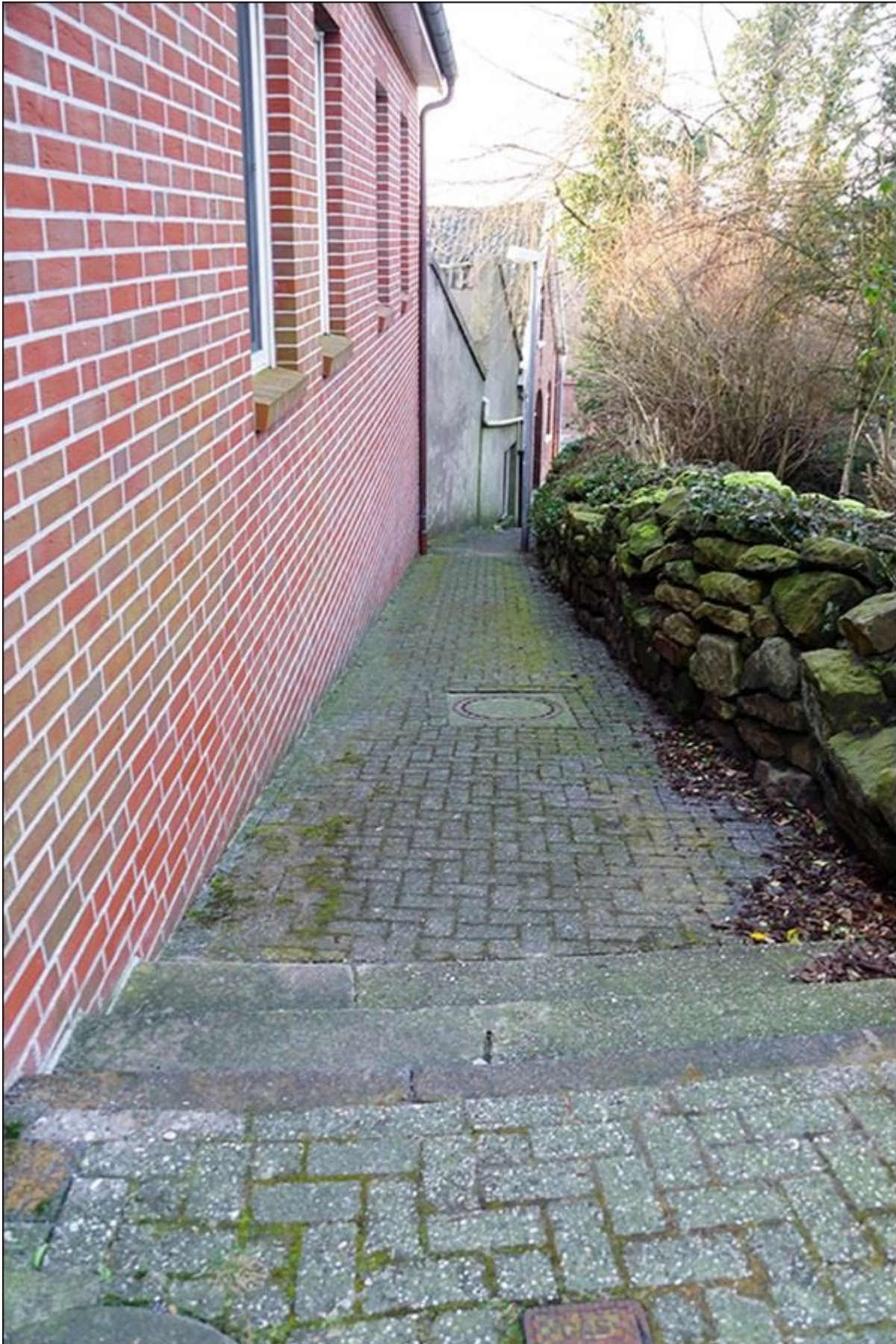
Stiegenverlauf, Blick nach Süden