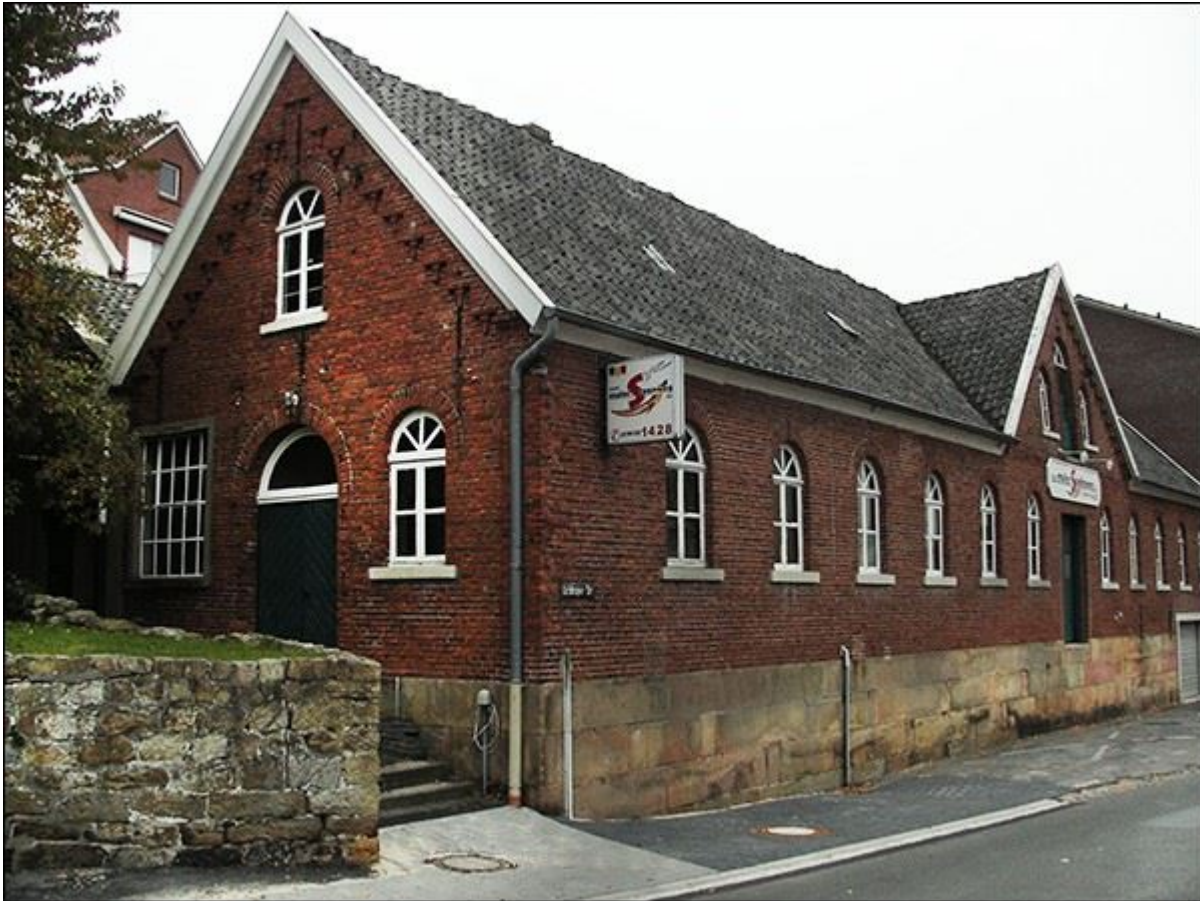
Ochtruper Straße, Blick nach Nordosten, mit unterem Stiegenaufgang