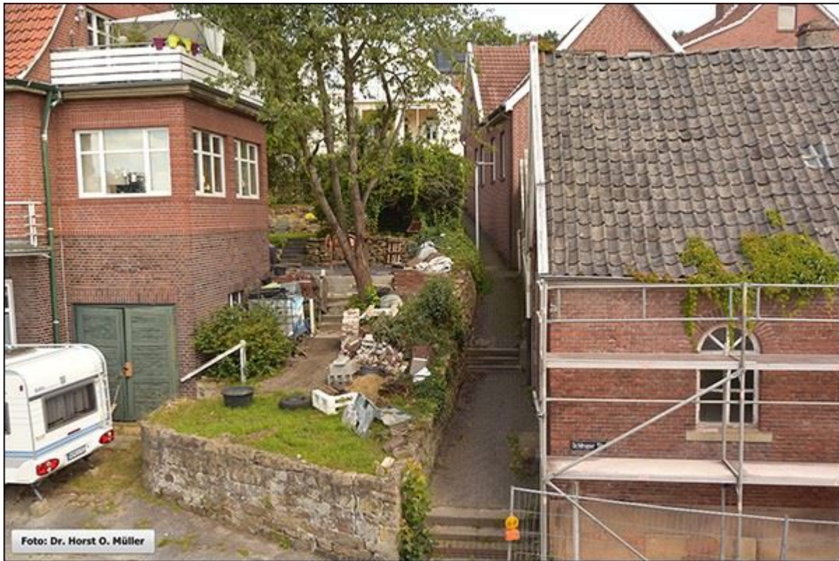
Stiegenverlauf, Blick nach Norden