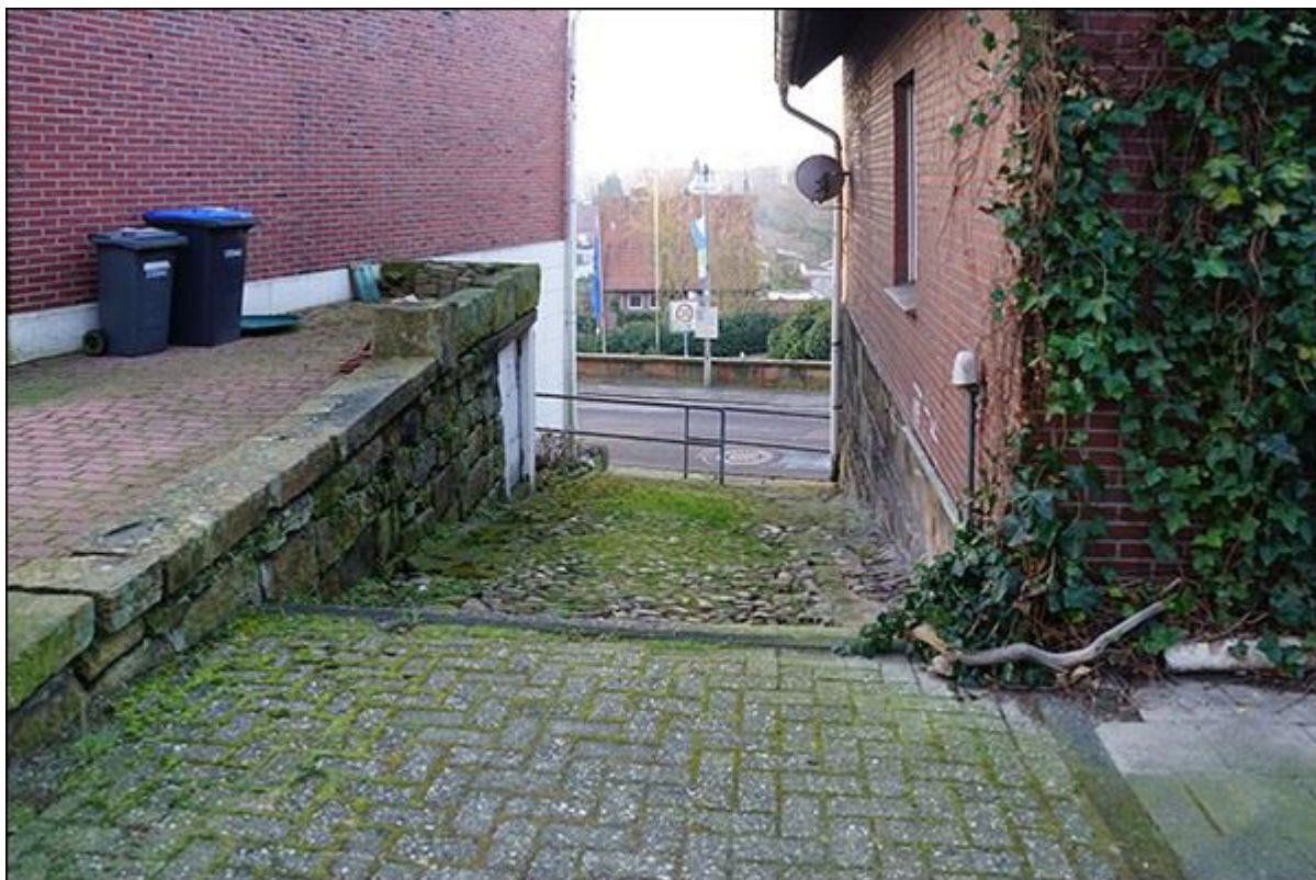
Blick durch die Schröderstiege, nach Süden