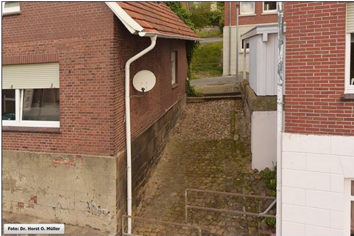
Blick in die Schröderstiege, nach Norden. Im Bildhintergrund ist die Gösselstiege zu erkennen.