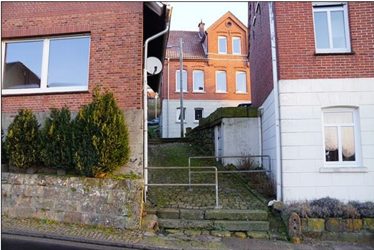
Blick von der Ochtruper Straße in die Schröderstiege