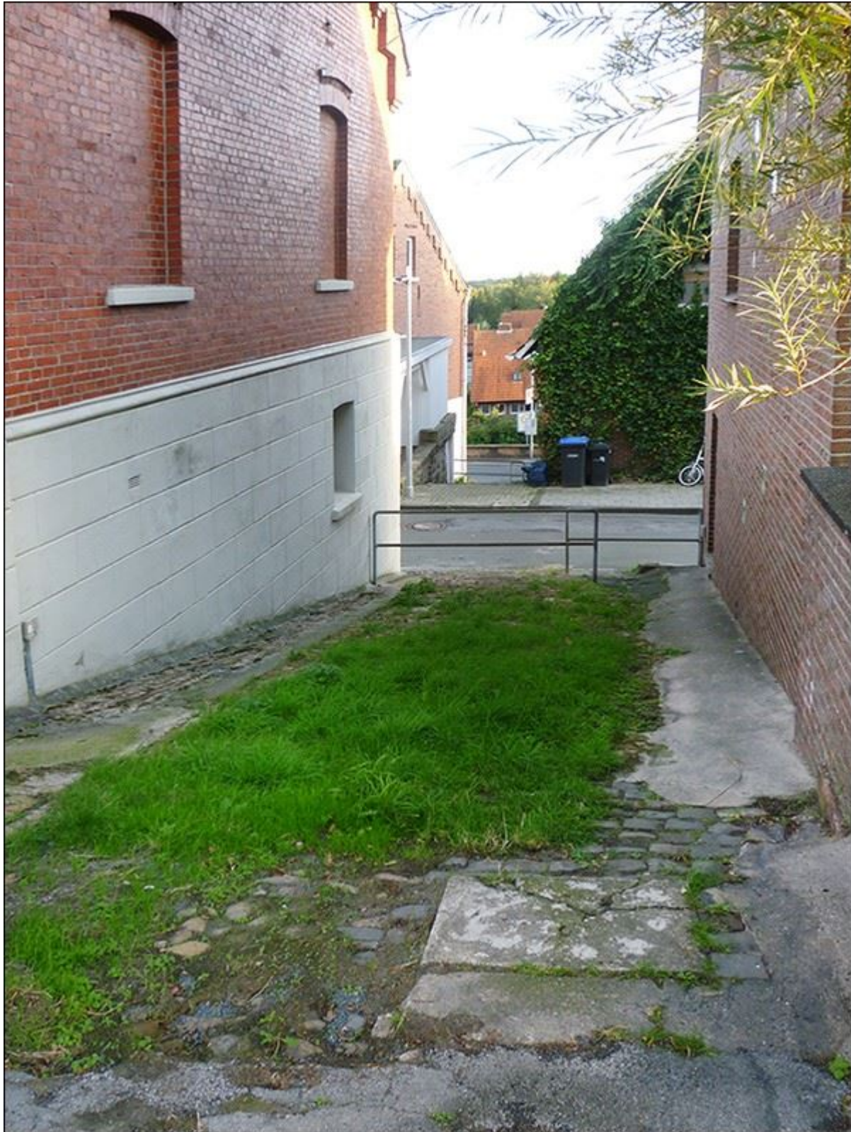
Blick durch die Gosselstiege nach Süden, im Bildhintergrund die Hülsberg-Schröder-Stiege