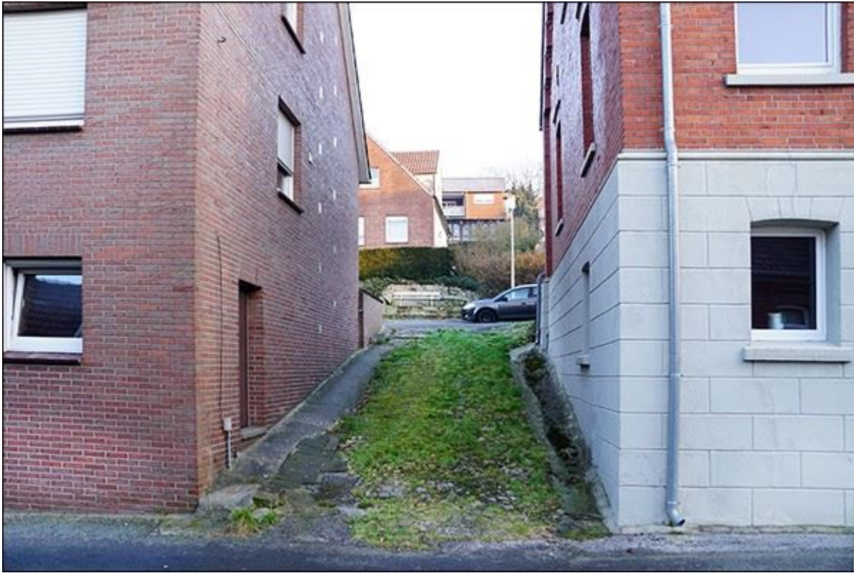
Blick von Süden auf die Gosselstiege, früherer Zustand ohne Barriere