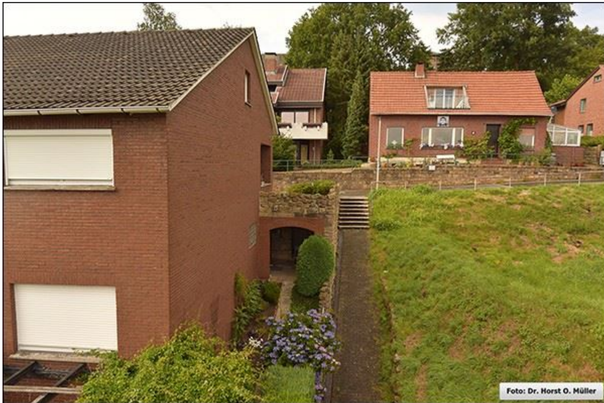
Untere Stenbergstiege nach Norden

Stiegenfreunde Bad Bentheim (Hrsg.): Stiegenkataster Bad Bentheim. Erstellt von Jürgen Schevel, © 2022. www.stiegenbadbentheim.de