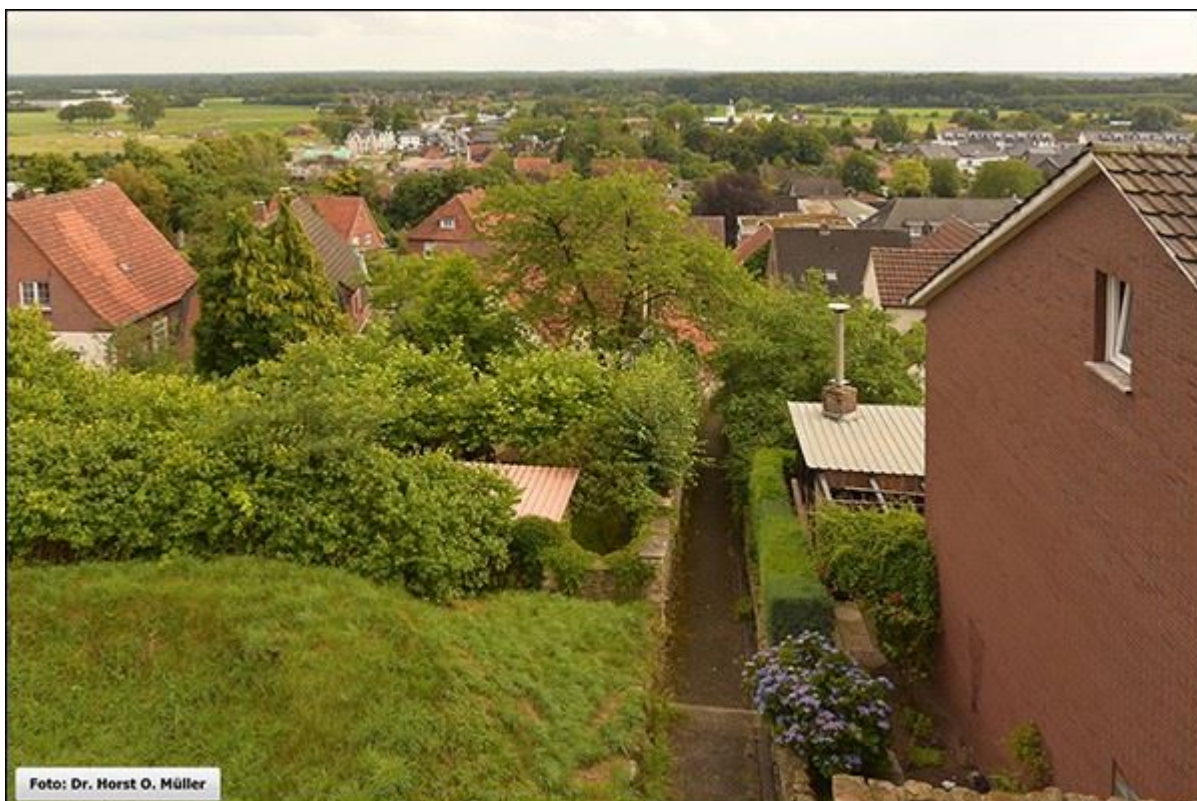
Stembergstiege nach Süden