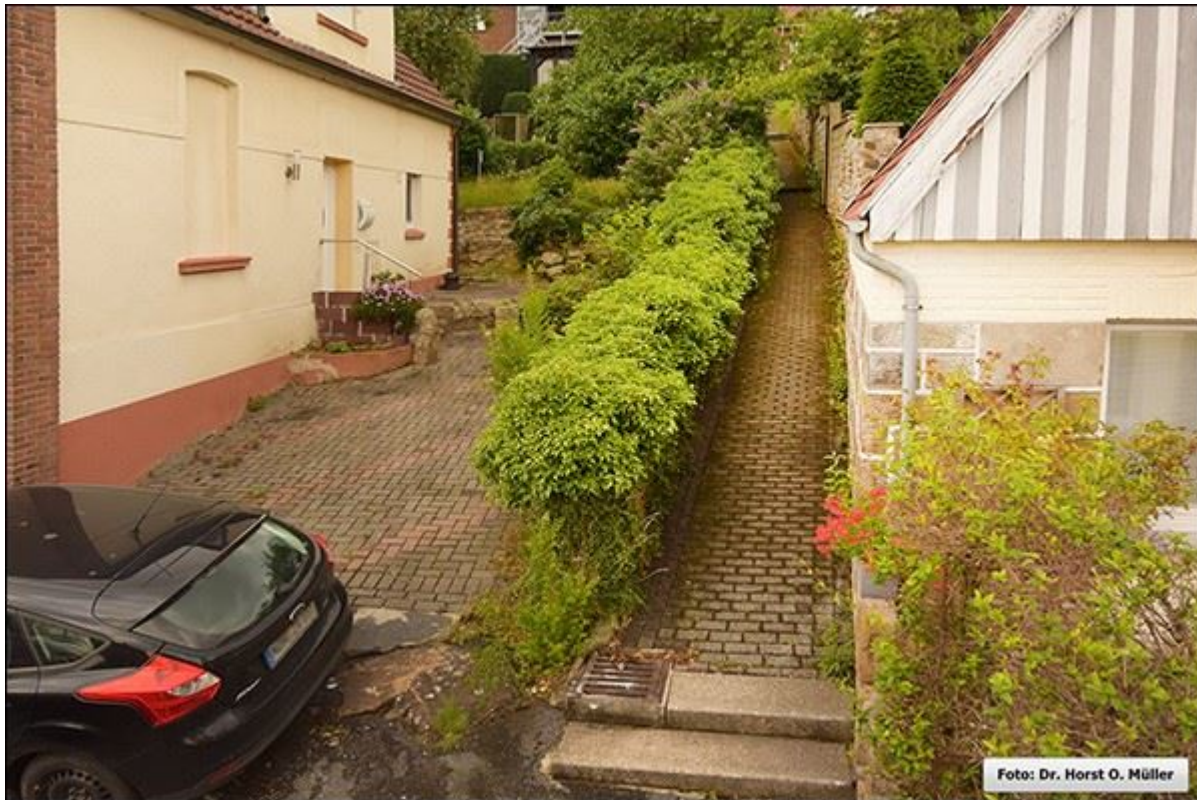
Stembergstiege nach Norden