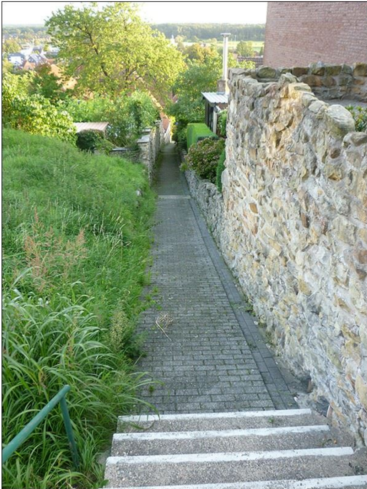
Stembergstiege nach Norden