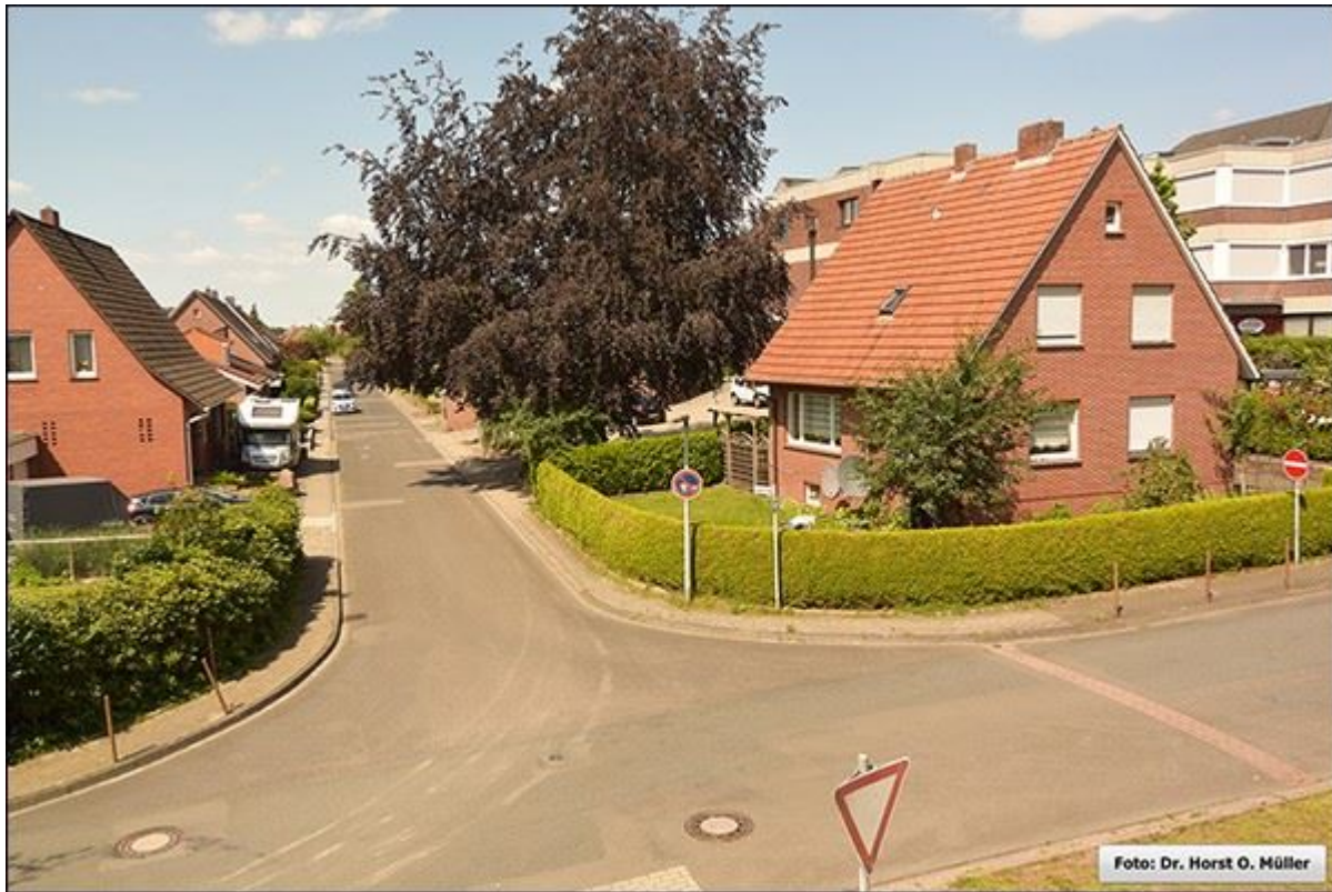
Blick durch die Klapperstiege in Richtung Westen