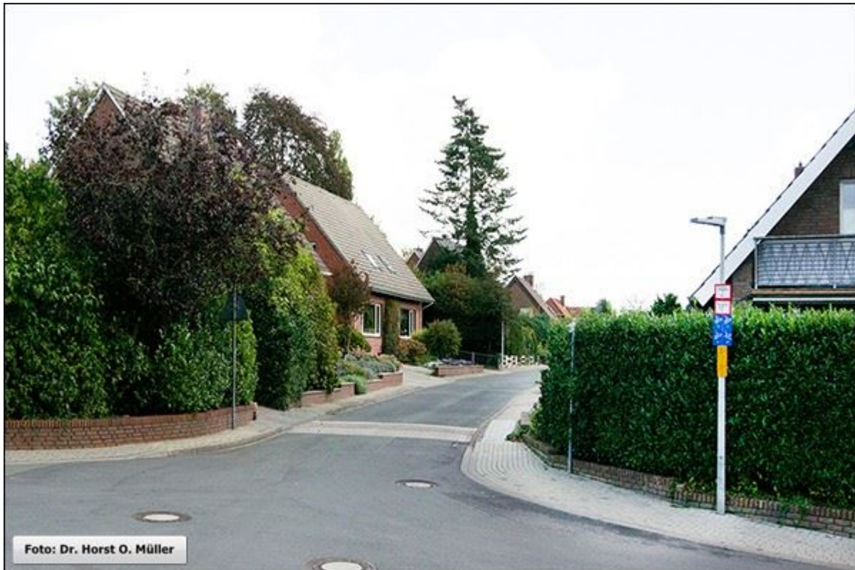
Klapperstiege, westlicher Beginn

Stiegenfreunde Bad Bentheim (Hrsg.): Stiegenkataster Bad Bentheim. Erstellt von Jürgen Schevel, © 2022. www.stiegenbadbentheim.de