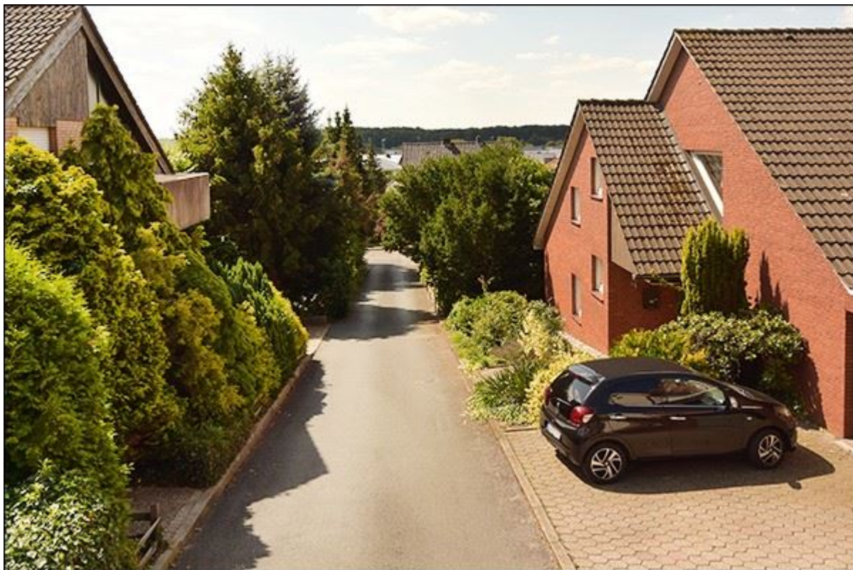
Blick durch die Klapperstiege in Richtung Süden