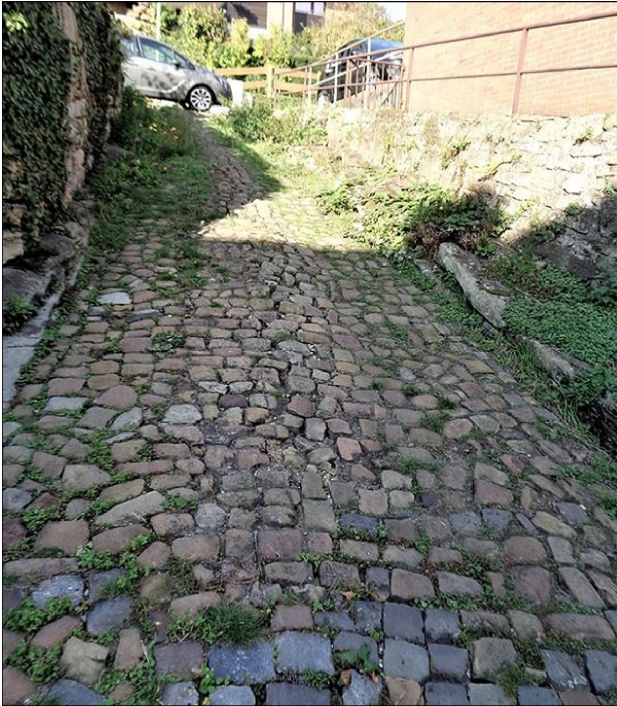
Kurze Stiege, Blick nach Norden