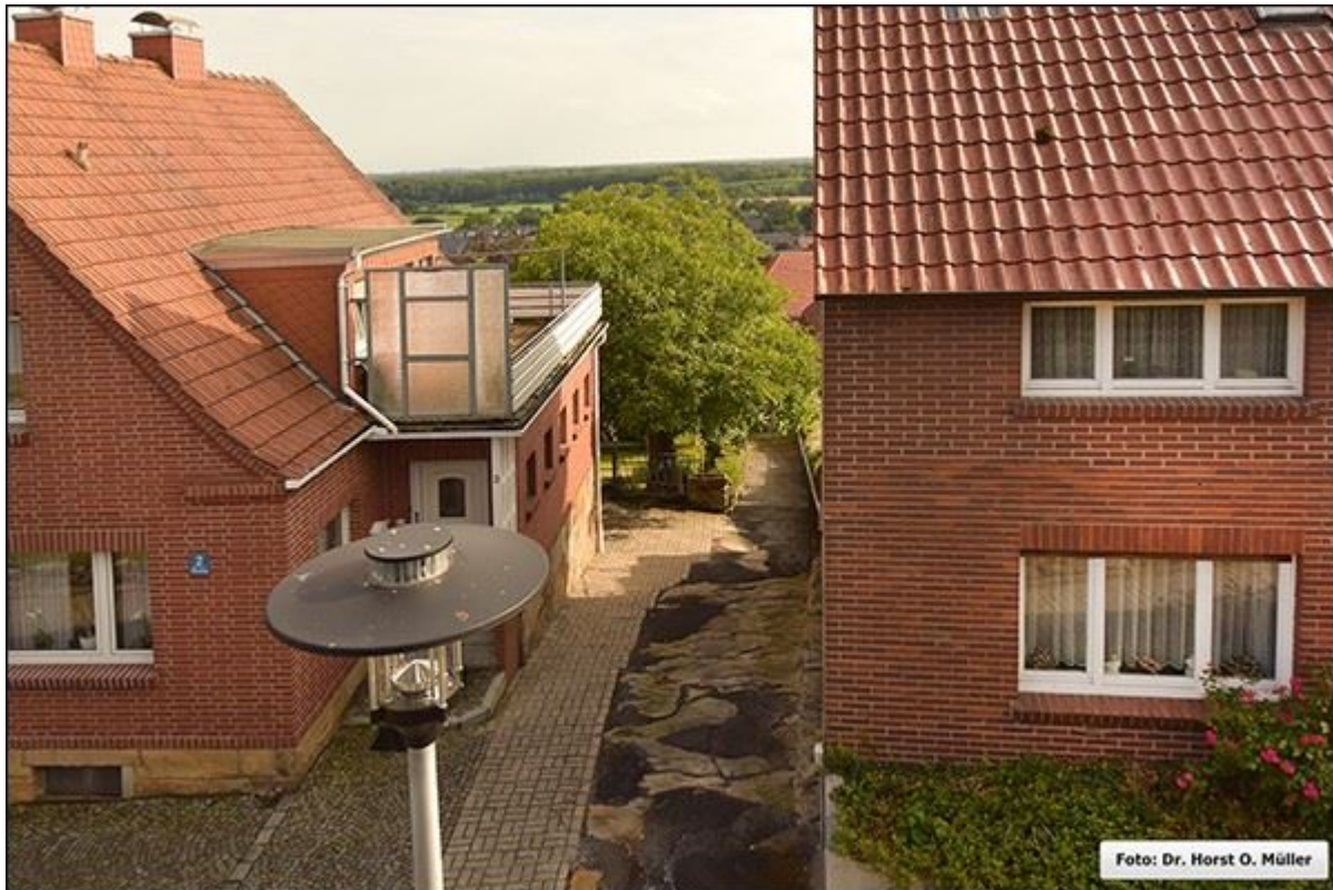
Foppestiege, abwärts, Blick nach Süden

Stiegenfreunde Bad Bentheim (Hrsg.): Stiegenkataster Bad Bentheim. Erstellt von Jürgen Schevel, © 2022. www.stiegenbadbentheim.de