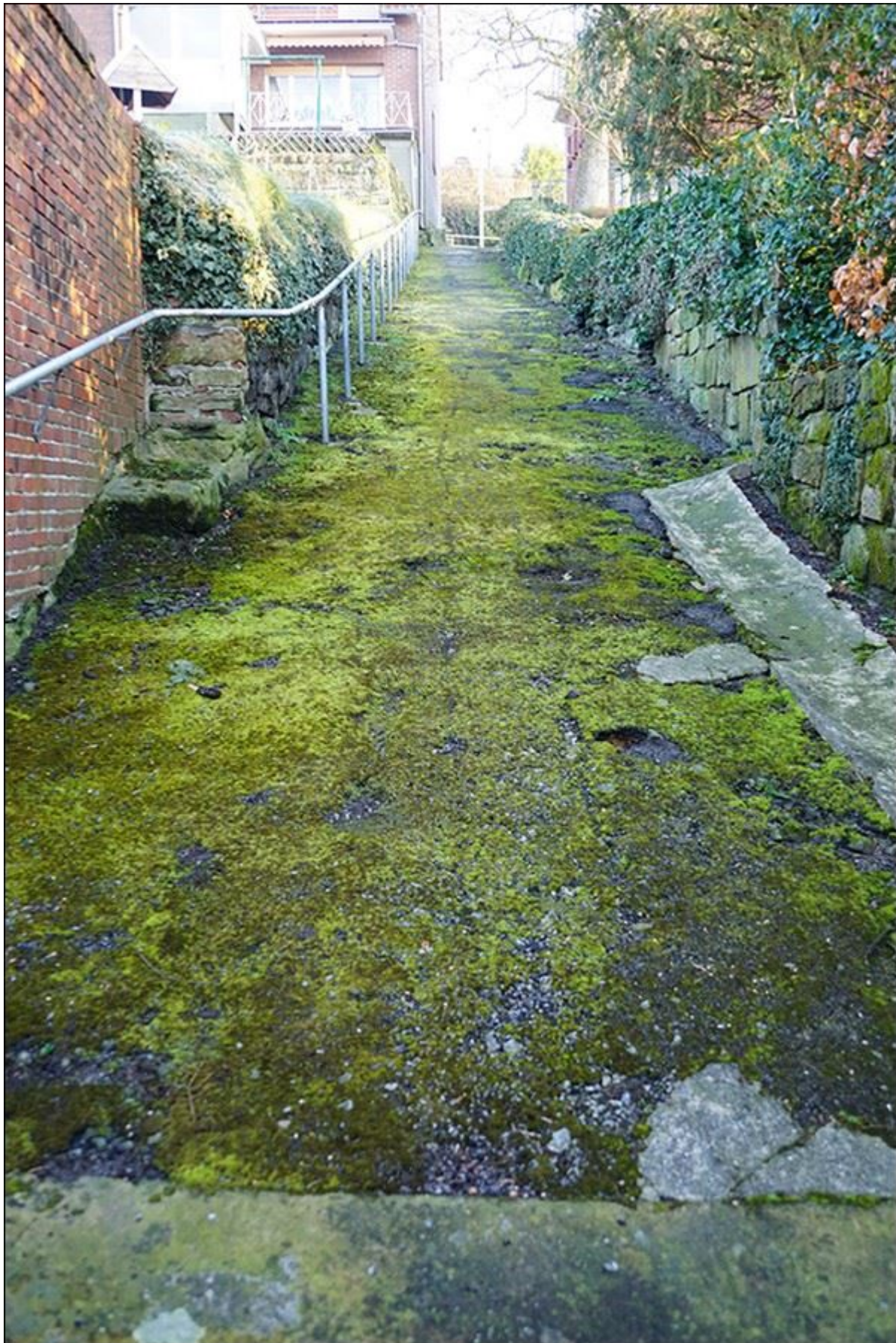
Mitte der Foppestiege, Blick nach Norden