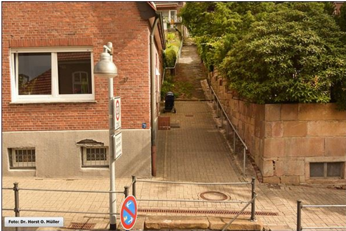
Foppestiege, aufwärts, nach Norden