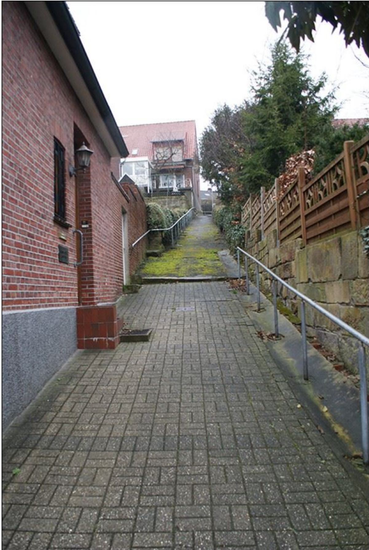
Untere Foppestiege, Blick nach Norden