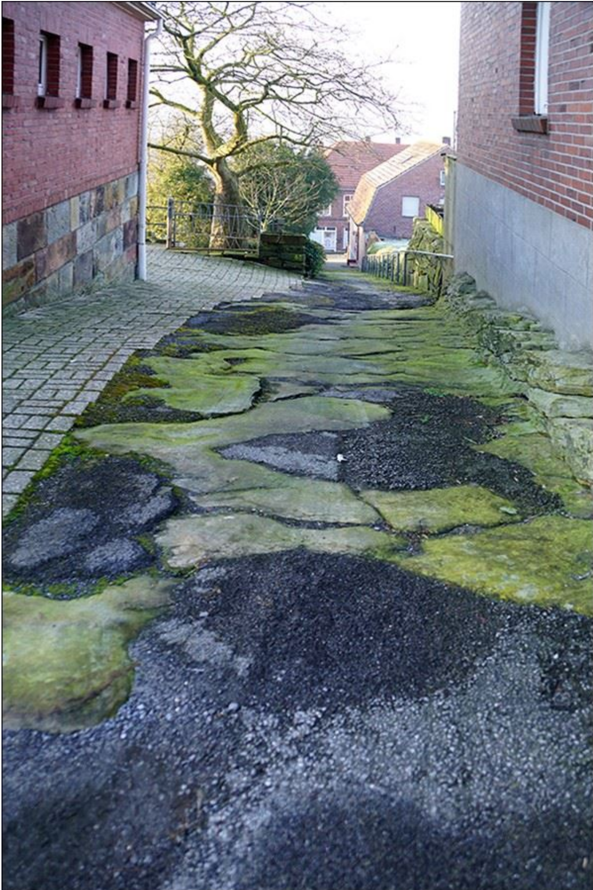
Obere Foppestiege, Blick nach Süden