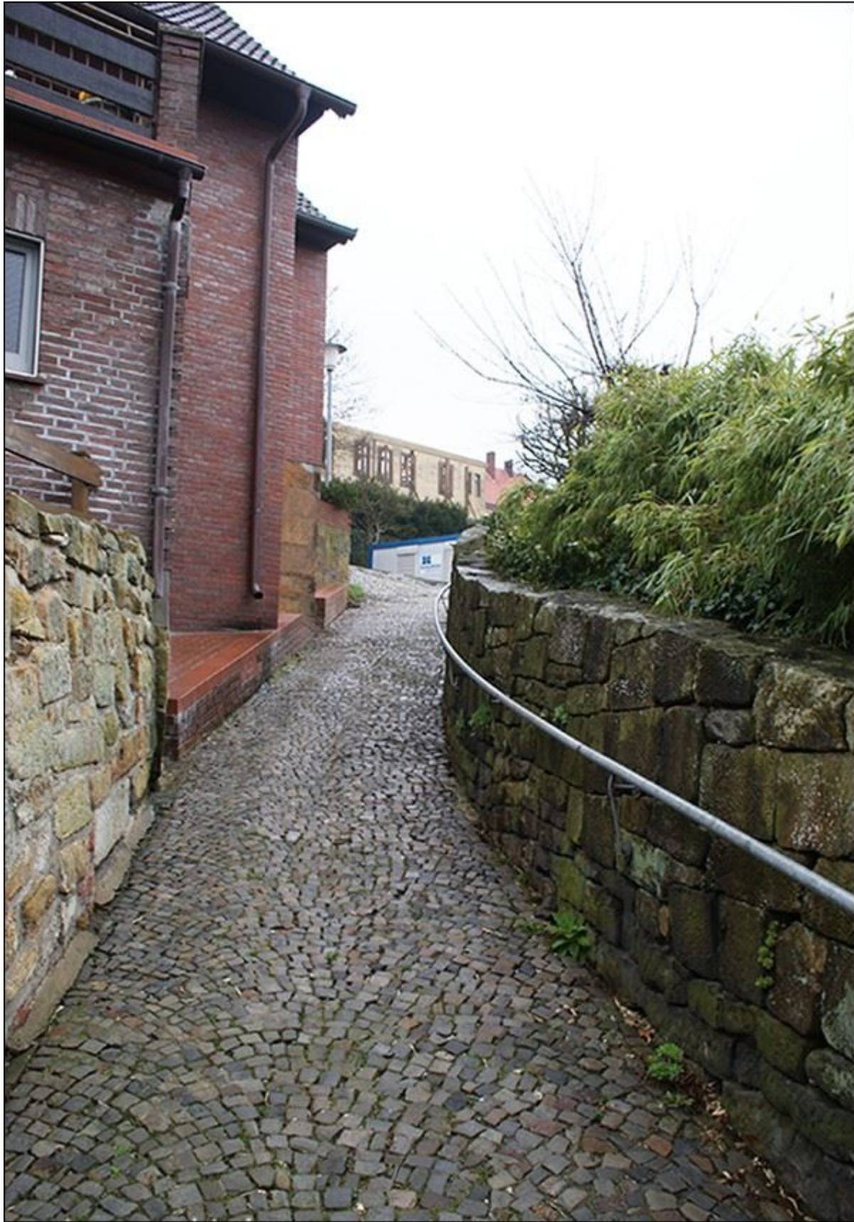
Gartenpuettenstiege, Blick nach Nordosten (Zur Zeit der Aufnahme noch befahrbar)