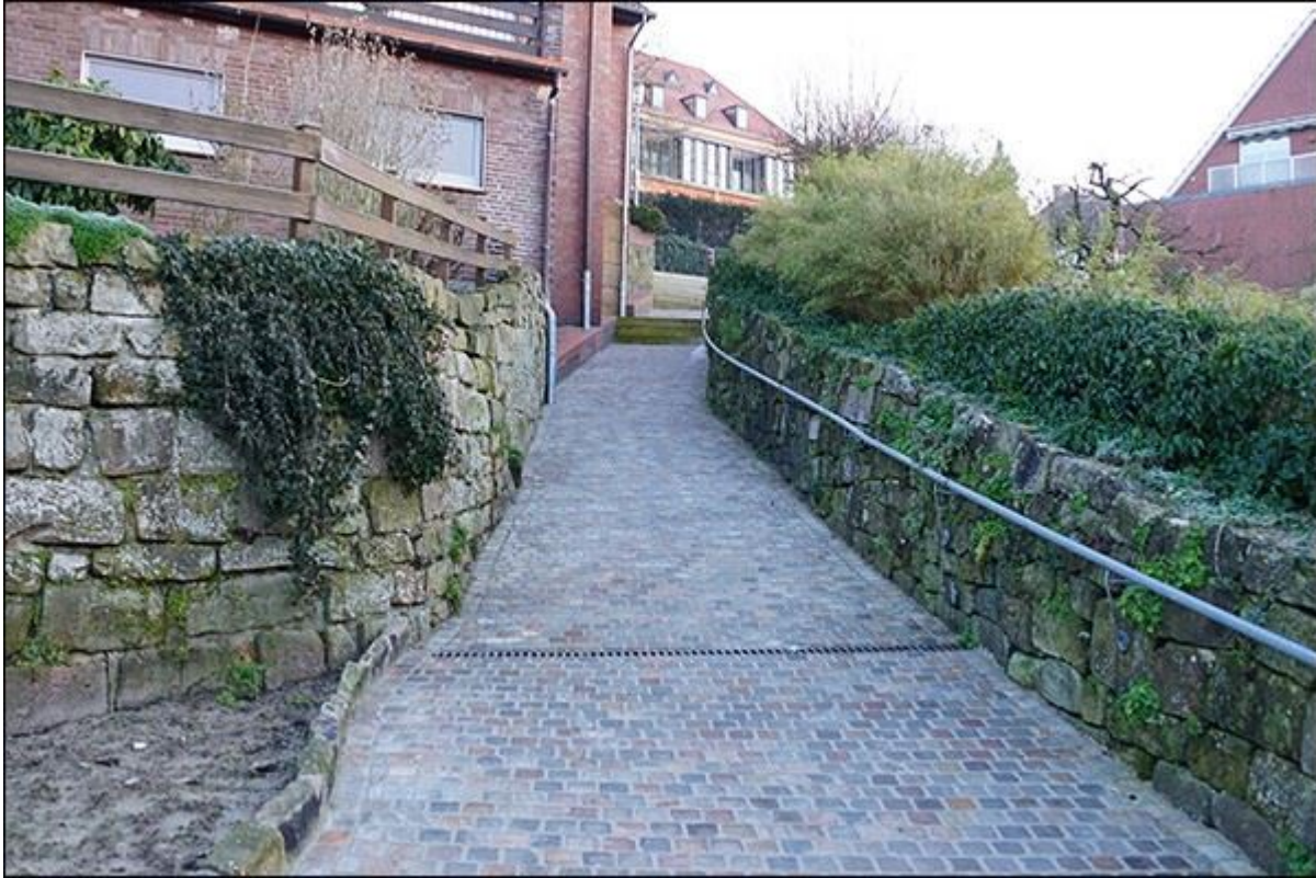
Gartenpuettenstiege, Blick nach Nordosten

Nahansicht: nachträglich eingebaute Betontreppen (problematisch für Fahrradfahrer(innen)/Kinderwagen/ Behinderte usw.) Blick nach Nordosten