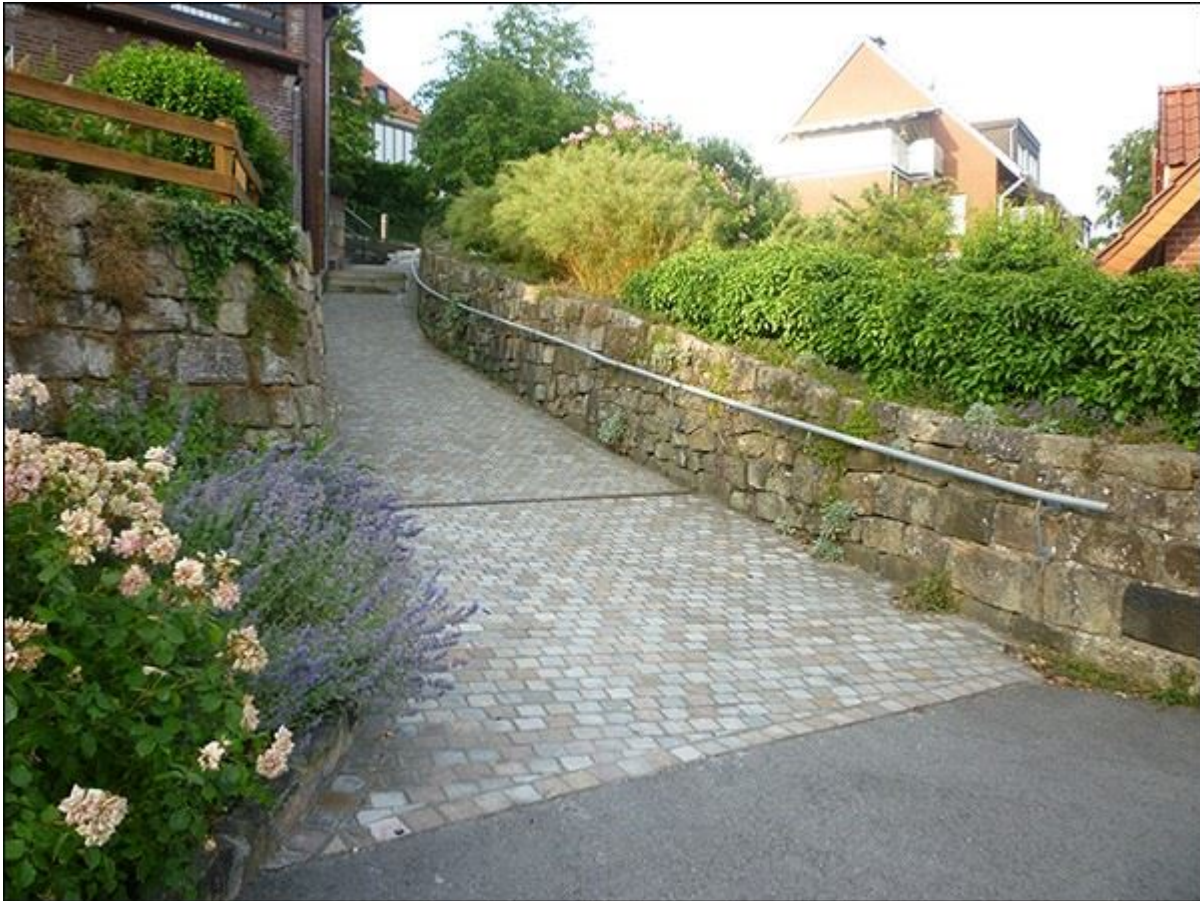
Gartenpuettenstiege, Blick nach Nordosten, Stiege mit eingebauten Treppenstufen