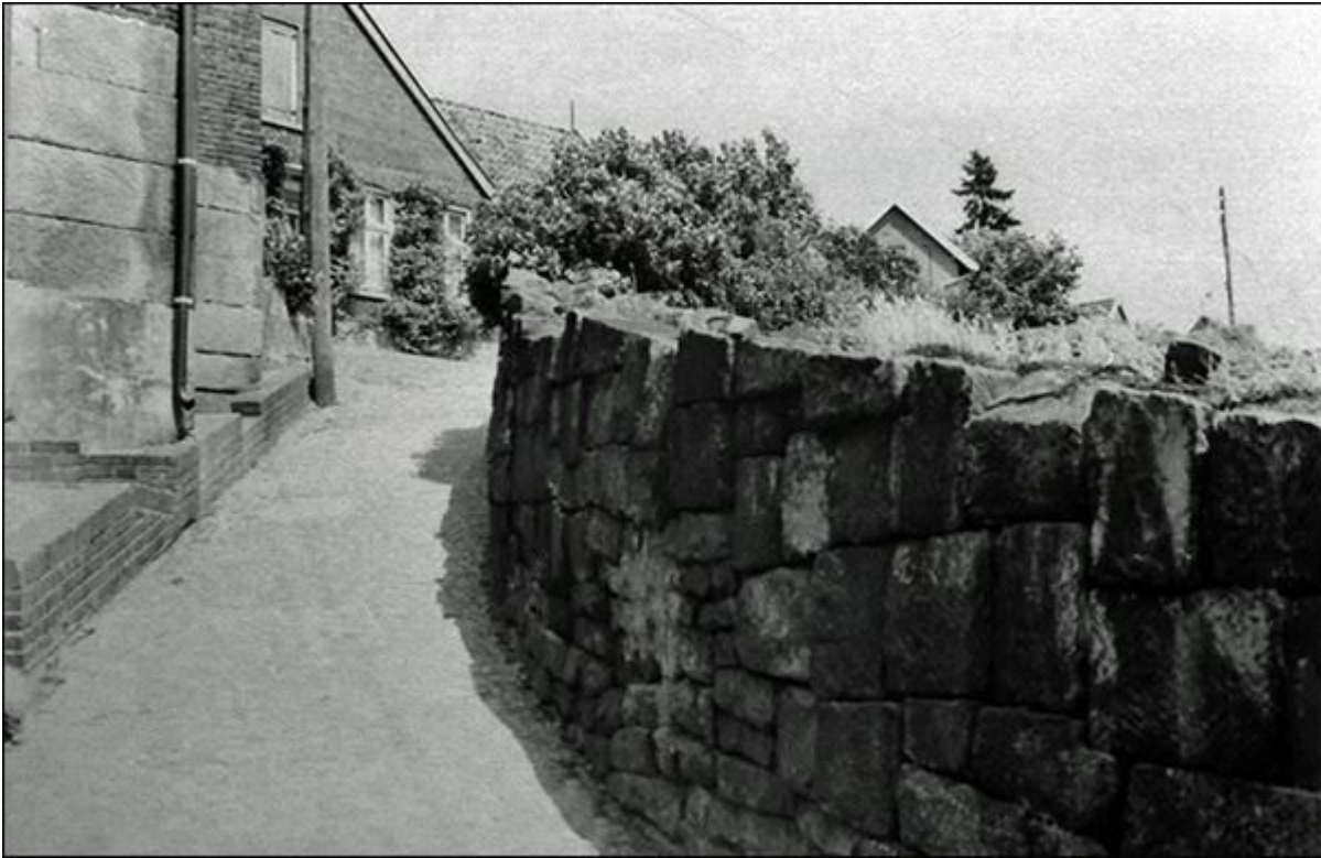
Gartenpuettenstiege, Blick nach Nordosten