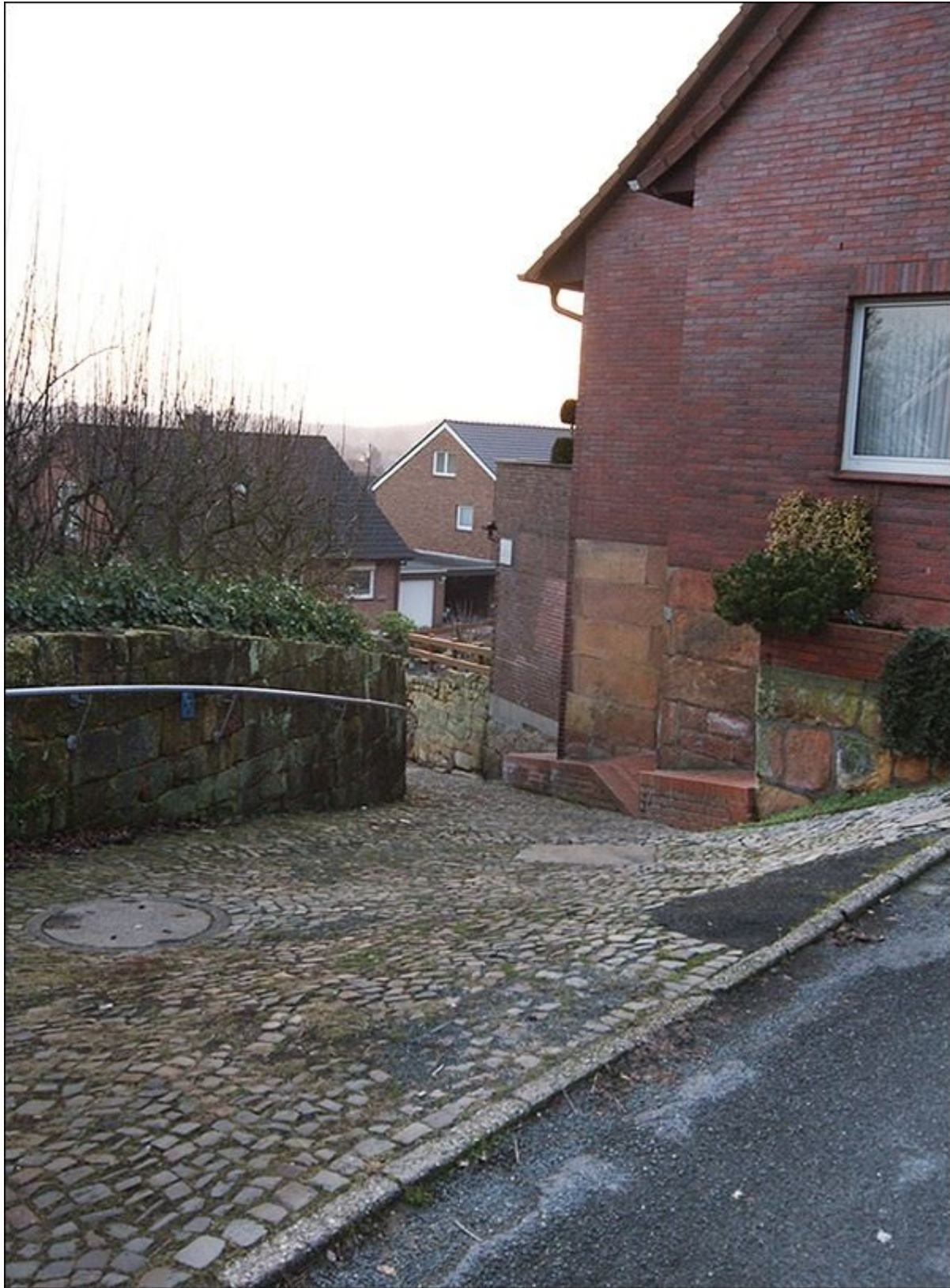
Gartenpuettenstiege, Blick nach Südwesten (zur Zeit der Aufnahme noch befahrbar)