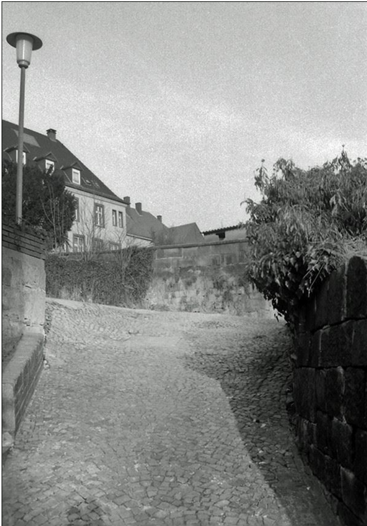
Gartenpuettenstiege, Blick nach Nordosten