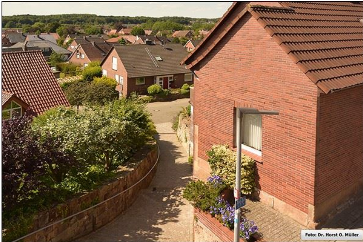
Gartenpuettenstiege, Blick nach Südwesten, 2020

Stiegenfreunde Bad Bentheim (Hrsg.): Stiegenkataster Bad Bentheim. Erstellt von Jürgen Schevel, © 2022. www.stiegenbadbentheim.de