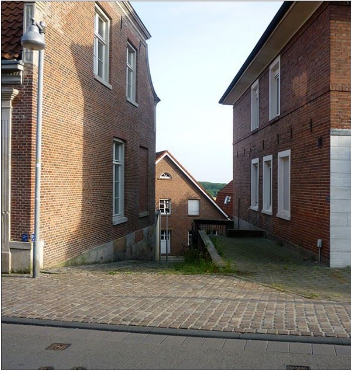
Blick auf die Bergfeldstiege, nach Süden