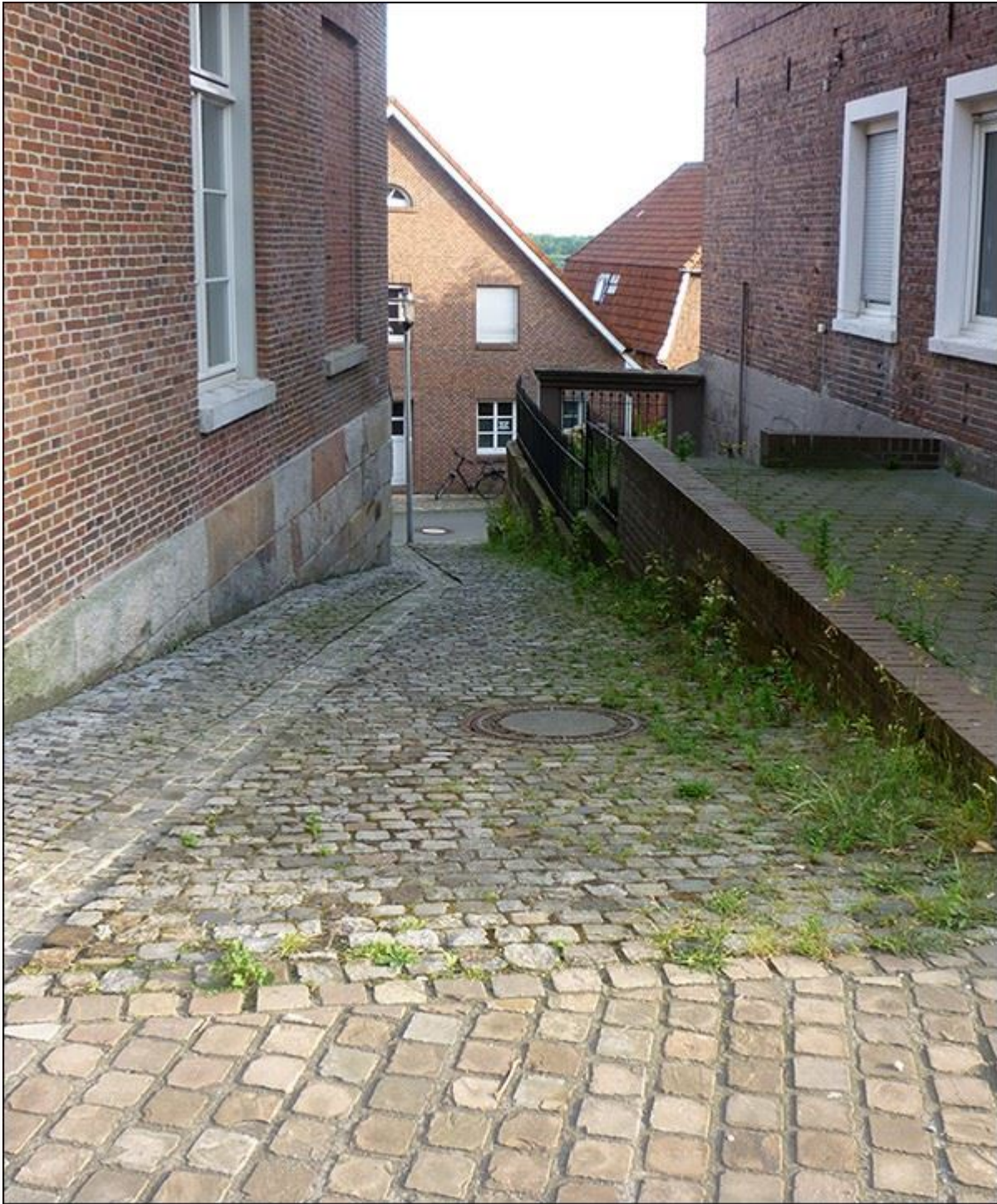
Blick auf die Bergfeldstiege, nach Süden