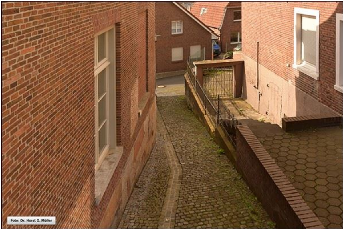
Blick auf die Bergfeldstiege, nach Süden