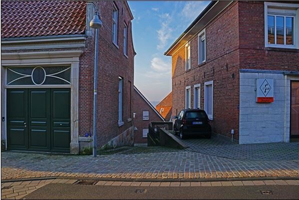
Blick auf die Bergfeldstiege, nach Süden