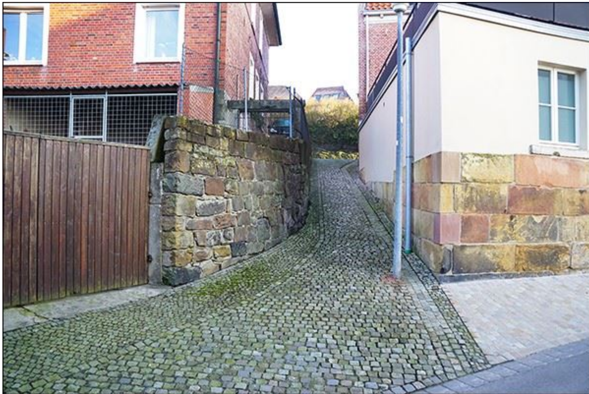
Blick durch die Bergfeldstiege, nach Norden

Stiegenfreunde Bad Bentheim (Hrsg.): Stiegenkataster Bad Bentheim. Erstellt von Jürgen Schevel, © 2022. www.stiegenbadbentheim.de