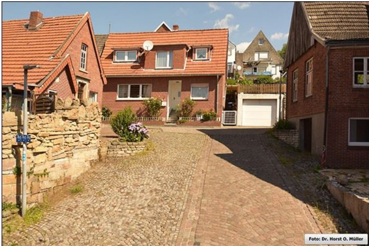
Blick aus der Unterstraße auf die Stellmacherstiege

Stiegenfreunde Bad Bentheim (Hrsg.): Stiegenkataster Bad Bentheim. Erstellt von Jürgen Schevel, © 2022. www.stiegenbadbentheim.de