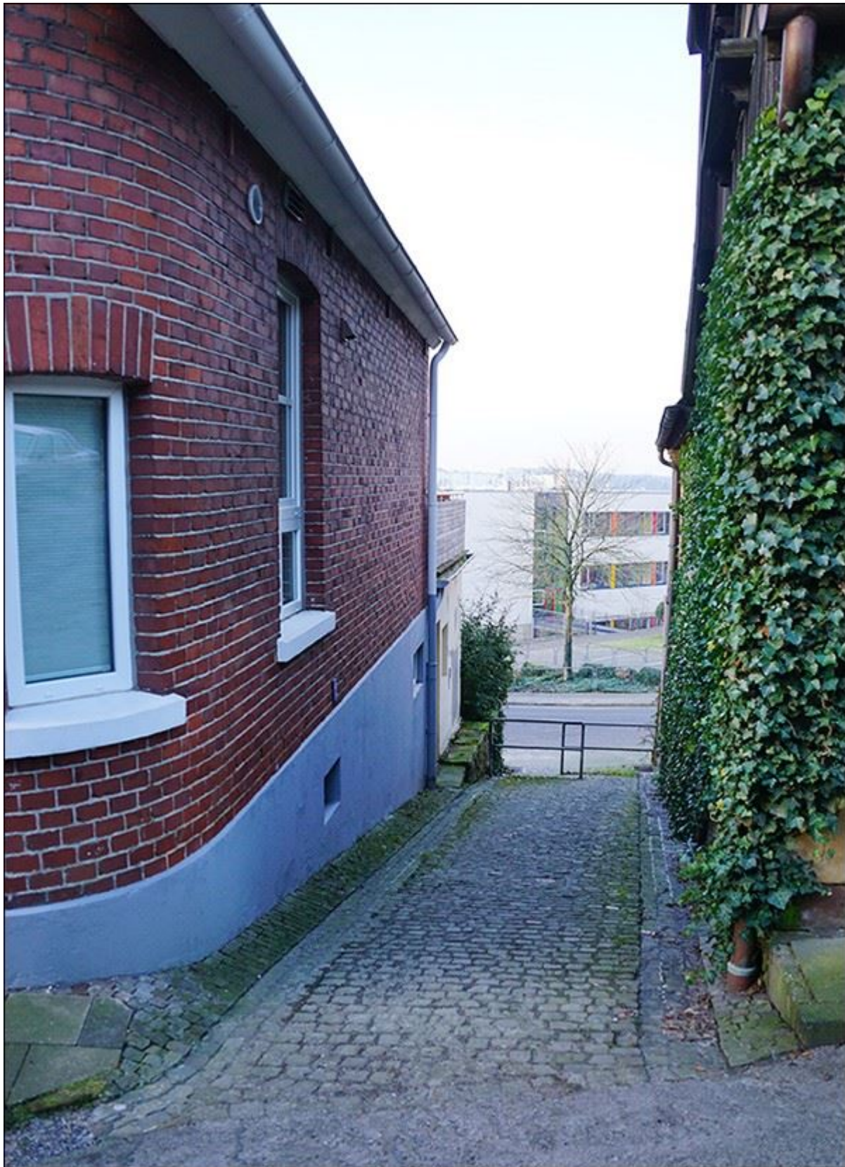
Blick durch die Schroerstiege nach Süden