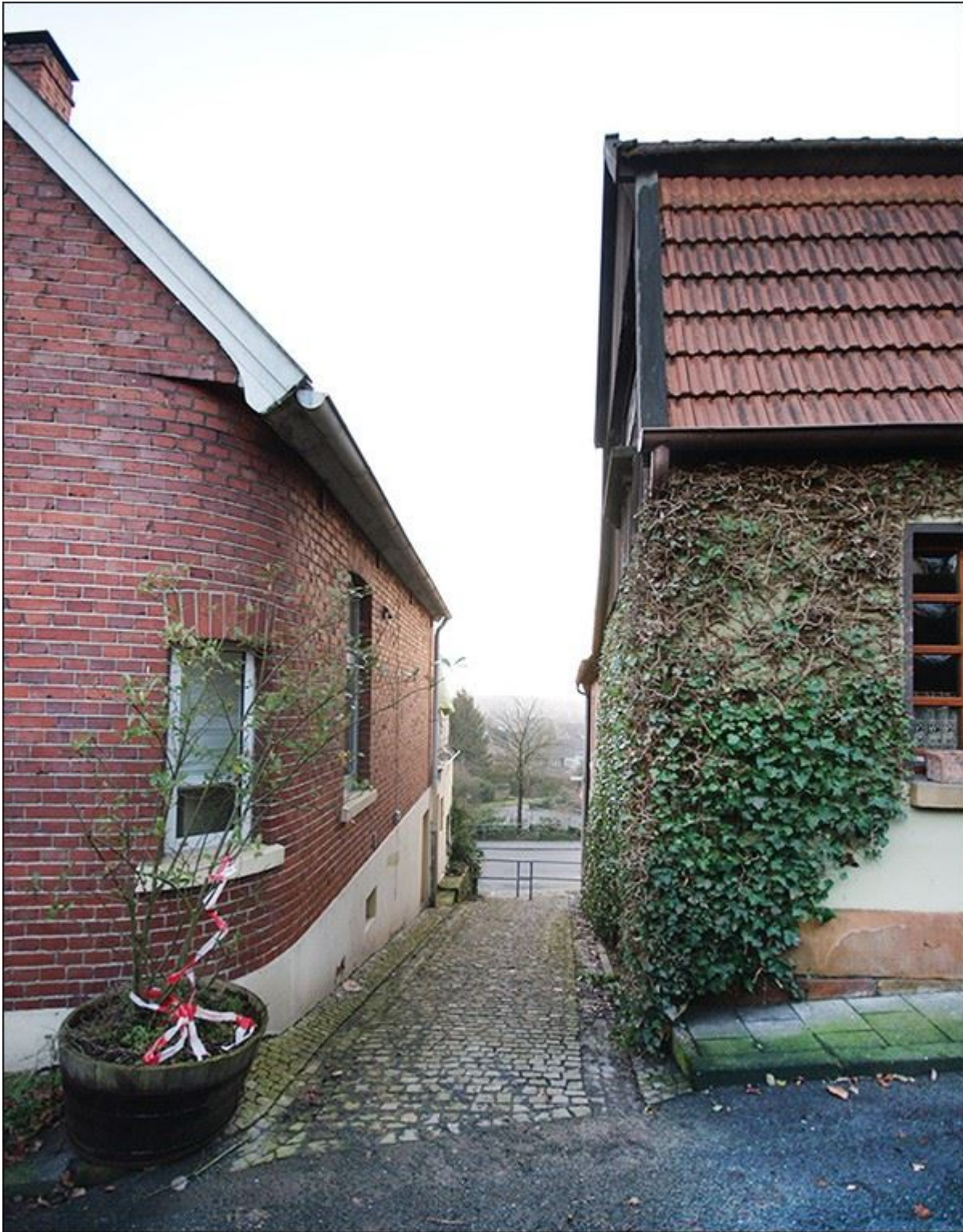
Blick durch die Schroerstiege nach Süden, ältere Bebauung