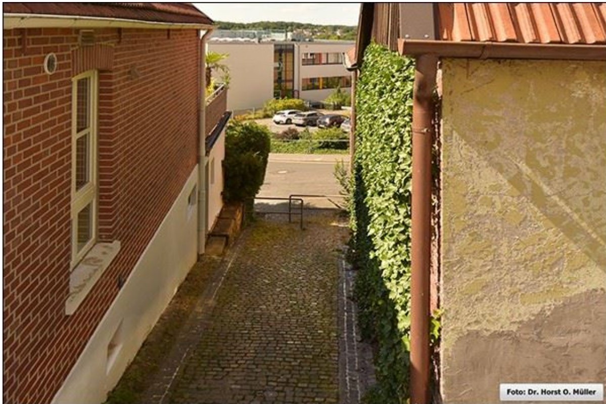
Blick durch die Schroerstiege nach Süden, Aufnahme aus erhöhter Position

Stiegenfreunde Bad Bentheim (Hrsg.): Stiegenkataster Bad Bentheim. Erstellt von Jürgen Schevel, © 2022. www.stiegenbadbentheim.de