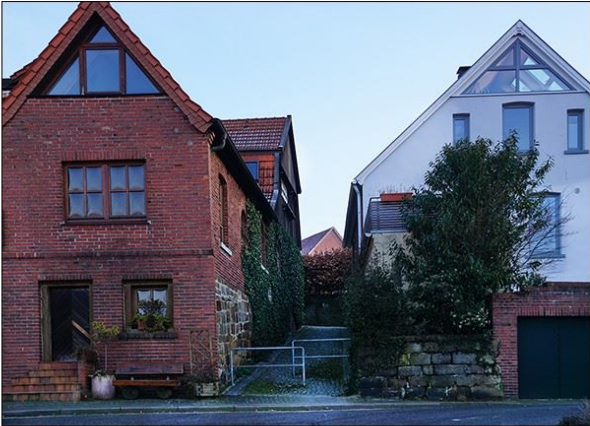
Blick durch die Schroerstiege nach Norden