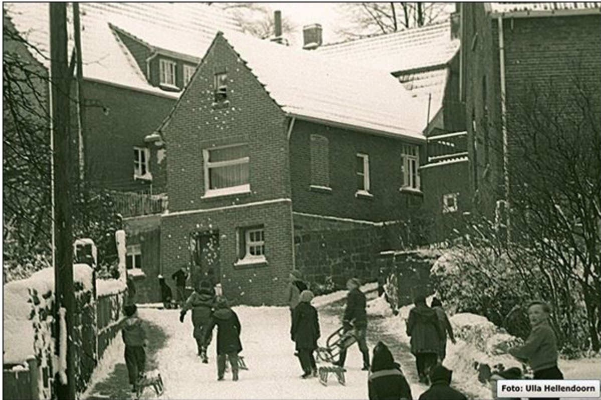
Blick aus der Brennereistraße zur Schroerstiege