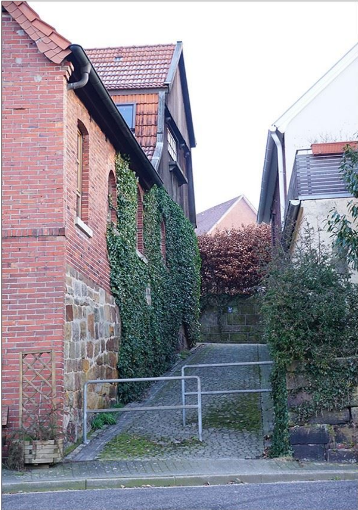
Blick durch die Schroerstiege nach Norden