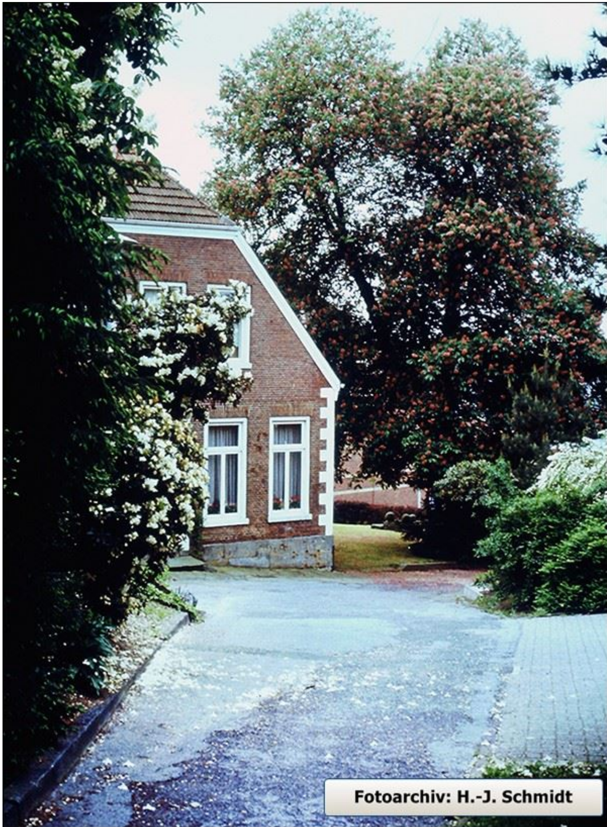
Drees Hof an der Rathausstiege