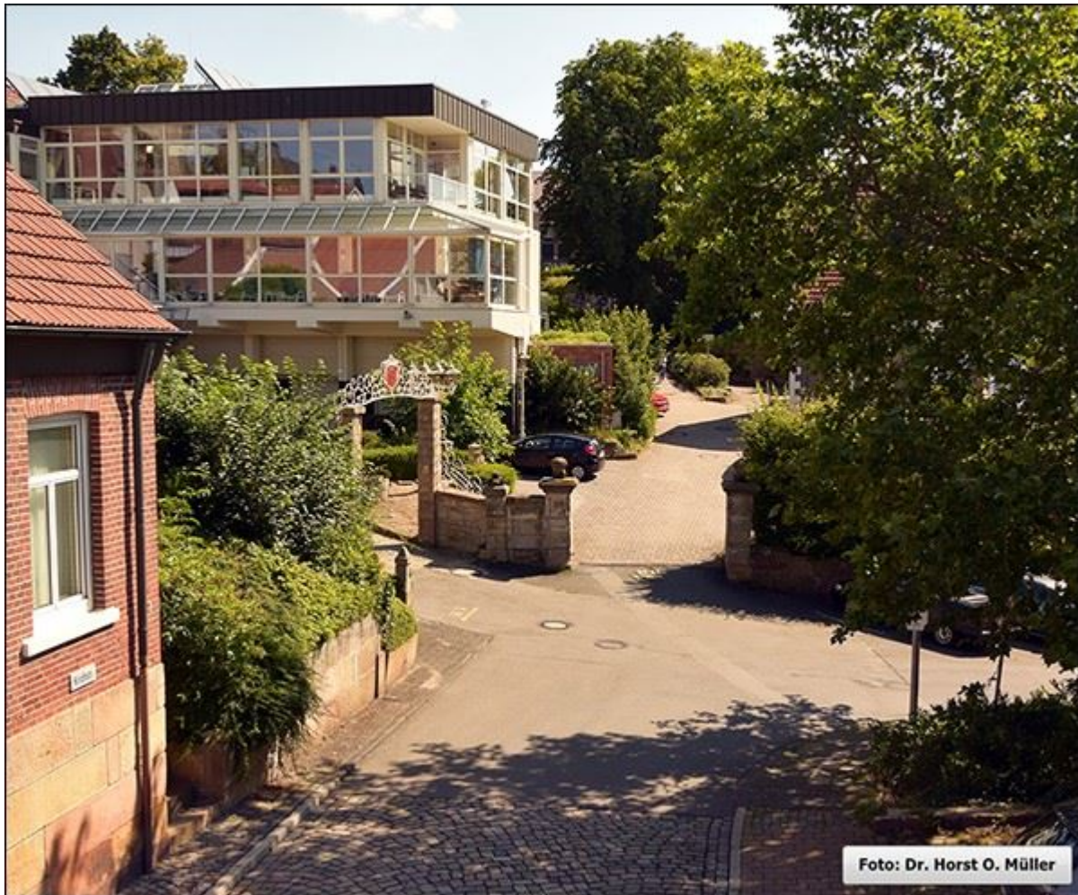
Blick zur Drees-Hof-Stiege, nach Osten, Aufnahme aus erhöhter Position