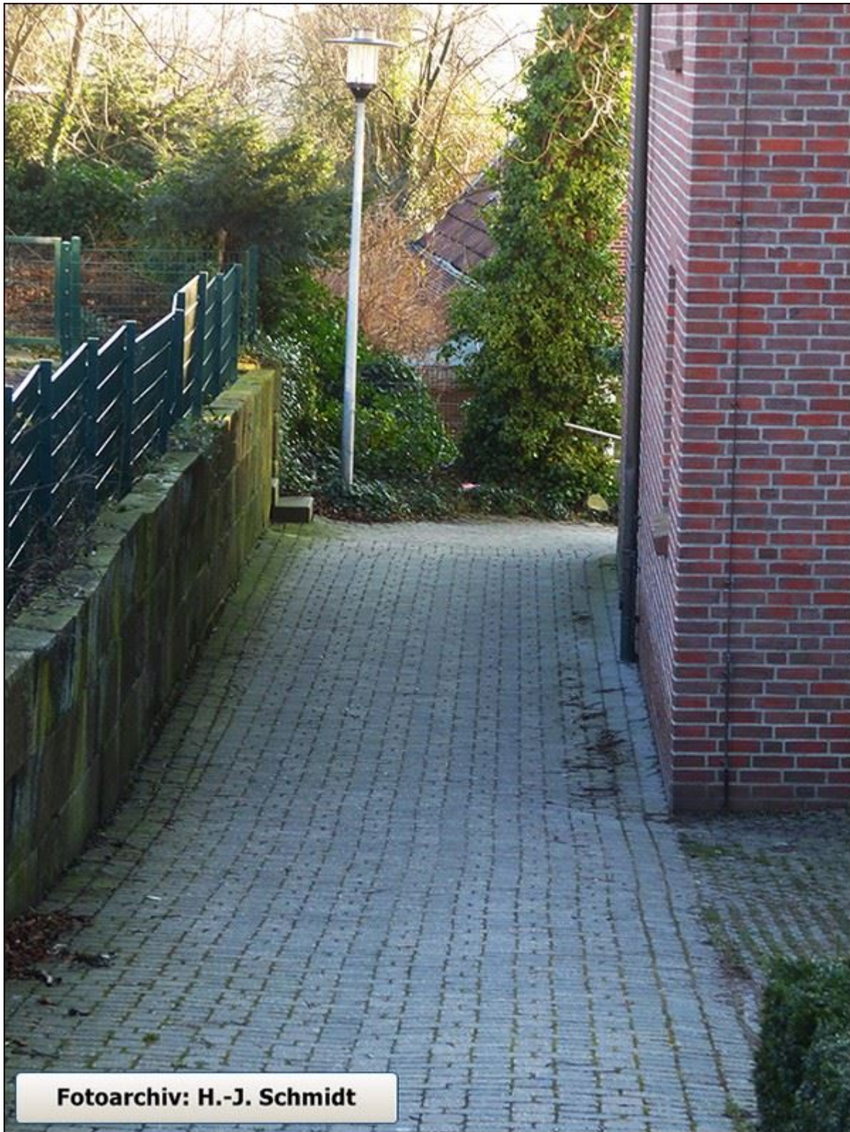
Drees-Hof-Stiege, Blick nach Süden