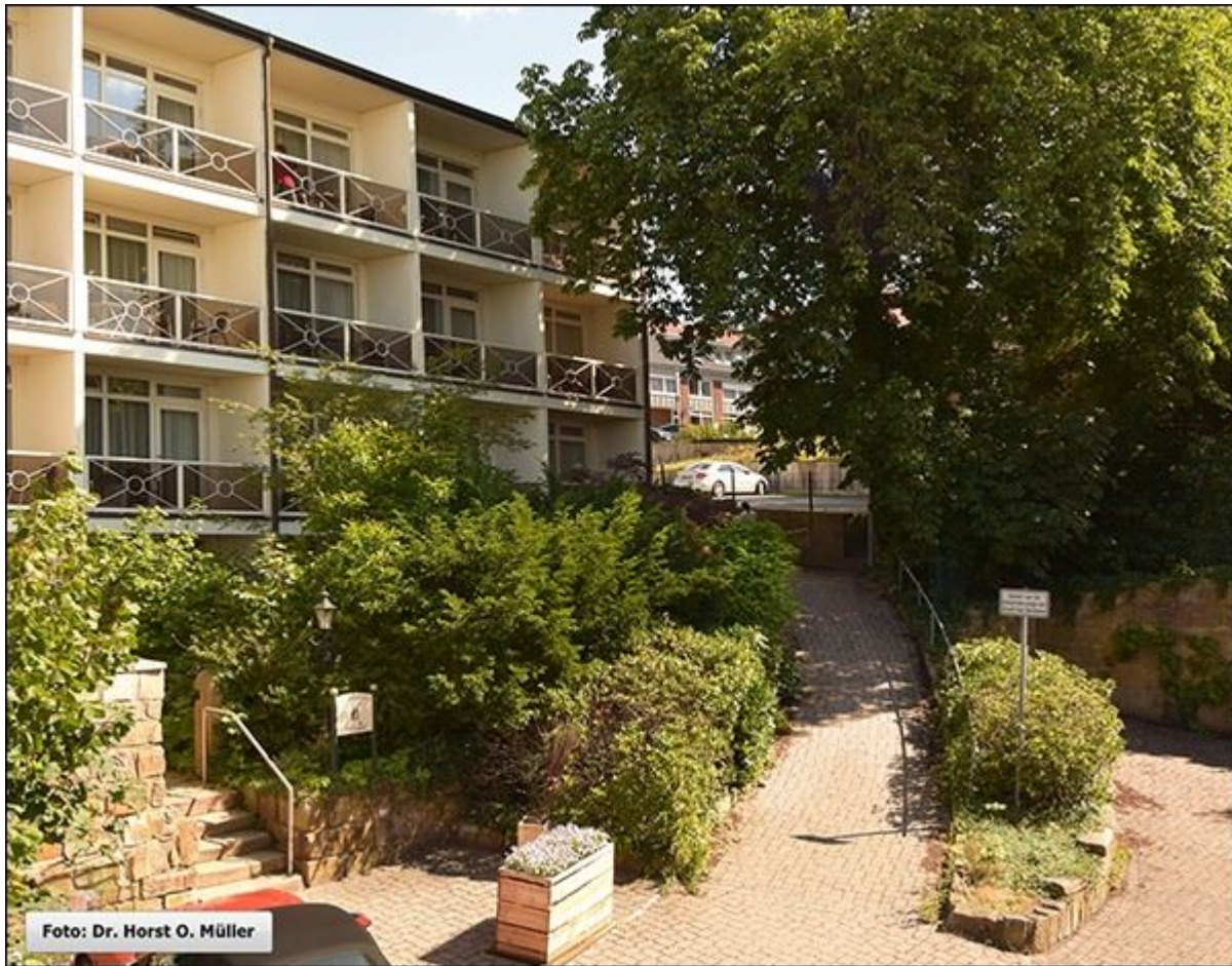
Drees-Hof-Stiege, stark ansteigender Abschnitt