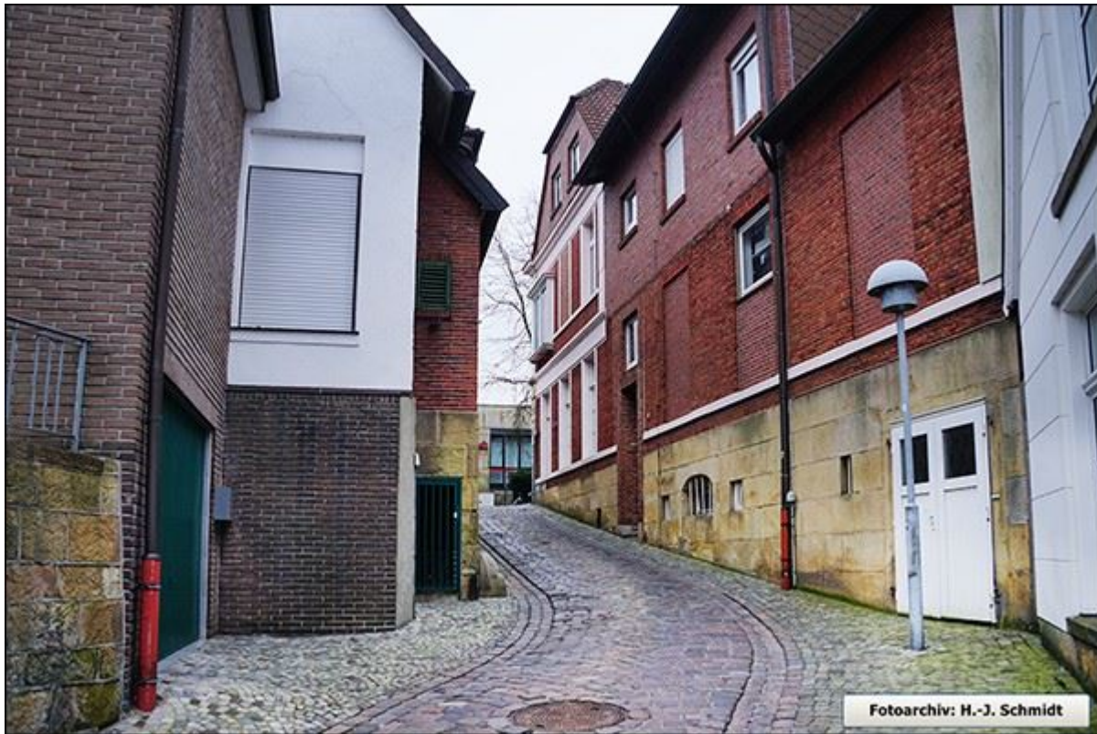
Obere Niehausstiege, aufwärts