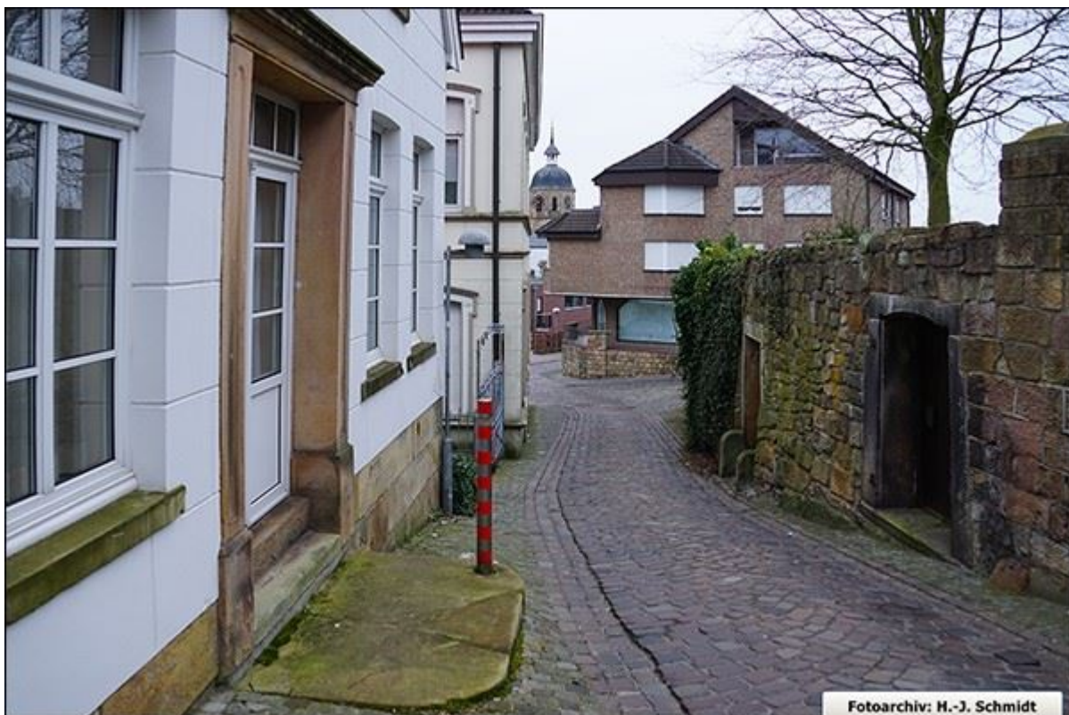
Niehausstiege, abwärts. An der Ecke: Weinkellerstiege/ Kirchstraße ist ein voluminöser Neubau entstanden.