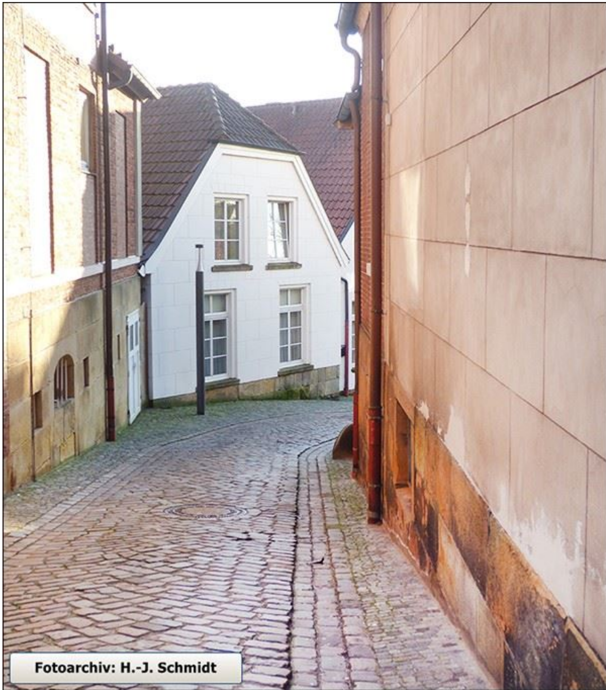
Obere Niehausstiege, abwärts