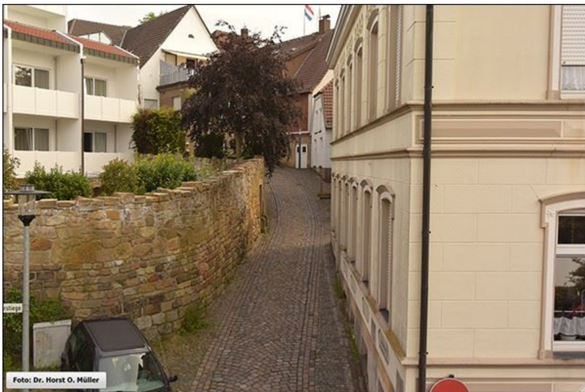
Niehausstiege, hügelaufwärts, mit applanierem Fußgängerbereich