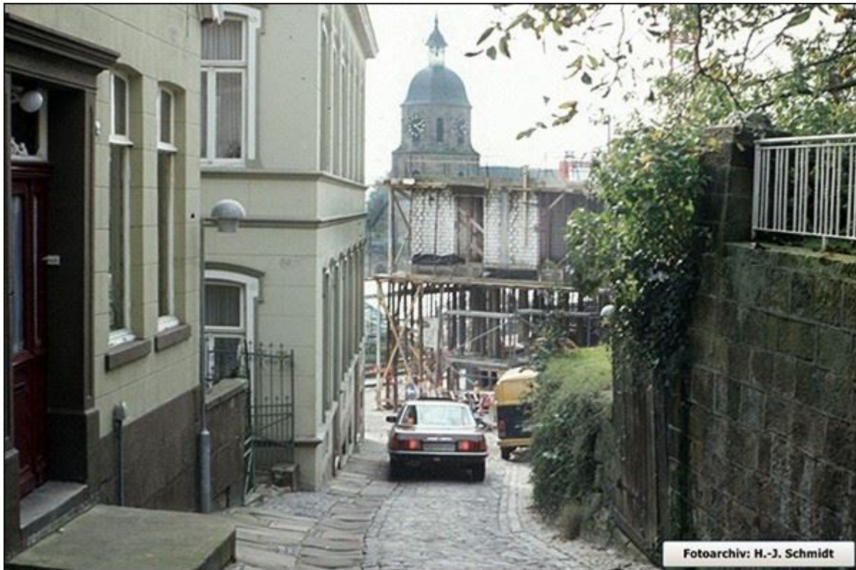
Niehausstiege, abwärts. Baulicher Zustand nach Abbruch des Meckfesselschen Geschäftshauses.