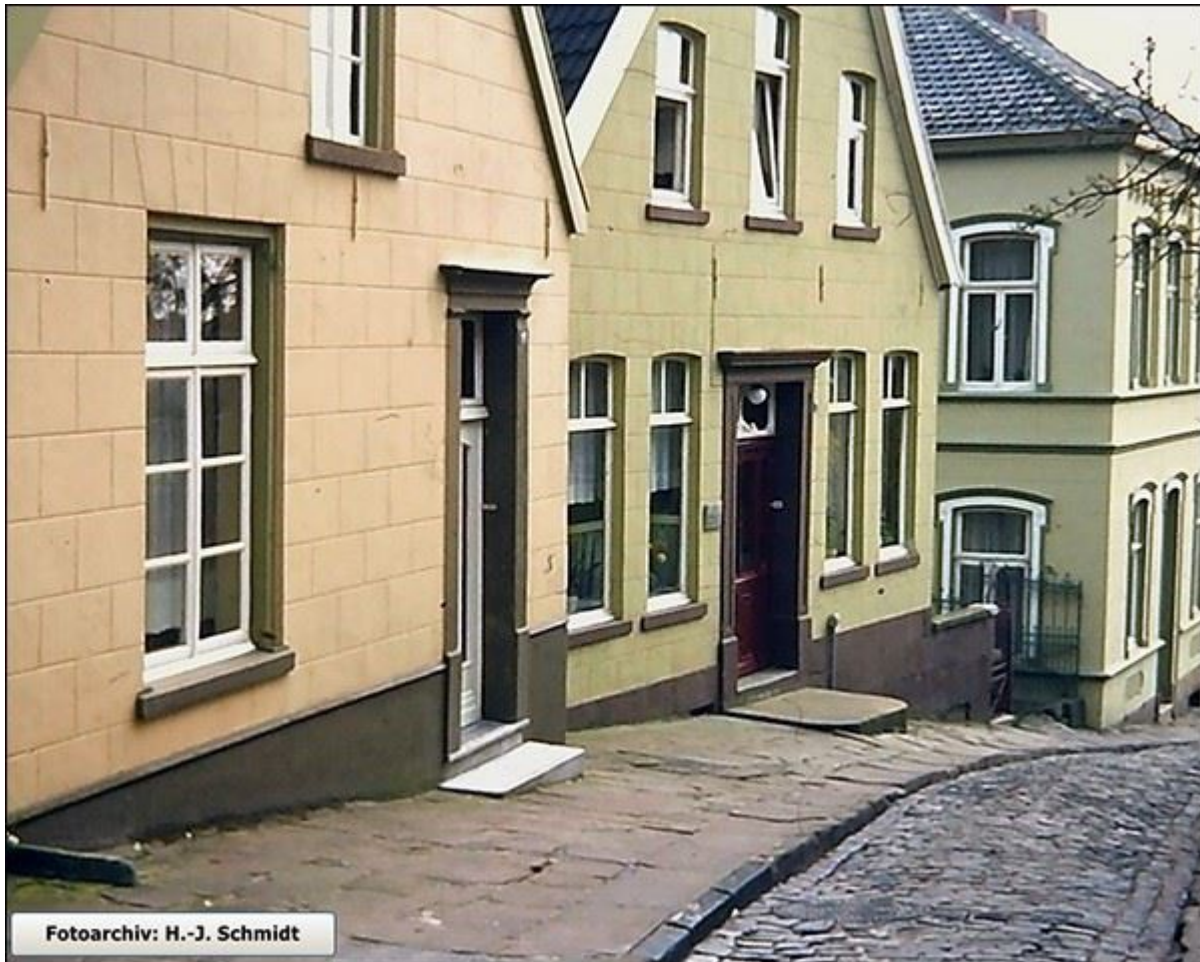
Häuser im Mittelbereich der Niehausstiege