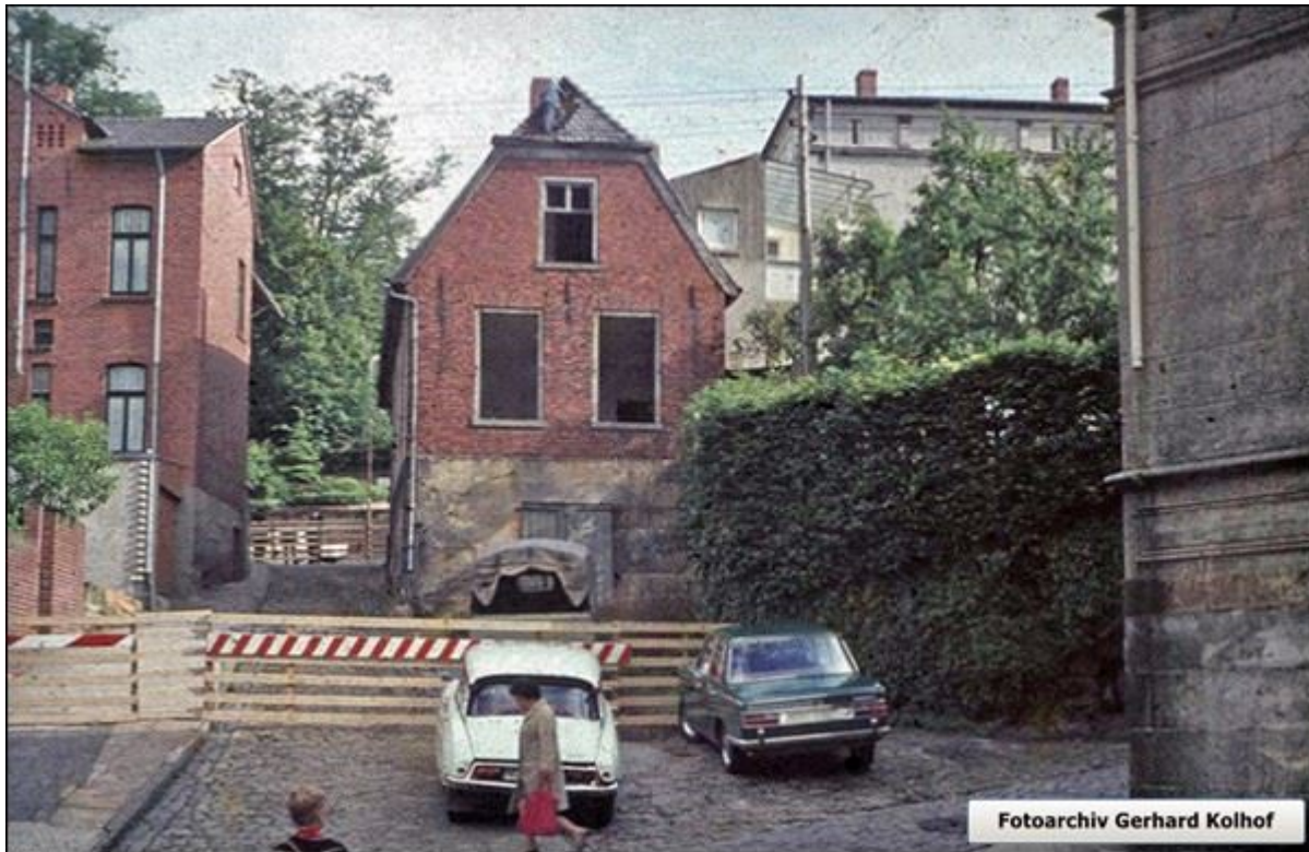
Blick auf die bereits abgesperrte Weinkellerstiege in Richtung Wilhelmstraße, links das Haus der ehemaligen F.leischerei Gerhard. Auf dem Dach des zum Abbruch freigegebenen Hauses rettet ein Dachdecker alte Dachziegel.