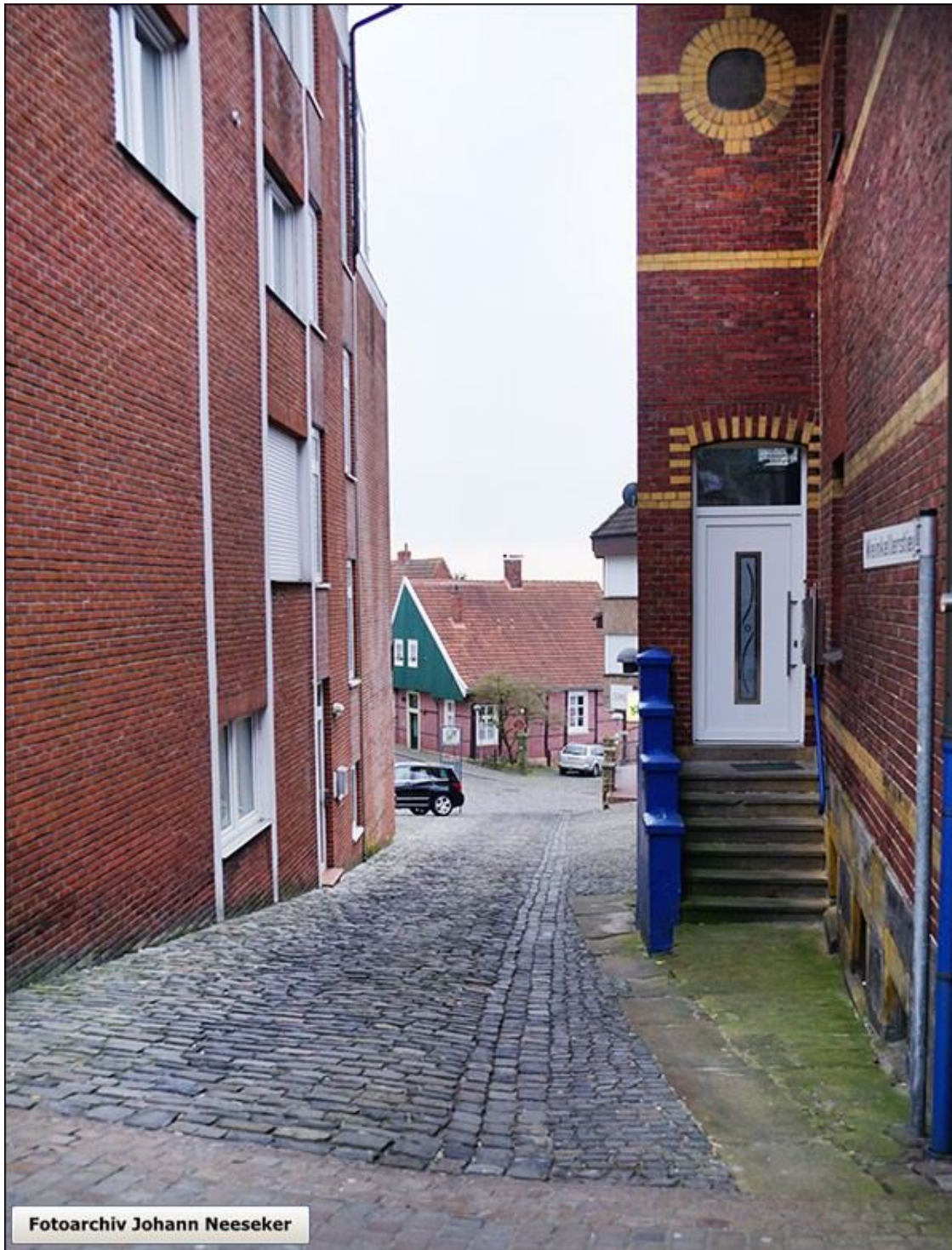
Die Weinkellerstiege nach Süden, Blick hinunter zur Kirchstraße

Stiegenfreunde Bad Bentheim (Hrsg.): Stiegenkataster Bad Bentheim. Erstellt von Jürgen Schevel, © 2022. www.stiegenbadbentheim.de