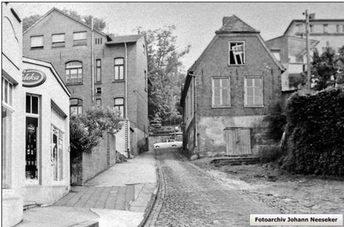
Blick nach Norden in die Weinkellerstiege. Links, angeschnitten, das ehemalige Hut-, Schirm- und Lebensmittelgeschäft Meckfessel.