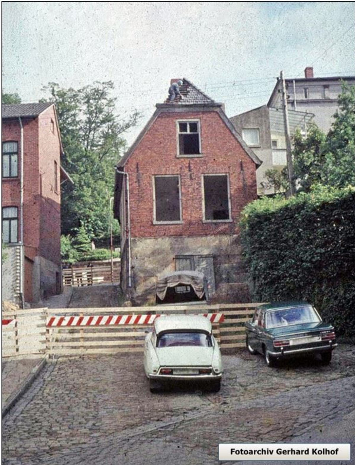
Blick auf die Weinkellerstiege in Richtung Norden, zur Wilhelmstraße. Auf dem Dach des zum Abbruch bestimmten Hauses rettet ein Dachdecker alte Dachziegel.