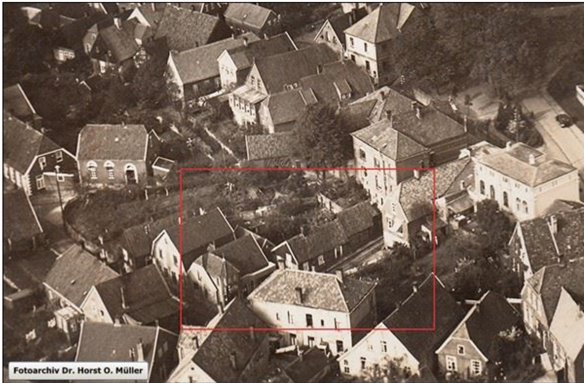
Historische Häuser an der Westseite der Weinkellerstiege um 1950.