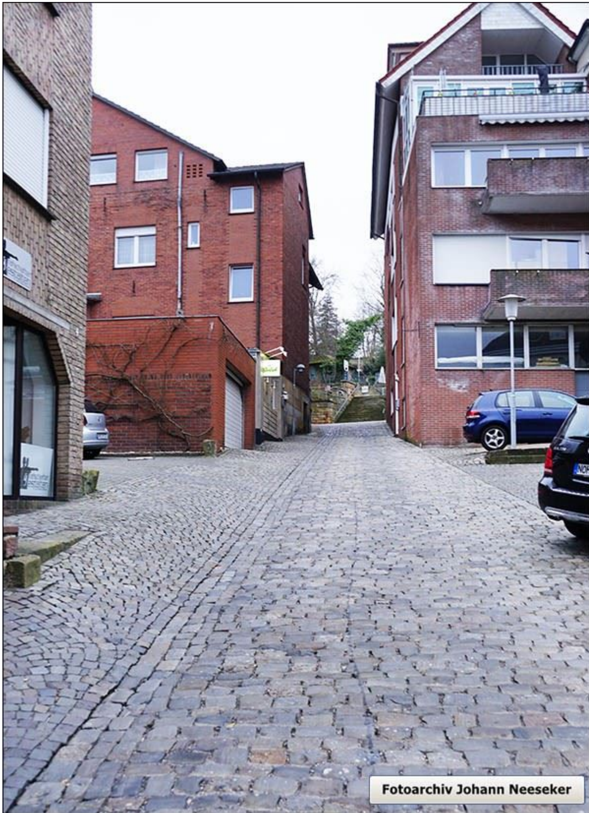
Blick in die sanierte Weinkellerstiege nach Norden.