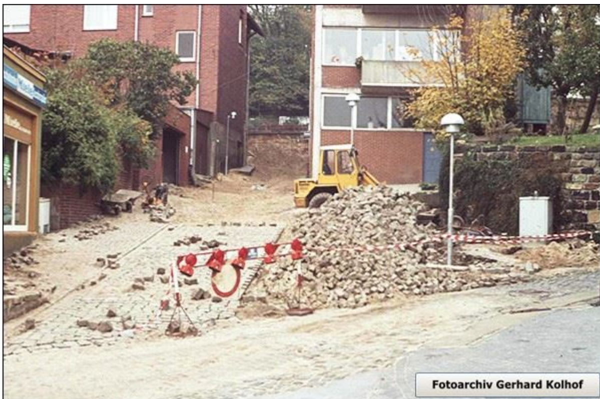
Während der Bauarbeiten, Blick nach Norden, zur Wilhelmstraße, 1980.