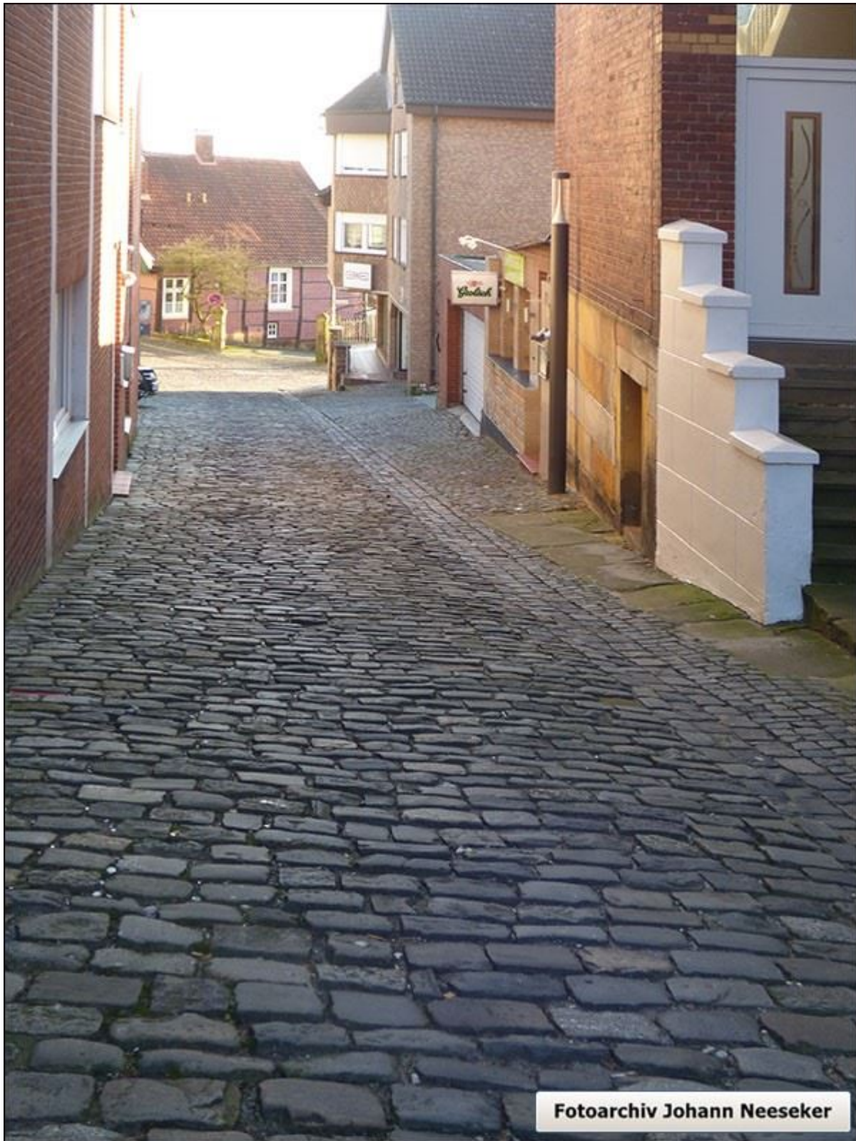
Die Weinkellerstiege nach Süden, Blick hinunter zur Kirchstraße.