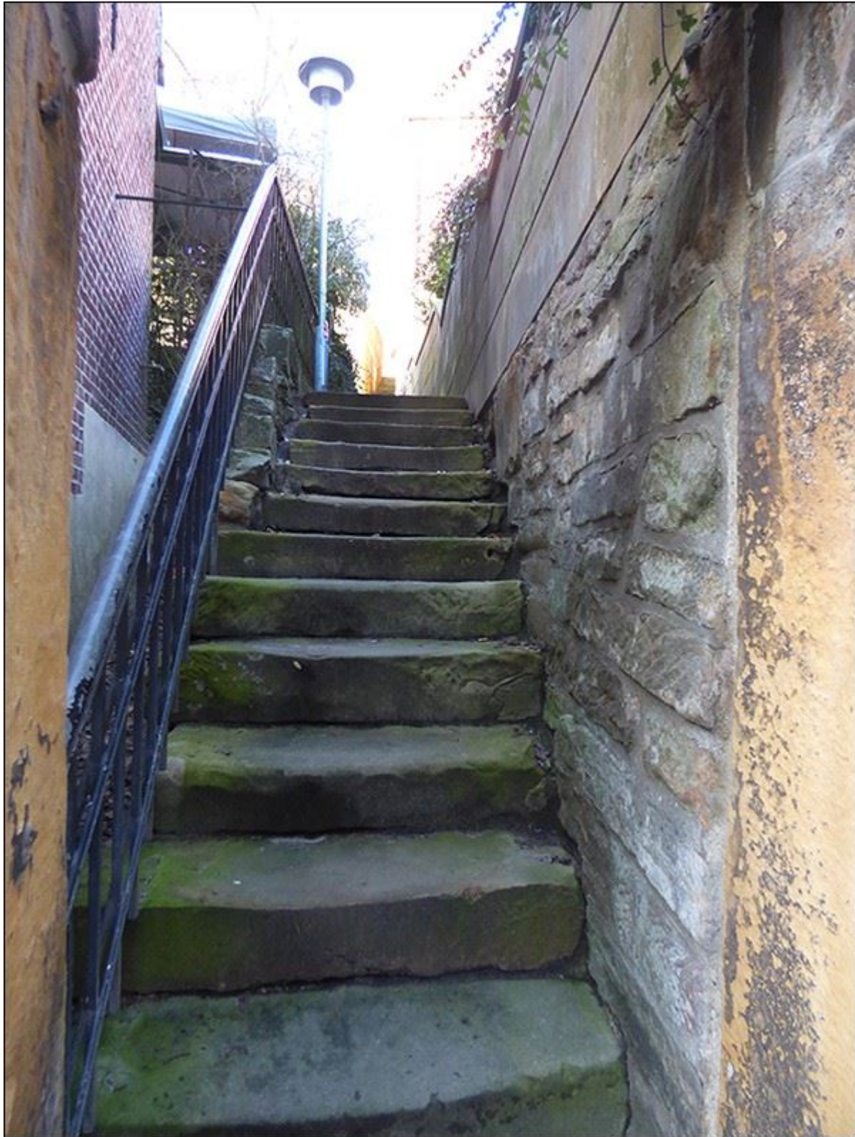
Blick aus der oberen Reuterstiege nach Norden