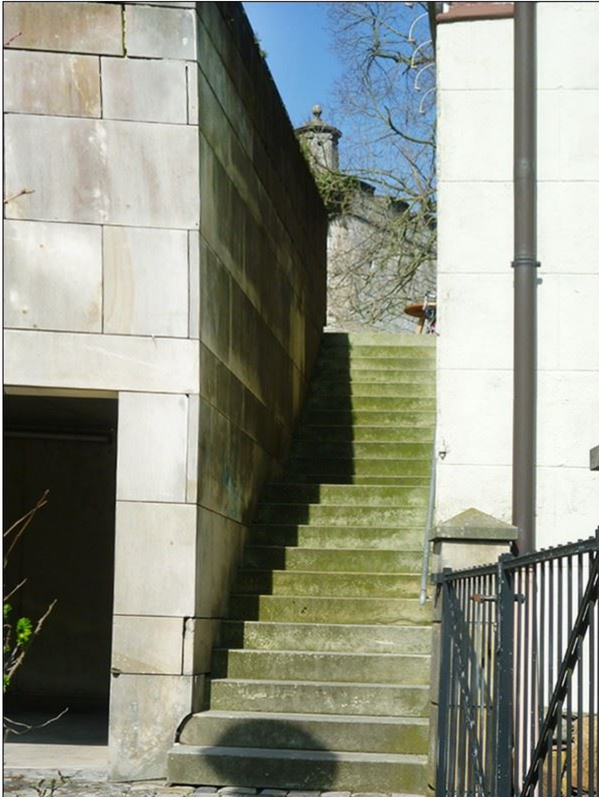
Blick aus der oberen Reuterstiege nach Norden