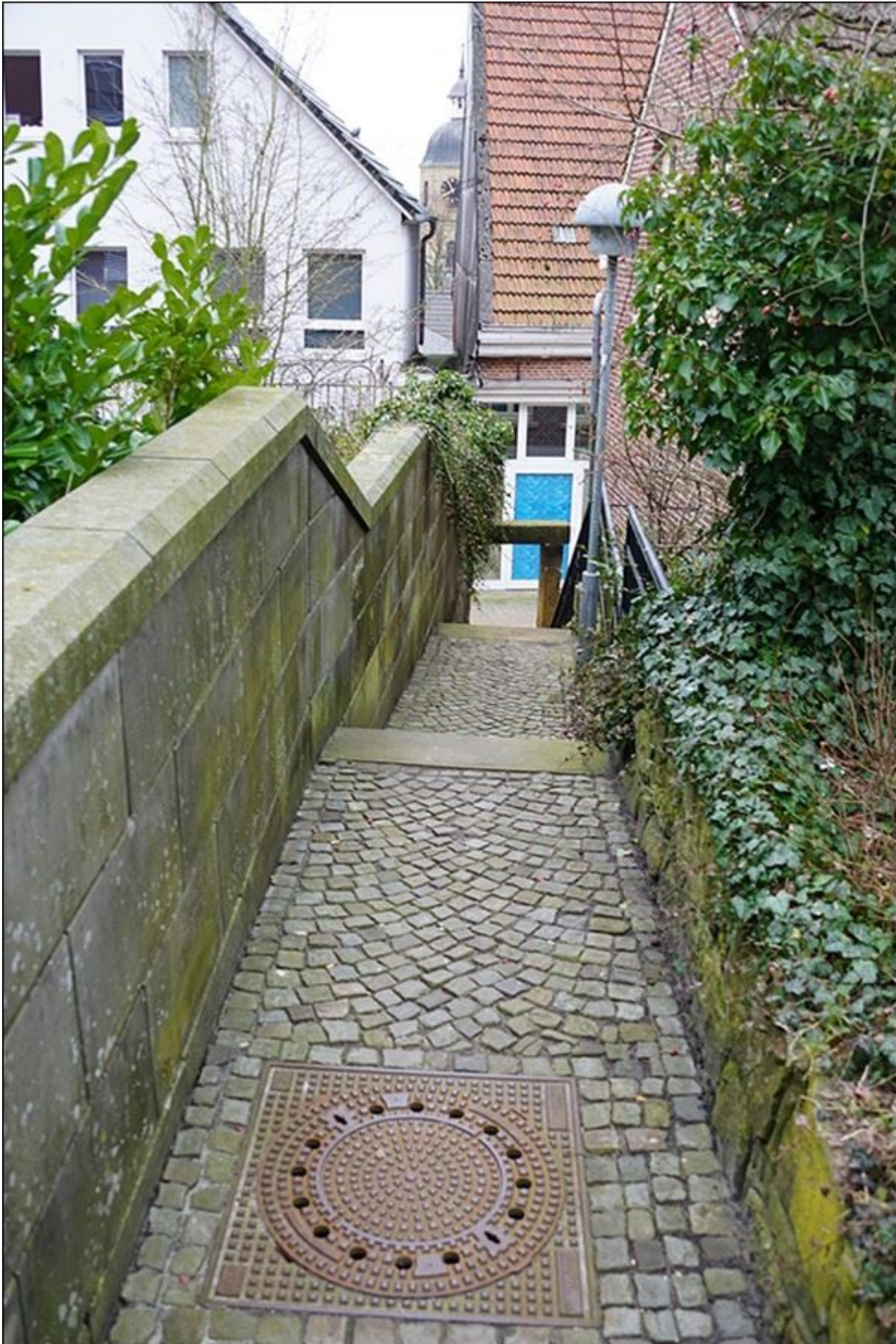
Blick aus Reuterstiege, weiter oben, nach Süden