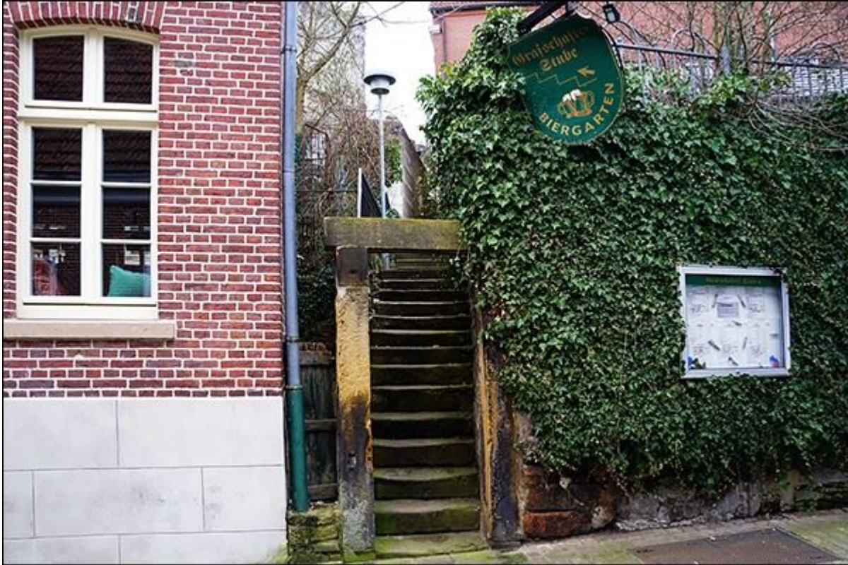
Blick aus der Wilhelmstraße zur Reuterstiege, nach Norden