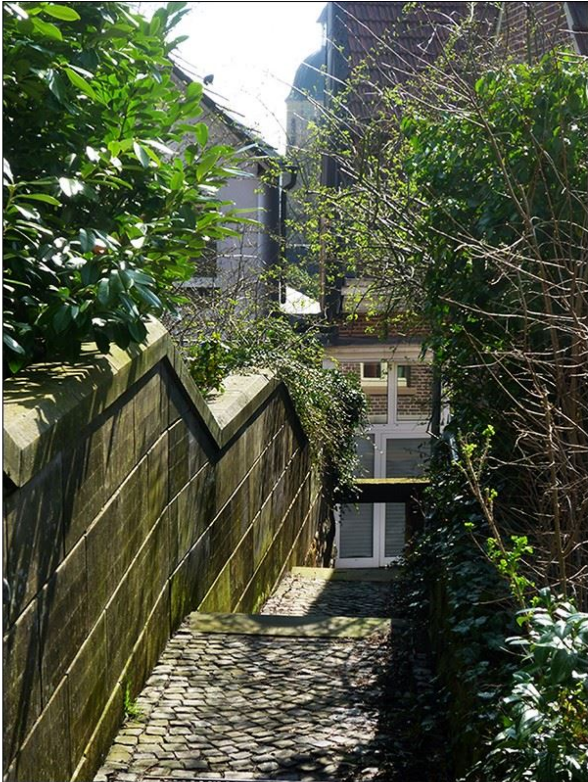
Blick aus Reuterstiege nach Süden