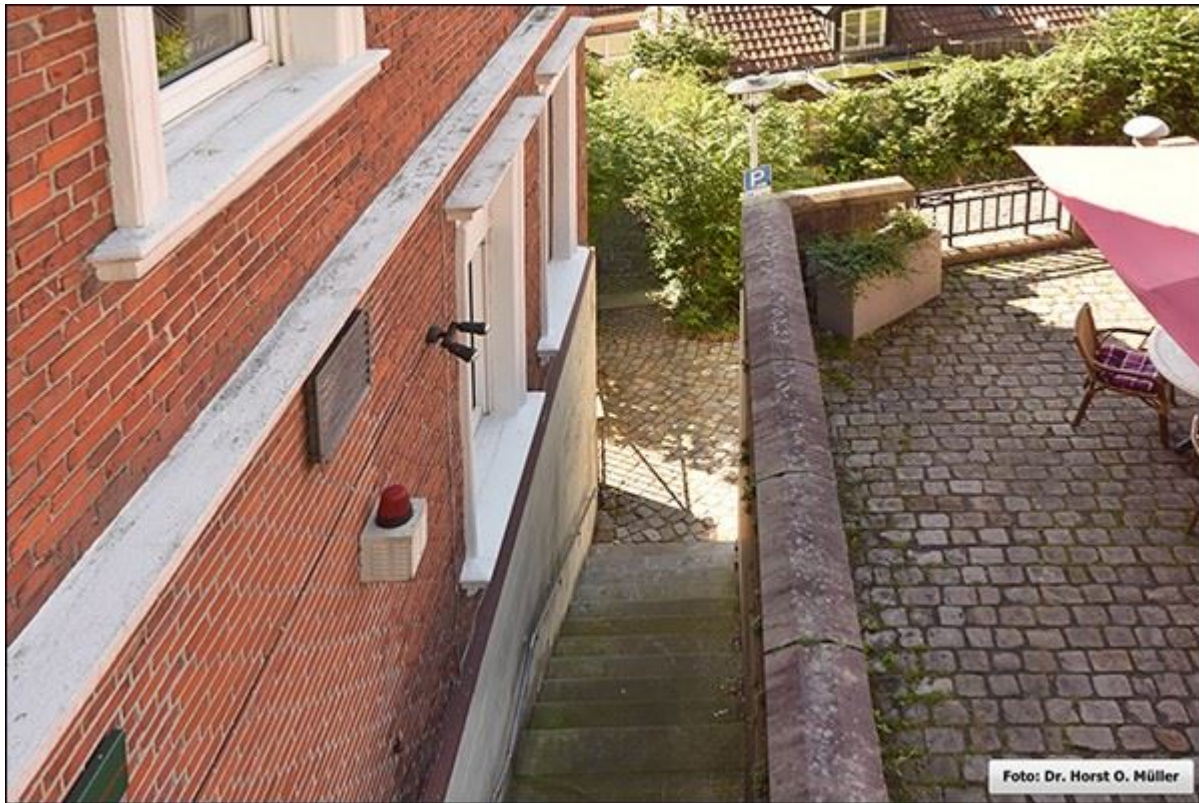
Blick aus oberen Reuterstiege nach Süden

Stiegenfreunde Bad Bentheim (Hrsg.): Stiegenkataster Bad Bentheim. Erstellt von Jürgen Schevel, © 2022. www.stiegenbadbentheim.de