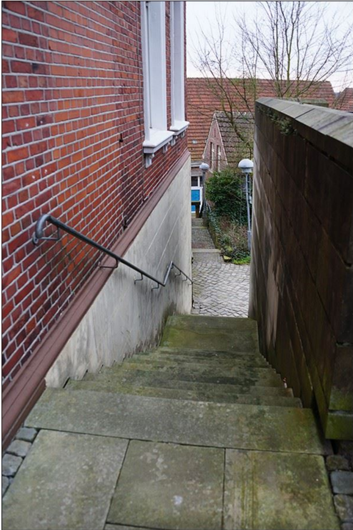
Blick aus oberen Reuterstiege nach Süden