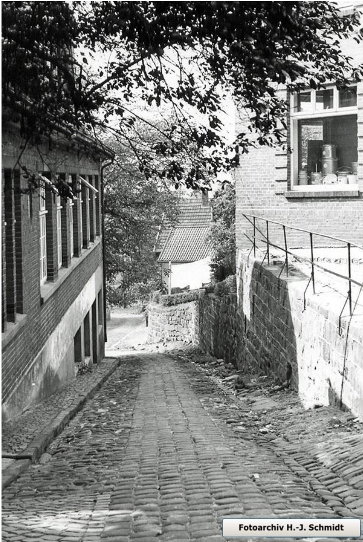
Blick von der Wilhelmstraße in die westliche Hellendoornstiege, nach Südwesten. Rechts eine Fensterauslage des Haushalts- und Porzellanwarengeschäfts Wittenbrink.