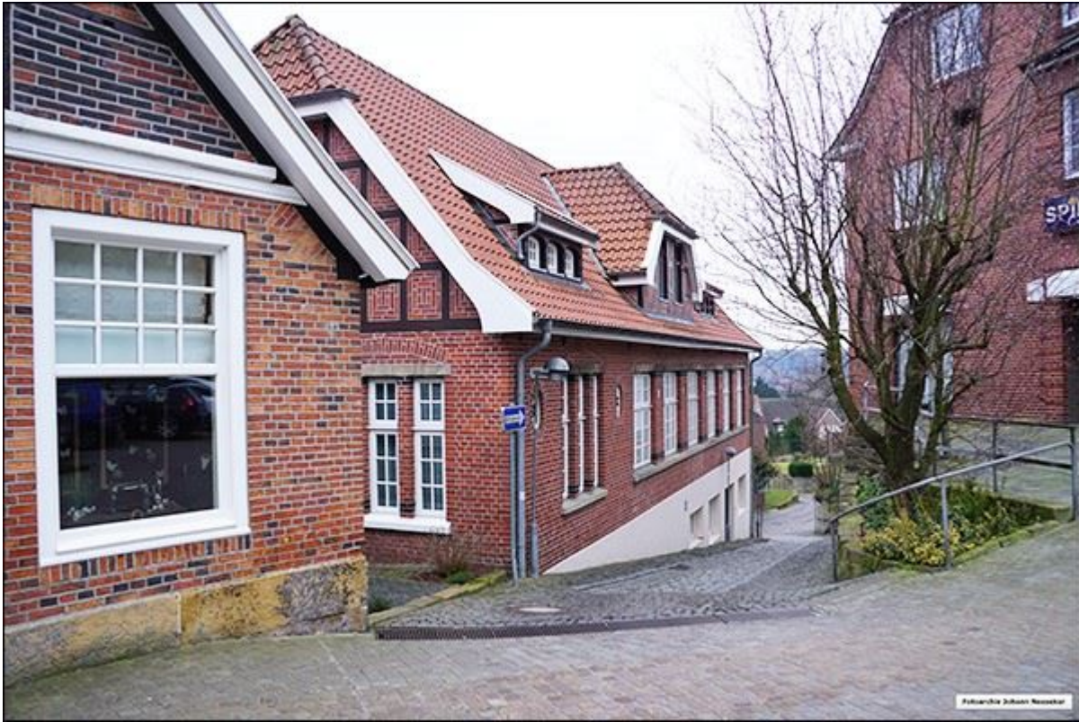
Blick aus der Wilhelmstraße zur ehemaligen Druckerei Hellendoorn in der westlichen Hellendoornstiege.