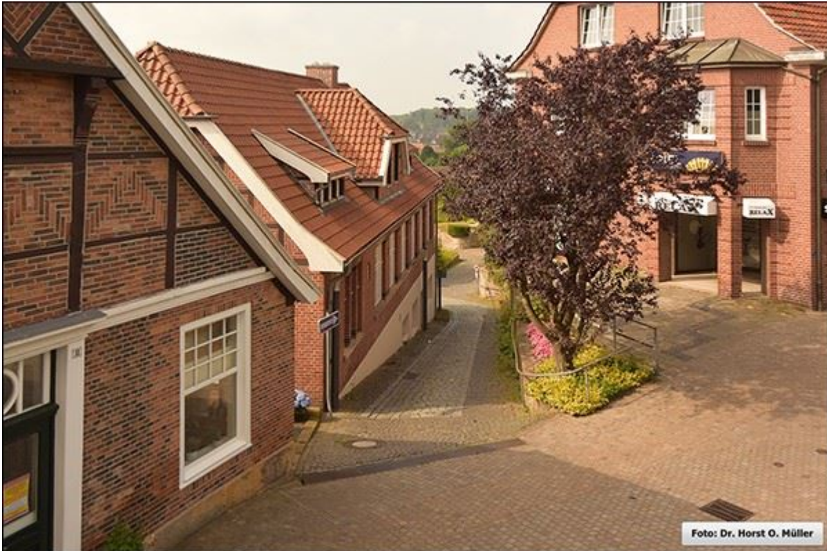
Blick aus erhöhter Position auf die Hellendoornstiege