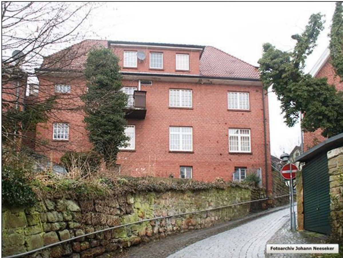
Blick aus der Kirchstraße in die westliche Hellendoornstiege.