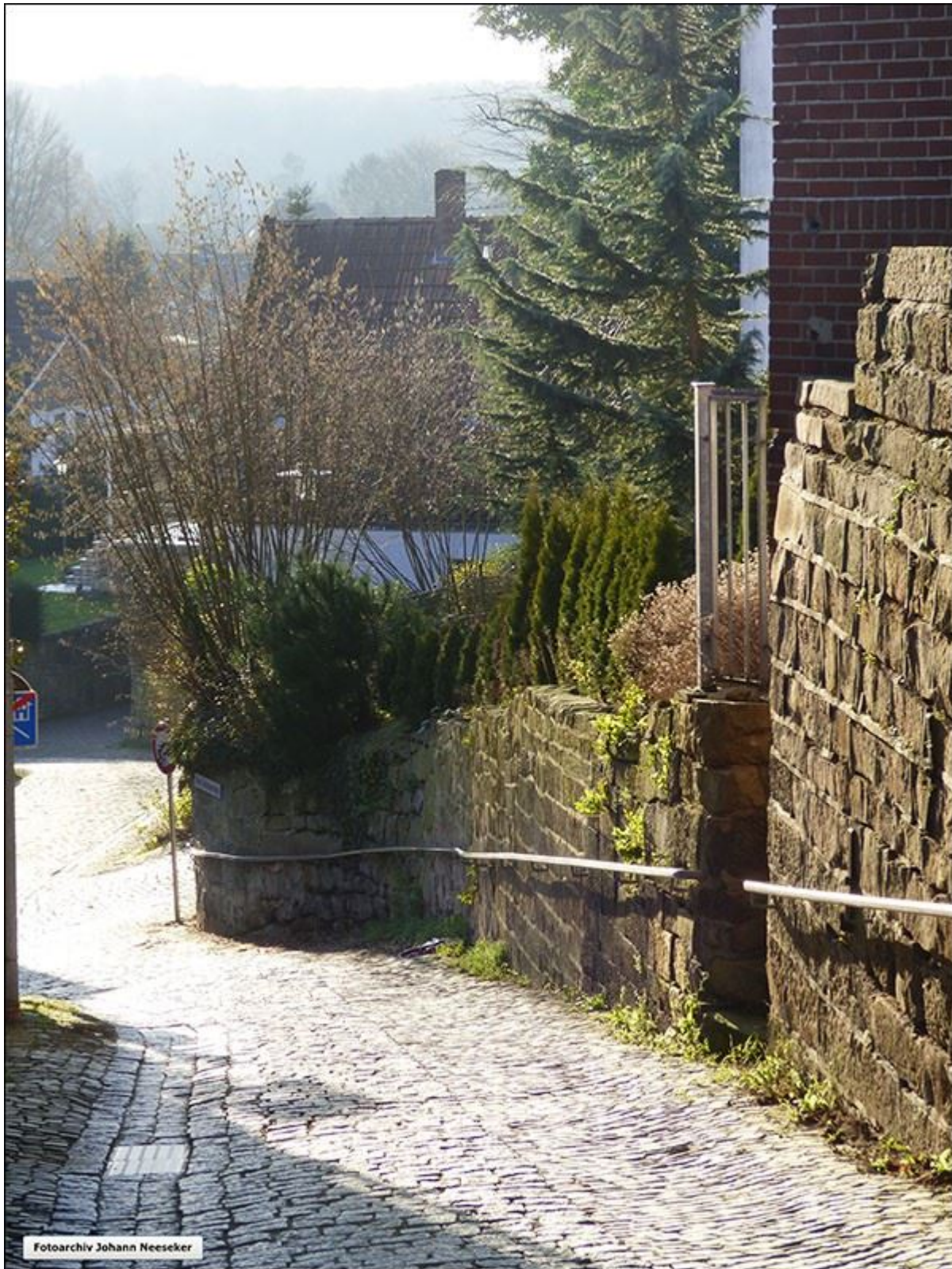
Untere westliche Hellendoornstiege, Blickrichtung Südwest.