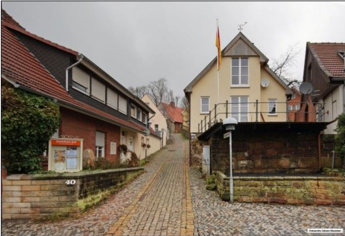
Blick von der Wilhelmstraße in die Schoppenstiege, neuere Bebauung.