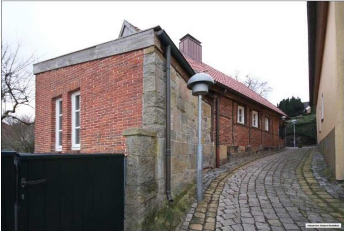
Historische Bausubstanz und moderne Anbauten in der Schoppenstiege.