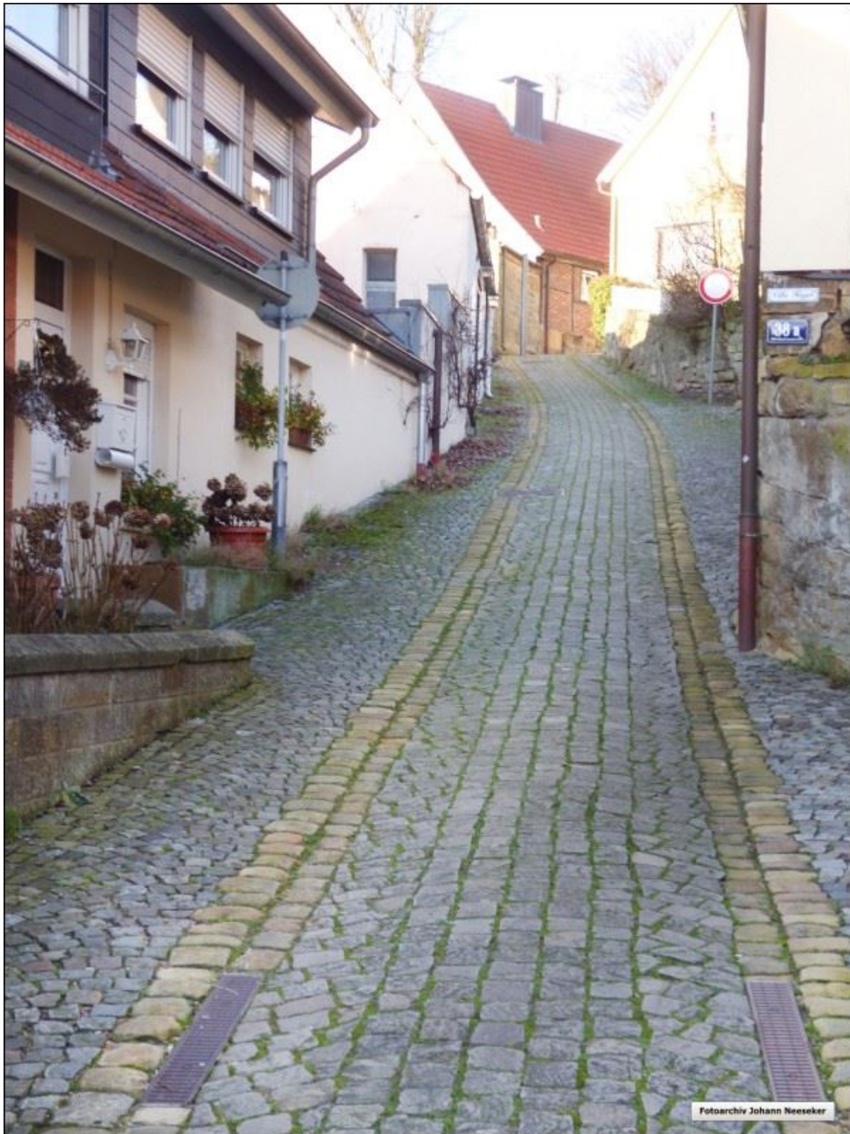
Die Schoppenstiege in Richtung Norden.