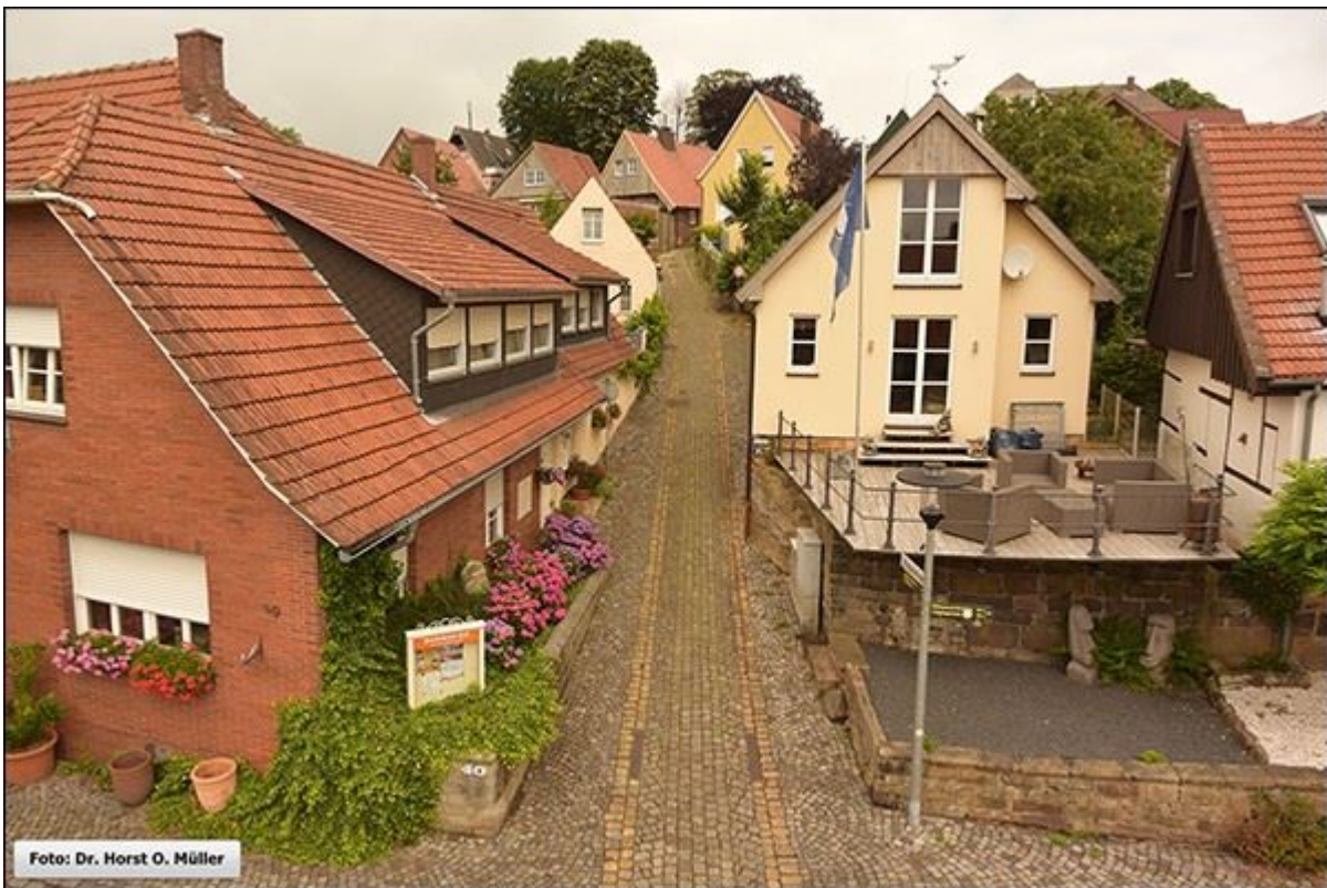
Blick in die Schoppenstiege, nach Norden, 2020