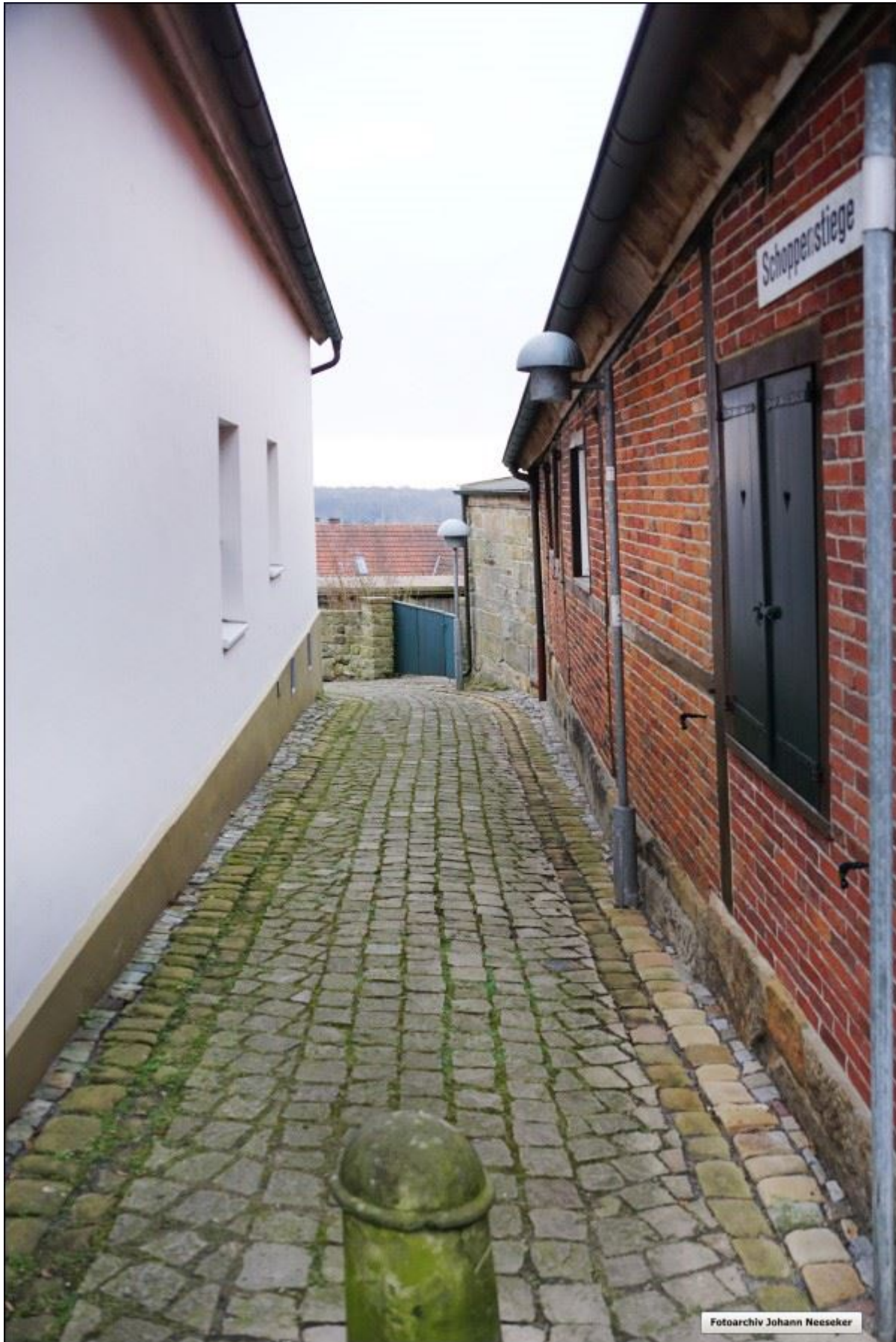
Die obere Schoppenstiege, aktuelle Ansicht nach Süden.