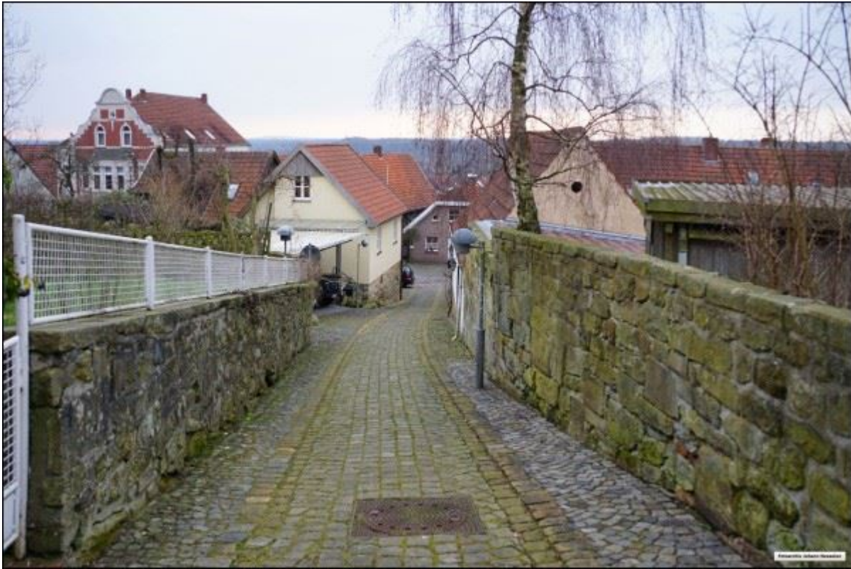
Die für die Schoppenstiege typische Mauerbegrenzung, Blick nach Süden.