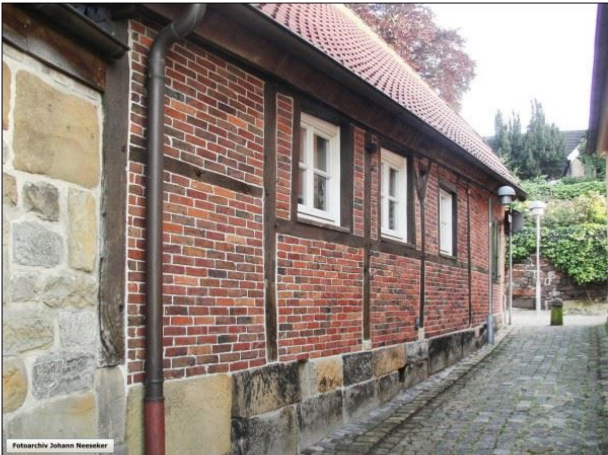
Renoviertes Fachwerkhaus an der oberen Schoppenstiege, Blick nach Norden. Stiegenkataster, erstellt von Jürgen Schevel - Nach Norden ablaufende Stiege - Seite 08