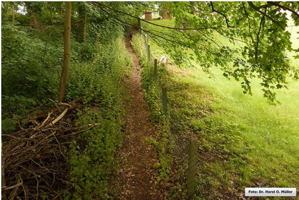
Weiterer Verlauf der Rümbültstege in Richtung Süden.