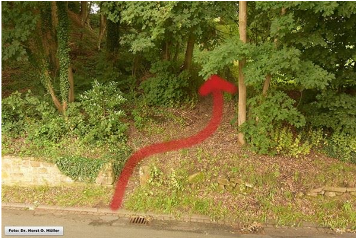
Südlicher Beginn der Rümbültstege, an der Schüttorfer Strasse.