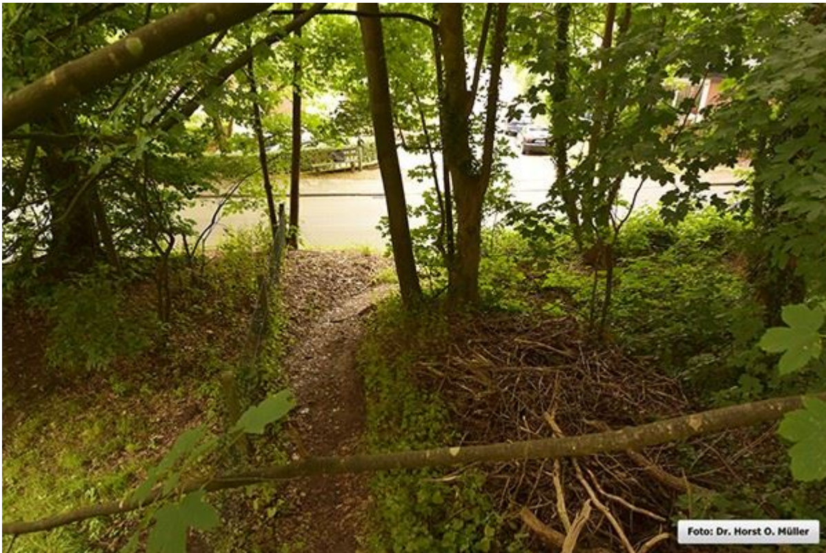
Blick aus der Rübültstege nach Norden, in Richtung Schüttorfer Strasse