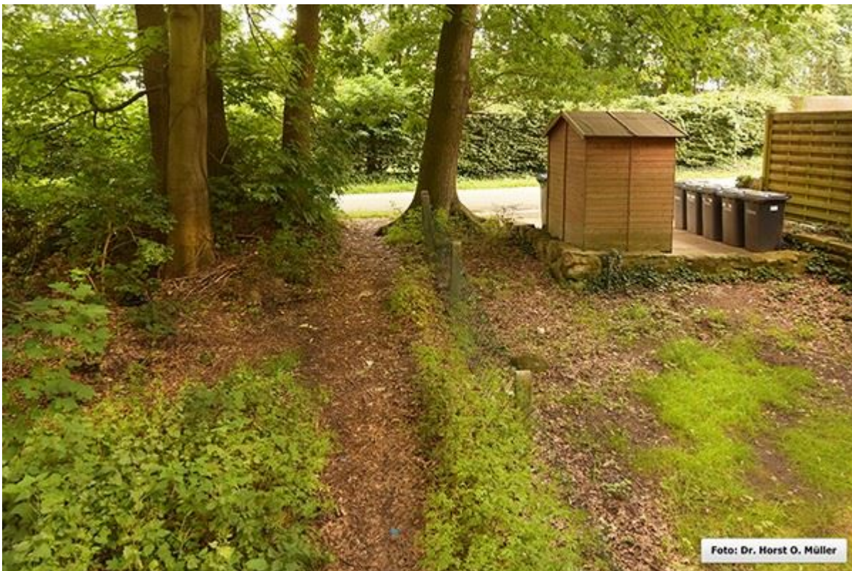
Rübültstege, oberer Bereich, Blick nach Süden